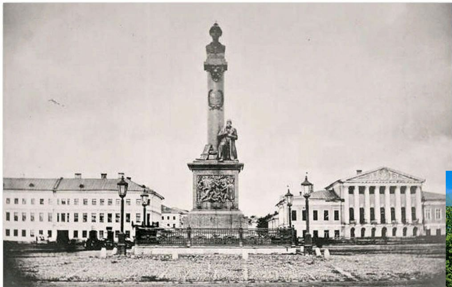
Памятникъ царю Михаилу Федоровичу и гражданину Ивану Сусанину въ Костромѣ.