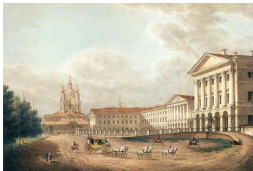
Галактионов "Смольный институт"

Для подготовки будущих хозяек и матерей воспитанниц обучали ведению домашнего хозяйства, вышиванию, шитью. Но главной целью воспитания было формирование «новой дворянской женщины»,