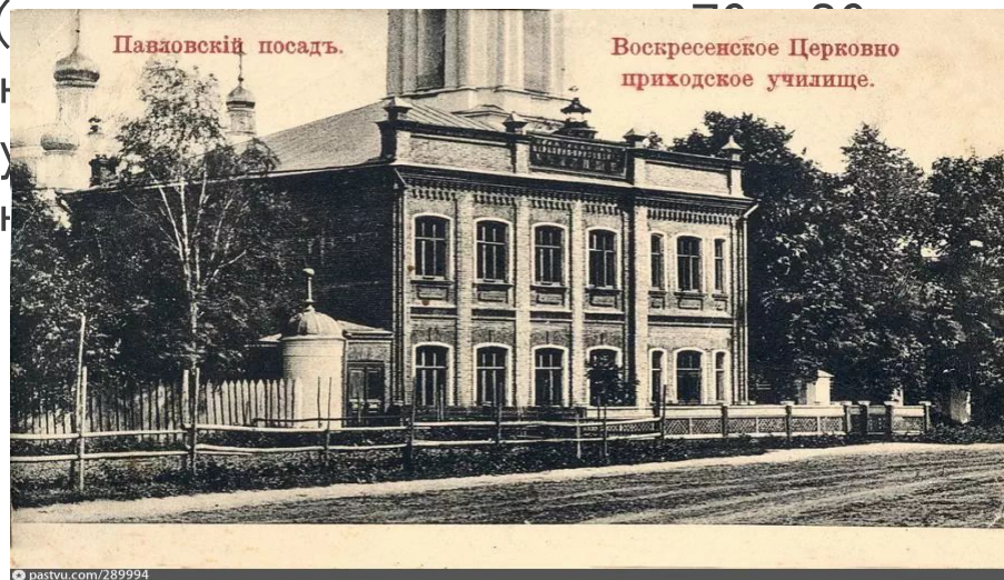
Воскресенская церковно-приходская школа

В 686 уездных городах России к 1825 году было только 1095 низших учебных заведений. Учебников не было, все заучивалось «с голоса» и «на зубок». Соединение в одном классе детей 6-7 лет с юношами 14-15 лет, перегруженность