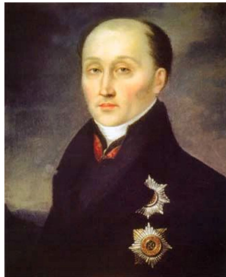
Государственный деятель и законотворец М. М.