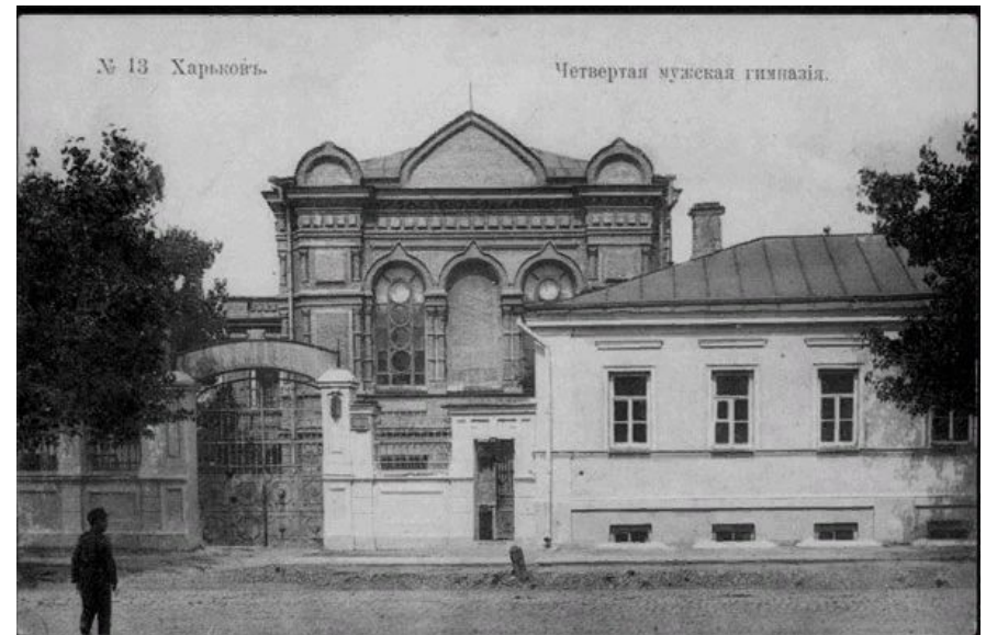
4-я мужская гимназия, Харьков, 19 век.

В приоритете были общественные науки, отсутствовали религиозные дисциплины. Изучение предметов проводилось по циклам, каждый из которых вел один из восьми учителей. 30 учебных часов составляли недельный учебный план. Для надзора за учащимися учреждались должности классных надзирателей,