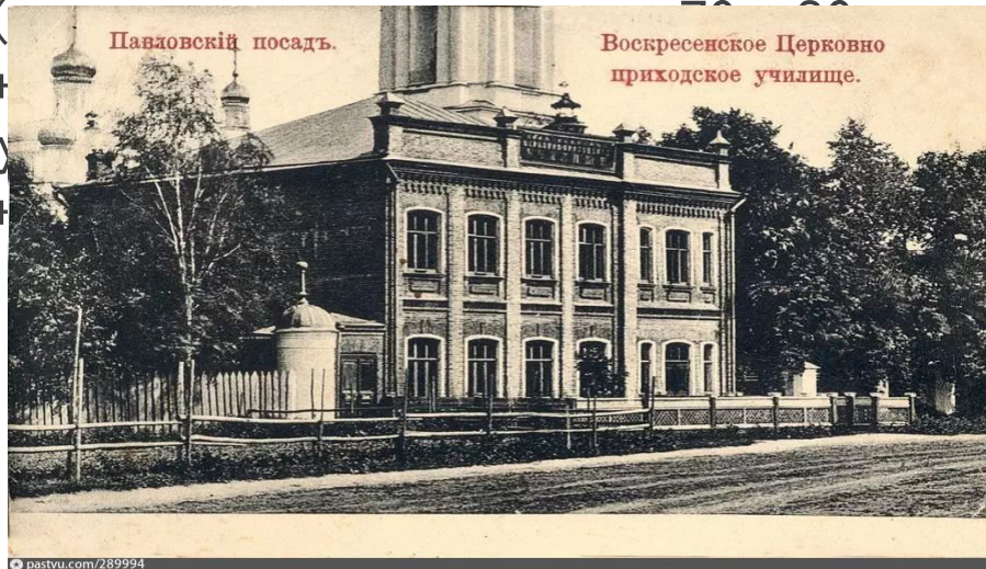
Воскресенская церковно-приходская школа

В 686 уездных городах России к 1825 году было только 1095 низших учебных заведений. Учебников не было, все заучивалось «с голоса» и «назубок». Соединение в одном классе детей 6-7 лет с юношами 14-15 лет, перегруженность