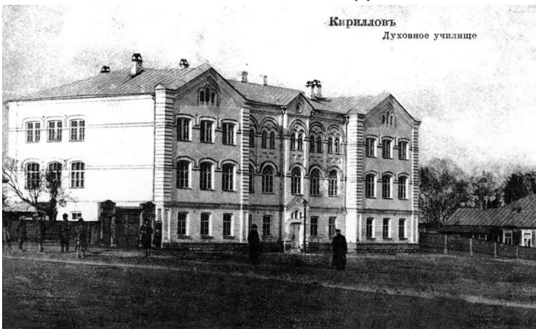
Кирилловское уездное духовное училище.