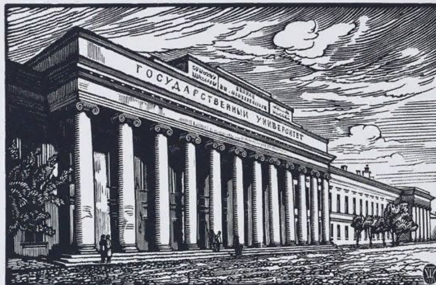
Казанский императорский университет. Гравюра