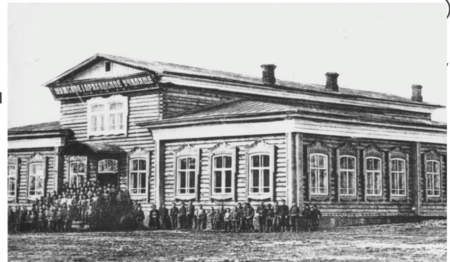
Здание мужского приходского училища.