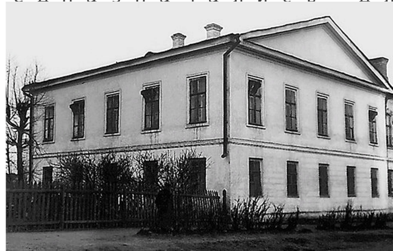
Челябинское уездное училище