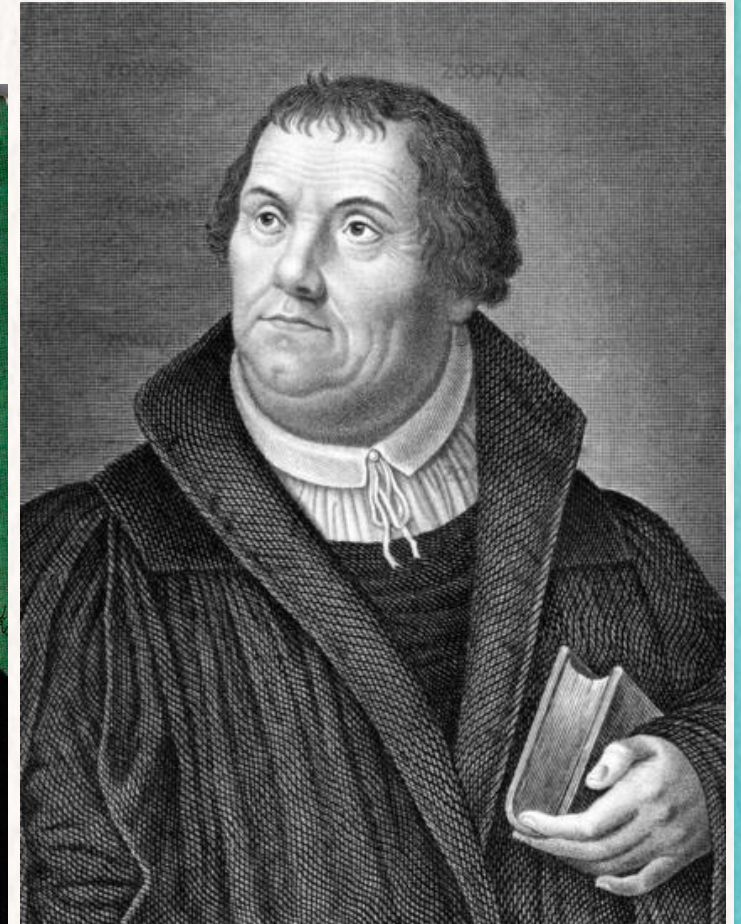
Мартин Лютер 10 ноября 1483 — 18 февраля 1546