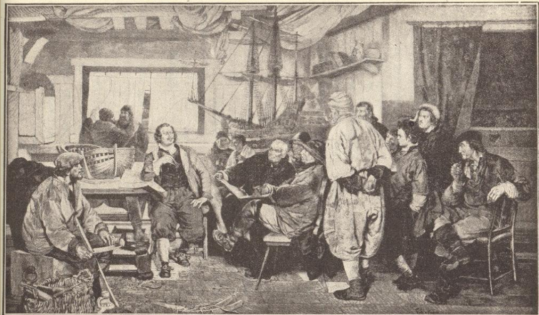
PETER THE GREAT AS A SHIPWRIGHT IN HOLLAND (From a painting by Cogen.)