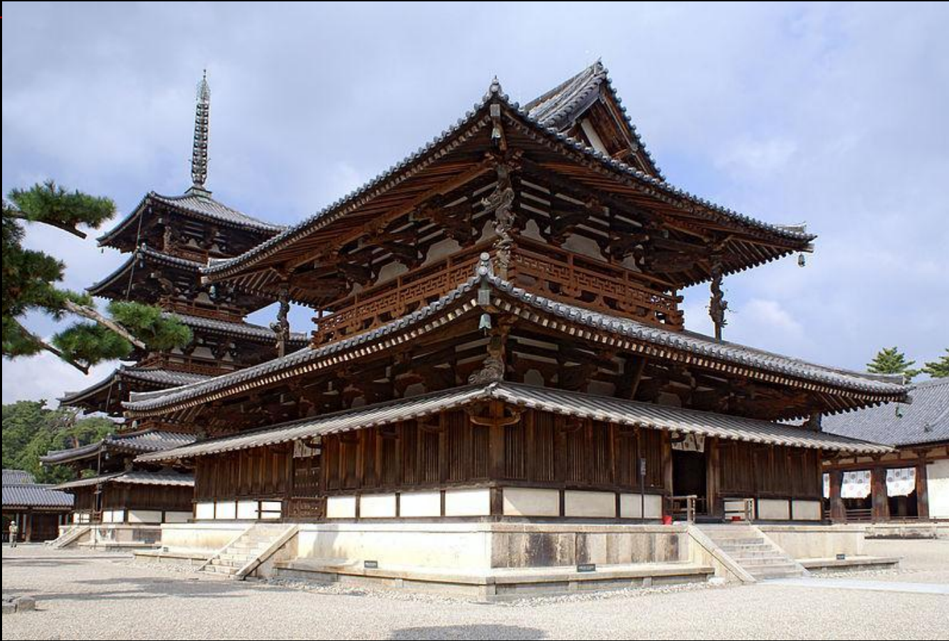
Золотой зал и пагода в Хорю-дзи , 607 год