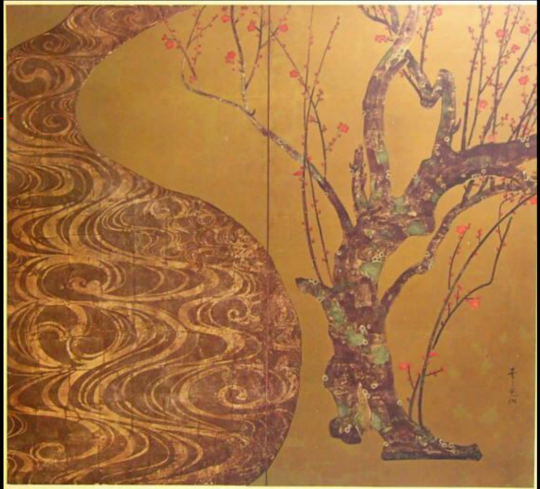
Цветение сливы красным и белым. Роспись на ширме