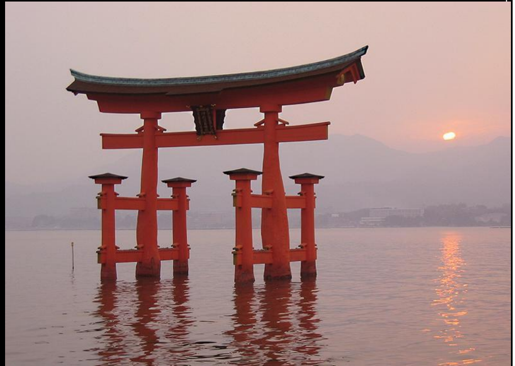
Тории святилища Ицукусима