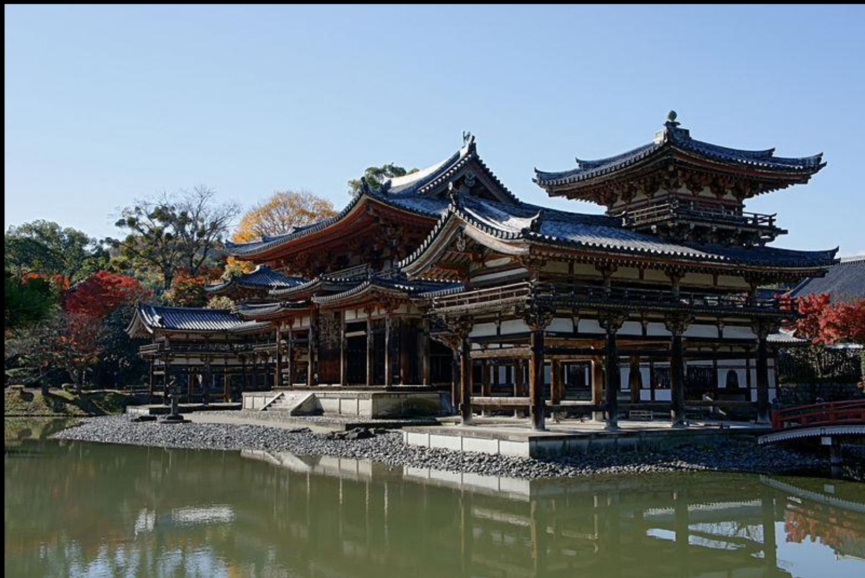
■ Храм Феникса (храм Хоодо) в монастыре Бёдо-ин