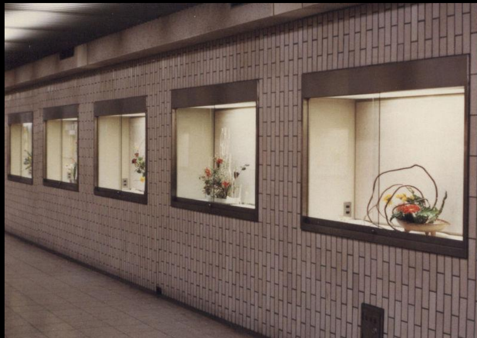
Выставка икебаны в метро Киото