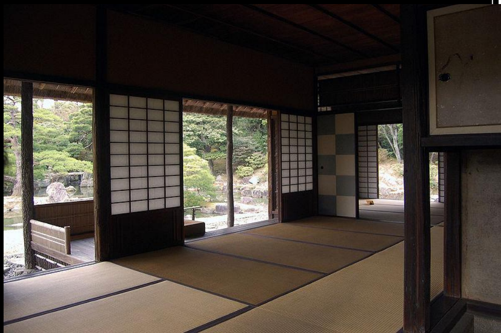
Павильон Сёкинтэй Во дворце Кацура