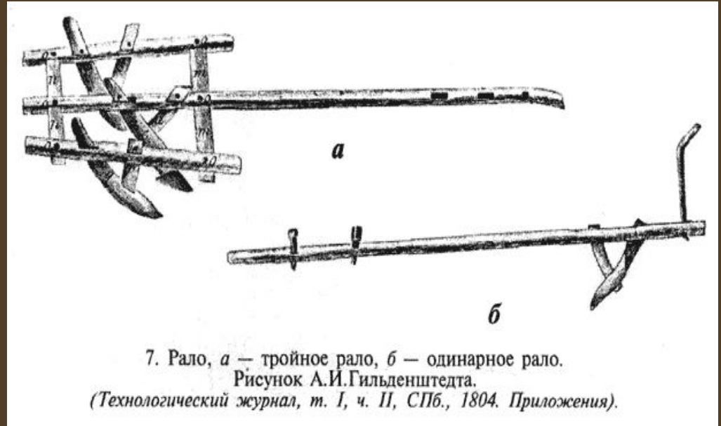
7. Рало, a — тройное рало, б — одинарное рало.