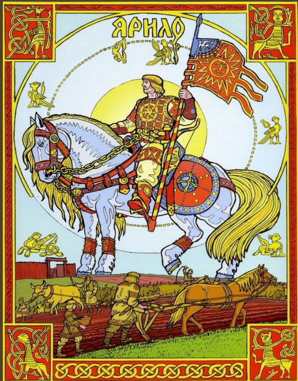
Ярило- бог весны