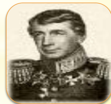
И. Ф. Крузенштерн