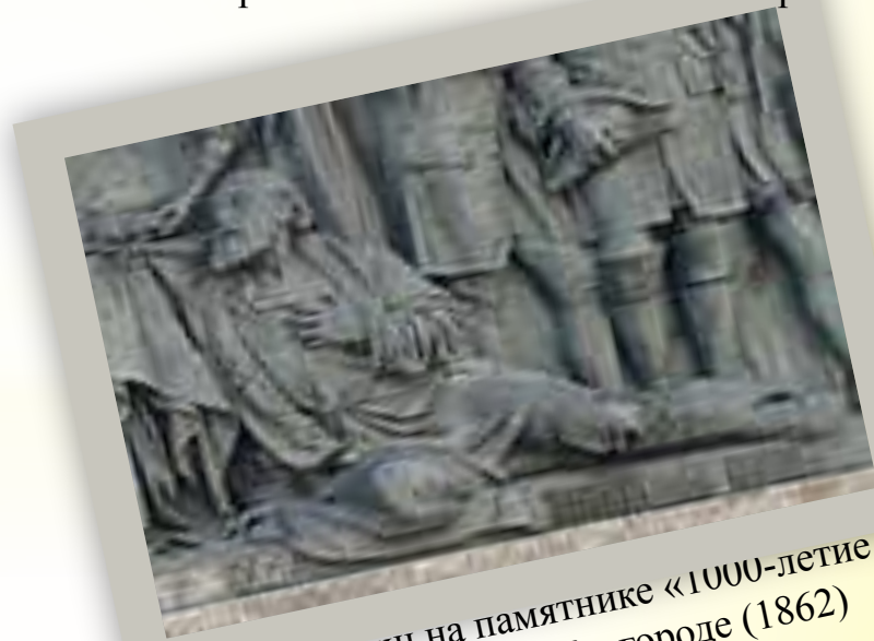
Иван Сусанин на памятнике «1000-летие России» в Великом Новгороде (1862)