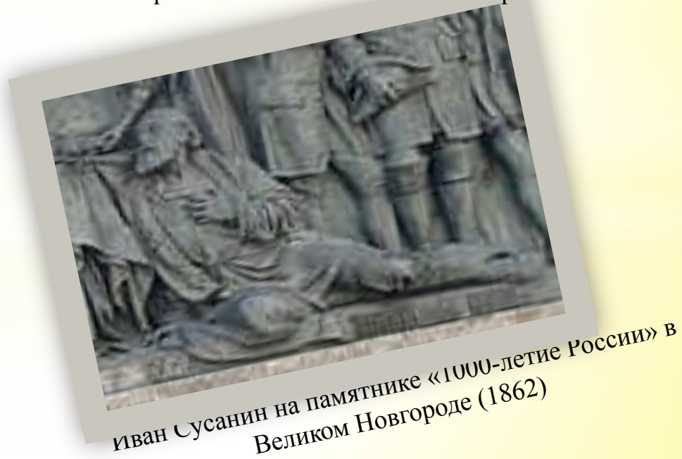
Иван Сусанин на памятнике «1000-летие России» в Великом Новгороде (1862)