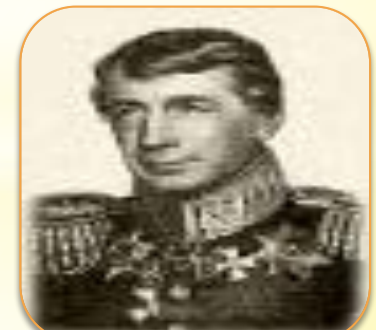
И. Ф. Крузенштерн