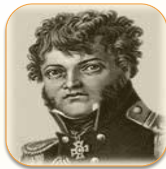
Ю Ф. Лисянский