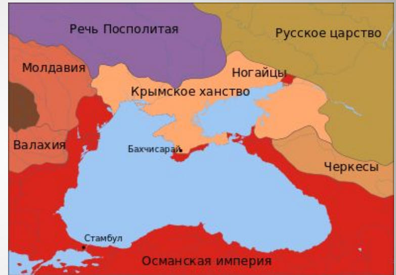
Крым в XVII веке. ↑