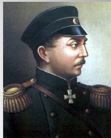
Адмирал Нахимов ↑