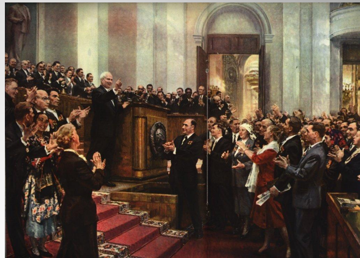
Н.С.Хрущёв объявляет о передаче Крыма Украине