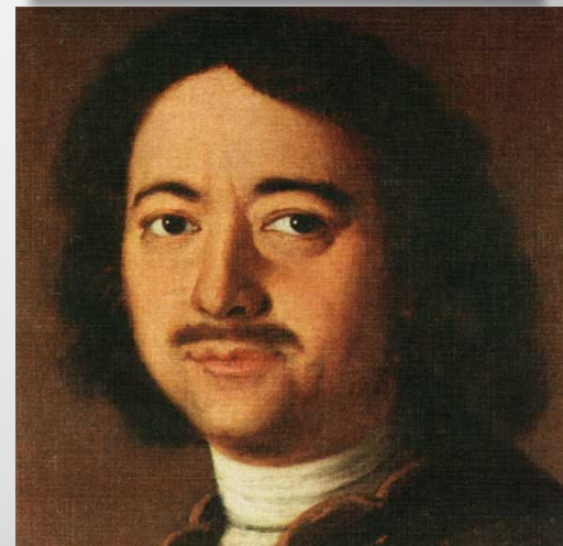
Петр I. ↑