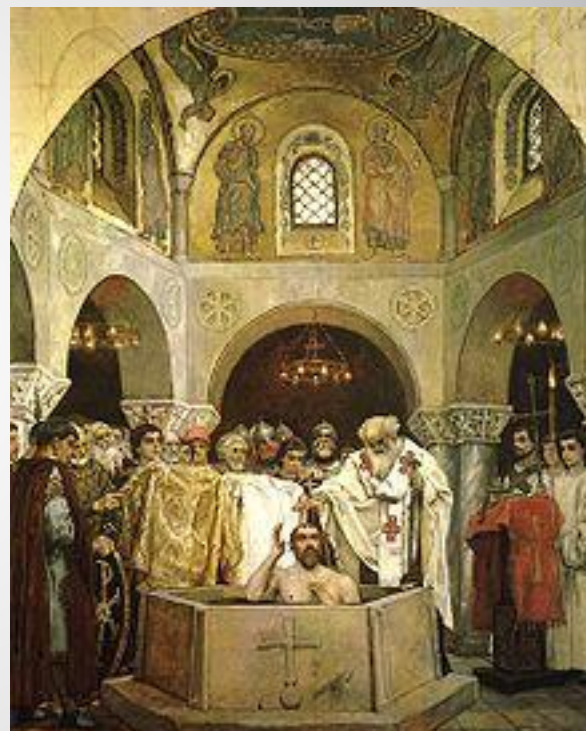
Крещение Владимира ↑