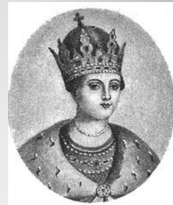
Царевна Софья ↑