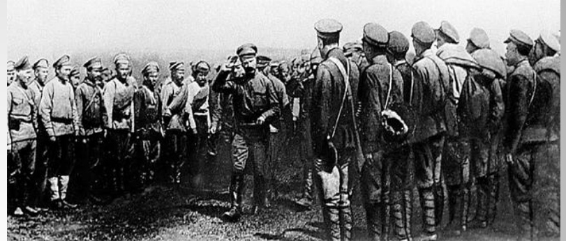
М.В.Фрунзе на фронте ↑