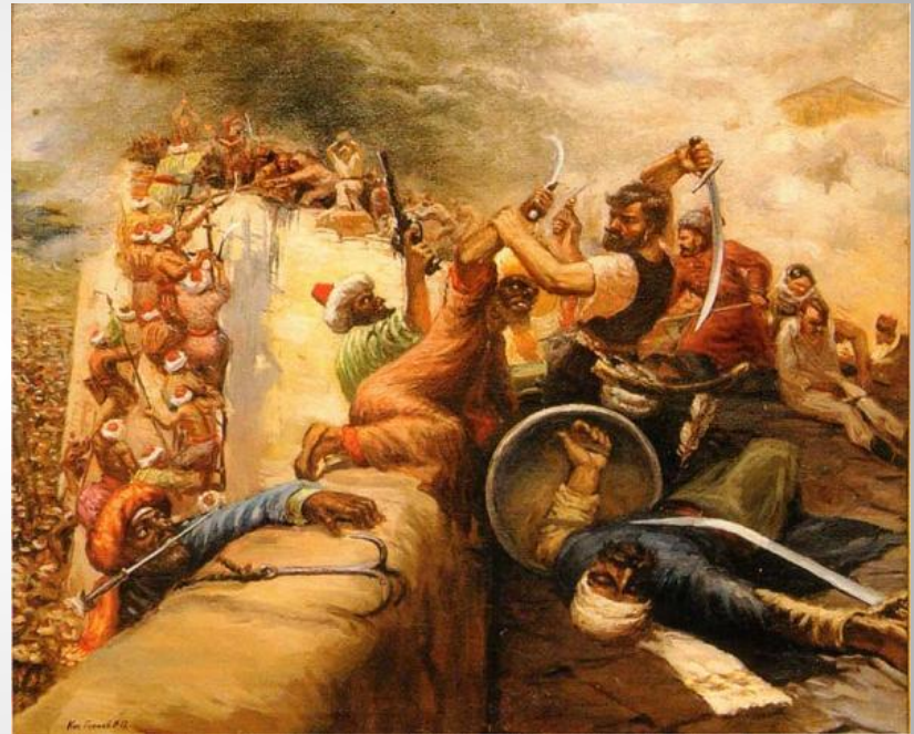
Казаки берут Азов