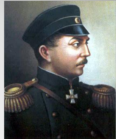
Адмирал Нахимов ↑