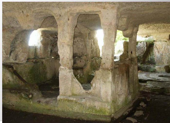
Пещерные города скифов ↑