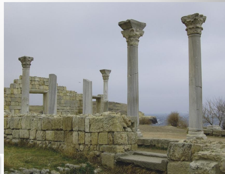
Развалины греческого храма →