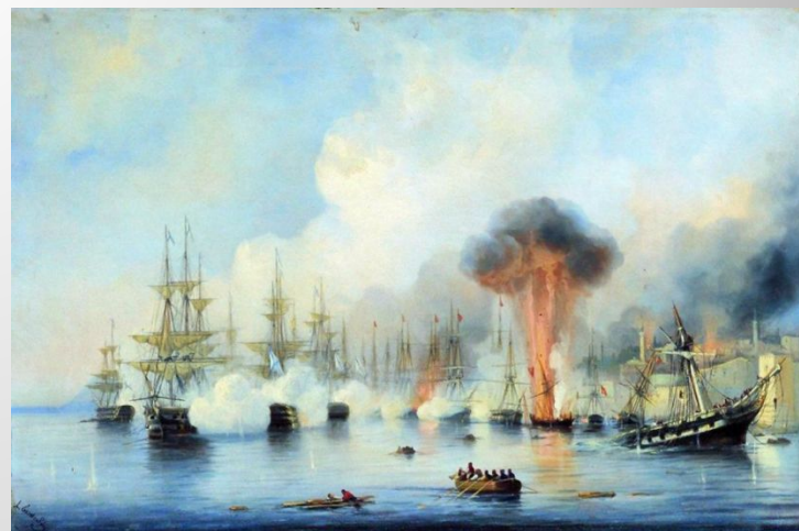
И.К.Айвазовский Синопский бой ↑