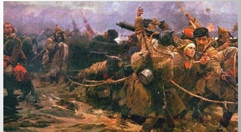
Переход через Сиваш ↑