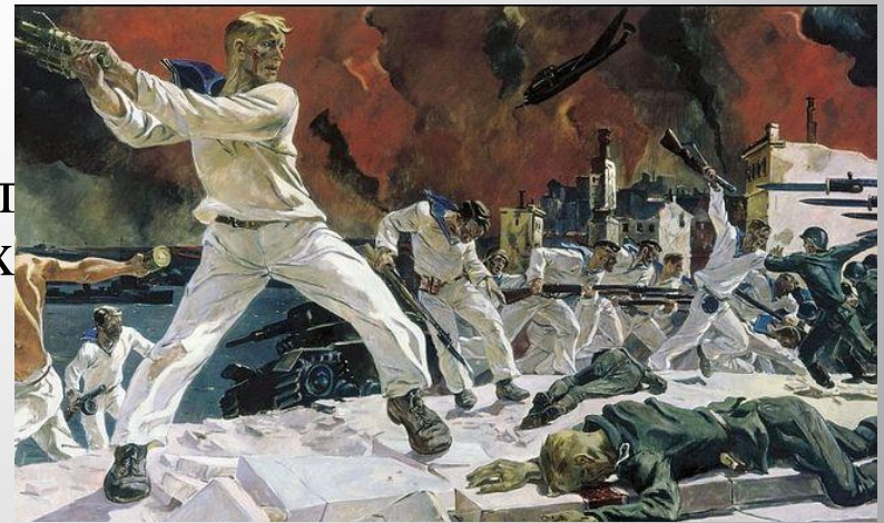
Дейнека «Оборона Севастополя» ↑