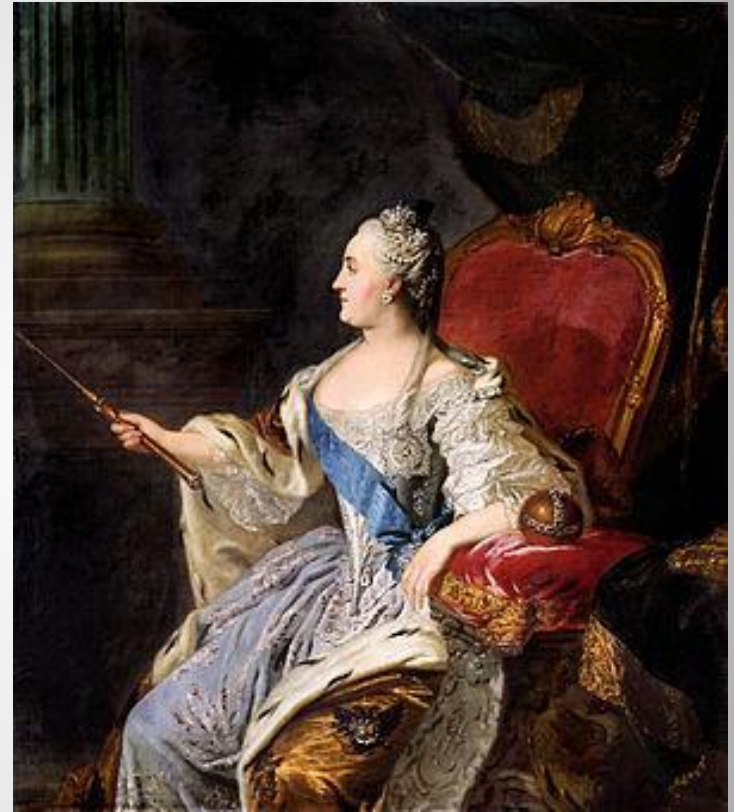
Екатерина II ↑