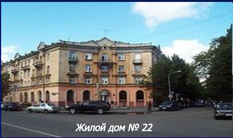
Жилой дом № 22