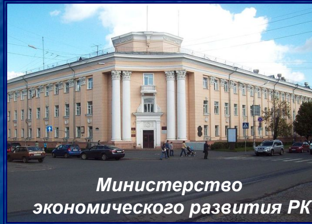
Министерство экономического развития РК

■ Здания на проспекте К.Маркса построены в стилях неоклассицизма (административные) и неоренессанса (жилые), характерных для советской архитектуры 1930-1950-х годов. Некоторые здания являются памятниками федерального значения. Все жилые дома в первых этажах имеют магазины или кафе с витринами.