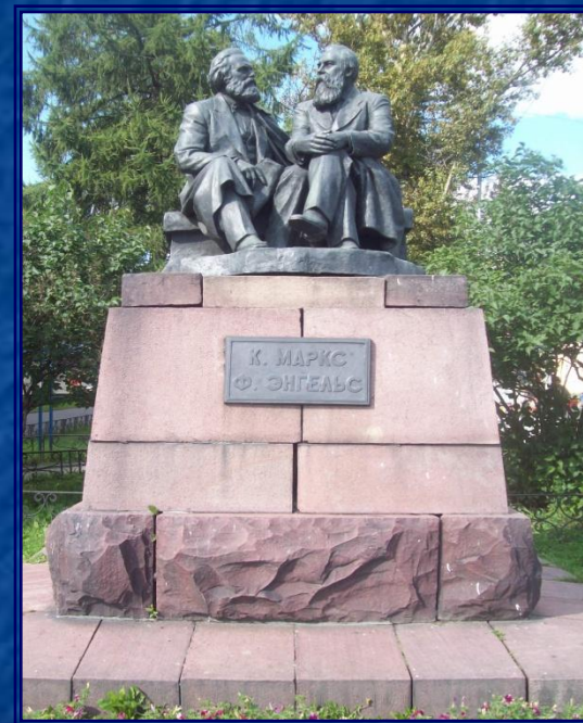
Памятник Карлу Марксу и Фридриху Энгельсу на пр. Карла Маркса г. Петрозаводск

Во время Великой Отечественной войны город оккупировали финляндские войска. Большинство улиц были переименованы. На время оккупации проспект носил имя Главная улица . После освобождения города в 1944 году улице было возвращено старое название – проспект Карла Маркса