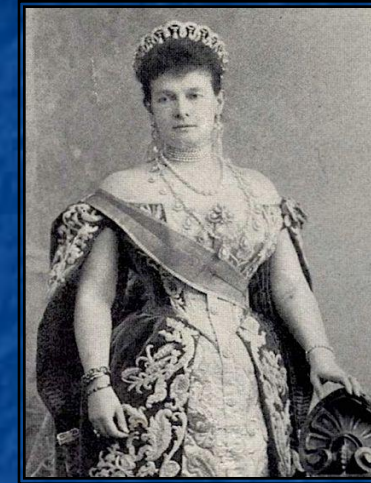
Великая княгиня Мария Павловна