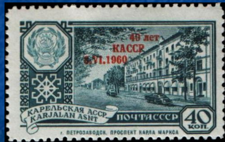
Марка с изображением проспекта Карла Маркса, 1960 года выпуска