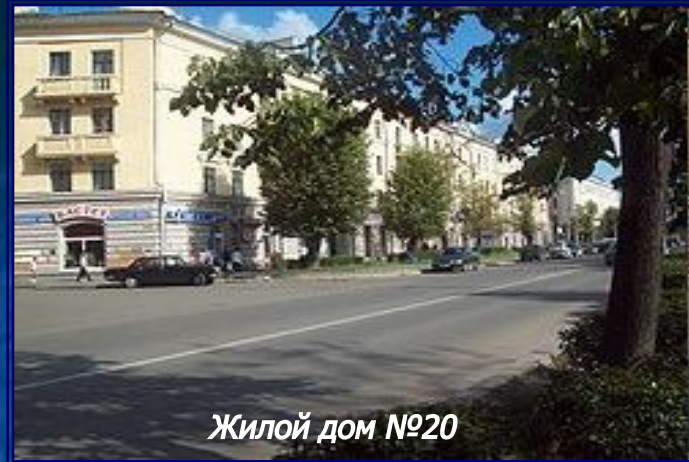
Жилой дом №20