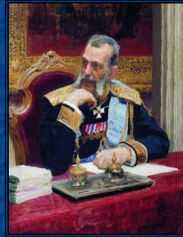
Великий князь Владимир Александрович

В июне 1884 года и в июле 1885 года Петрозаводск посетили великий князь Владимир Александрович и его супруга великая княгиня Мария Павловна.