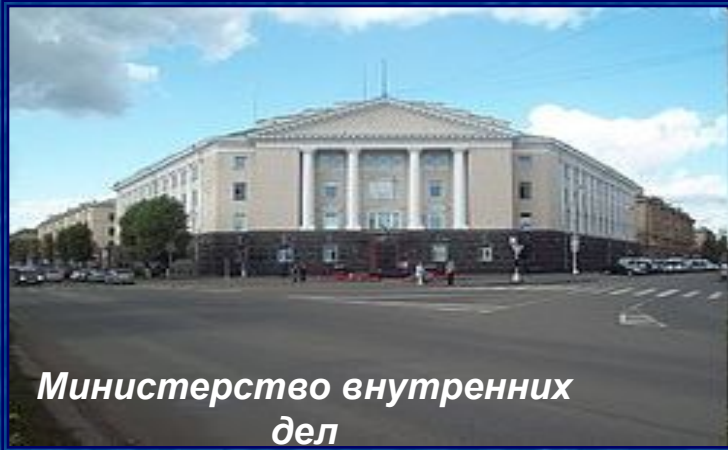
Министерство внутренних дел