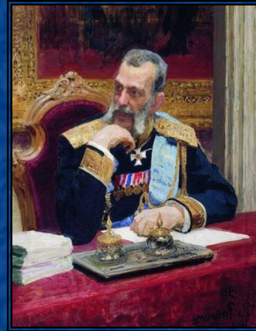
Великий князь Владимир Александрович

В июне 1884 года и в июле 1885 года Петрозаводск посетили великий князь Владимир Александрович и его супруга великая княгиня Мария Павловна.