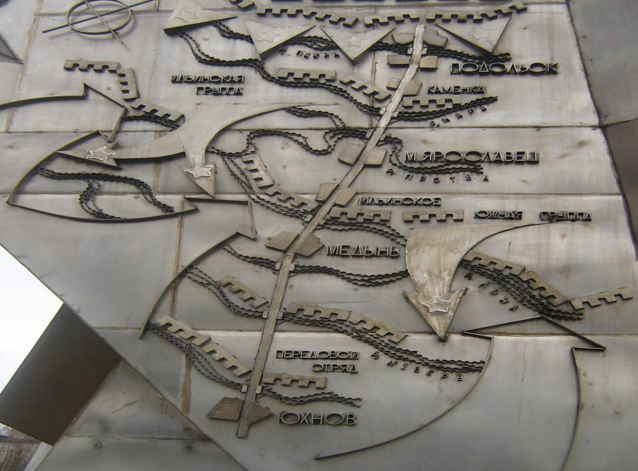
СХЕМА БОЕВЫХ ДЕЙСТВИЙ ПОДОЛЬСКИХ КУРСАНТОВ