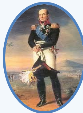
М.Б. Барклай де Толли