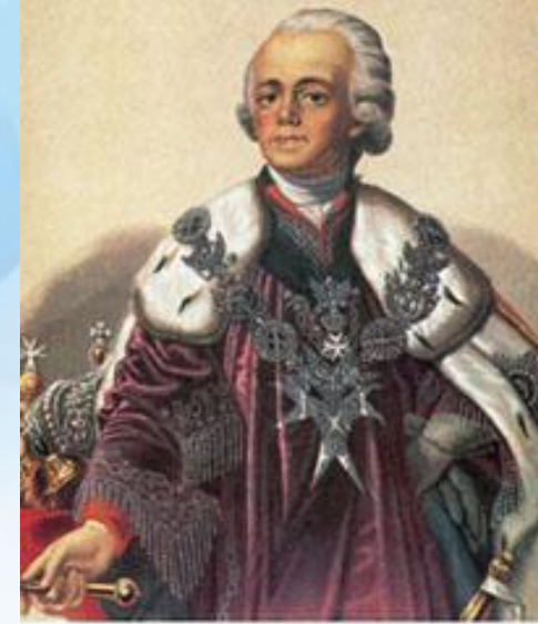
Павел I Петрович (1754-1801)