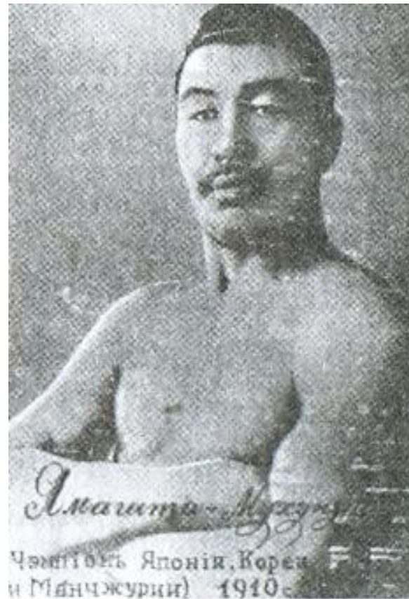
Қажымұқан Мұңайтпасұлы (1886-1948)