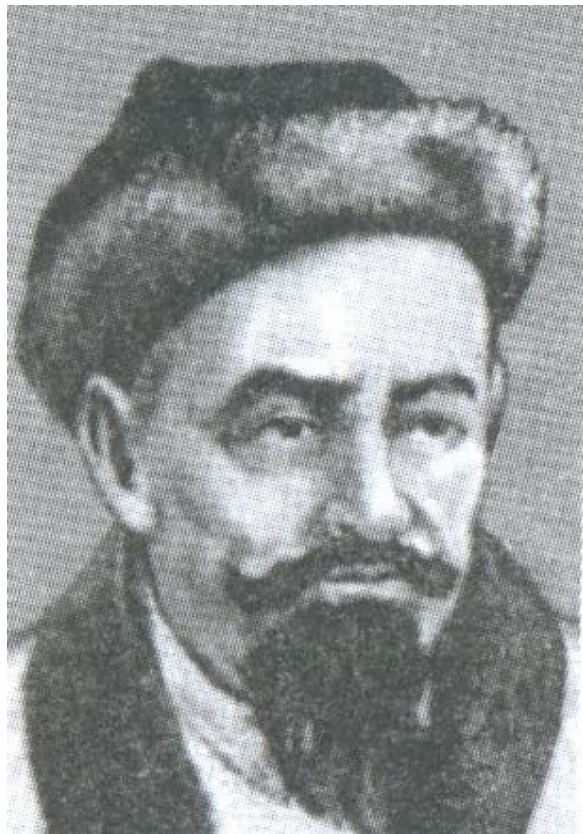
Нұрмағанбет Баймырзаұлы – Балуан Шолақ (1864-1919)