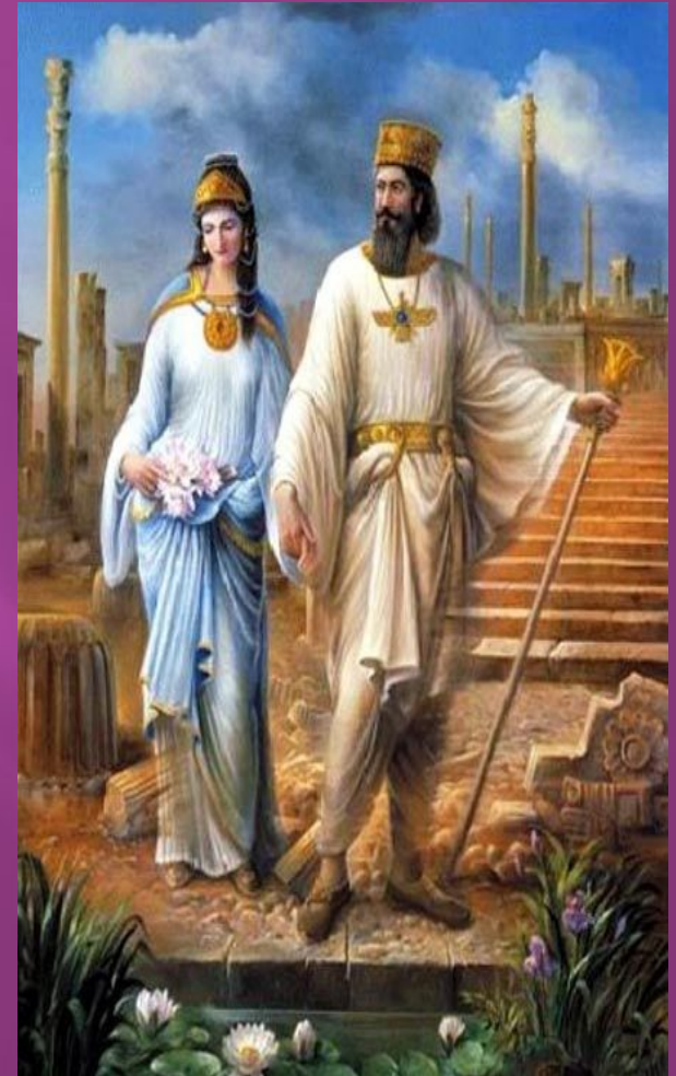
Навуходоносор и его жена Амитис

Несмотря на устоявшуюся связь висячих садов Вавилона с именем ассирийской царицы Семирамиды , жившей около 800 г. до н.э., ученые считают это заблуждением. На самом деле, официальная версия происхождения этого чуда света гласит следующее: