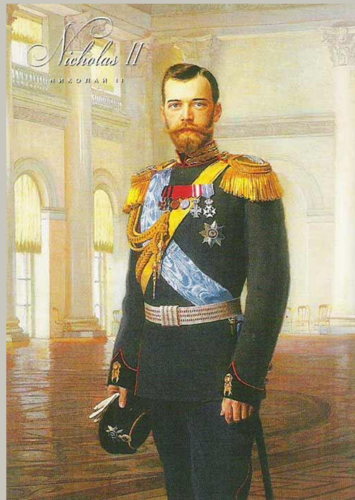
Император Николай II (1894 – 1918 гг)