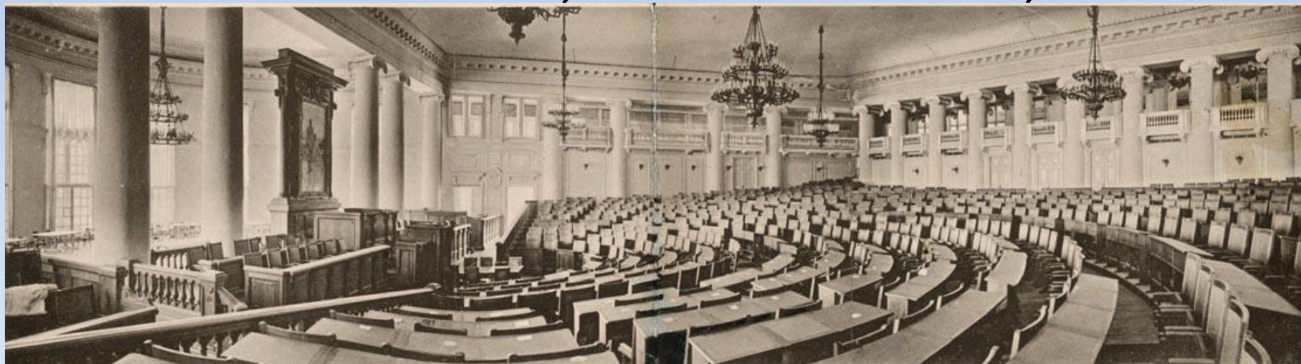
Зал заседаний Государственной думы в Таврическом дворце, Санкт-Петербург

К участию в выборах допускались мужчины, достигшие 25-летнего возраста. Избирательного права не получили: женщины, военнослужащие, студенты, народы, ведущие кочевой образ жизни – "бродячие инородцы",