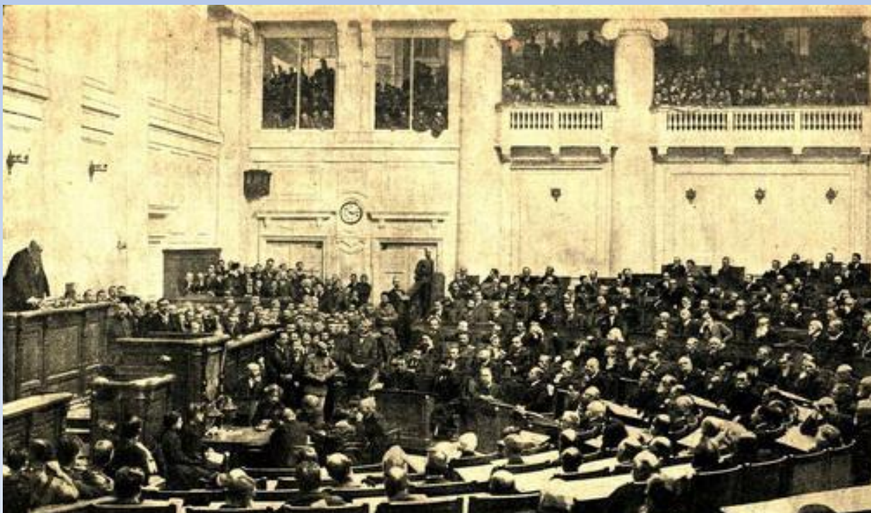
27 апреля 1906 г. Открытие I Думы

15 ноября 1912г – начало работы IV Государственной Думы