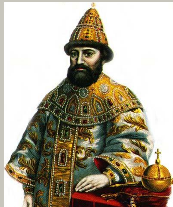
1613 г. Михаил Романов