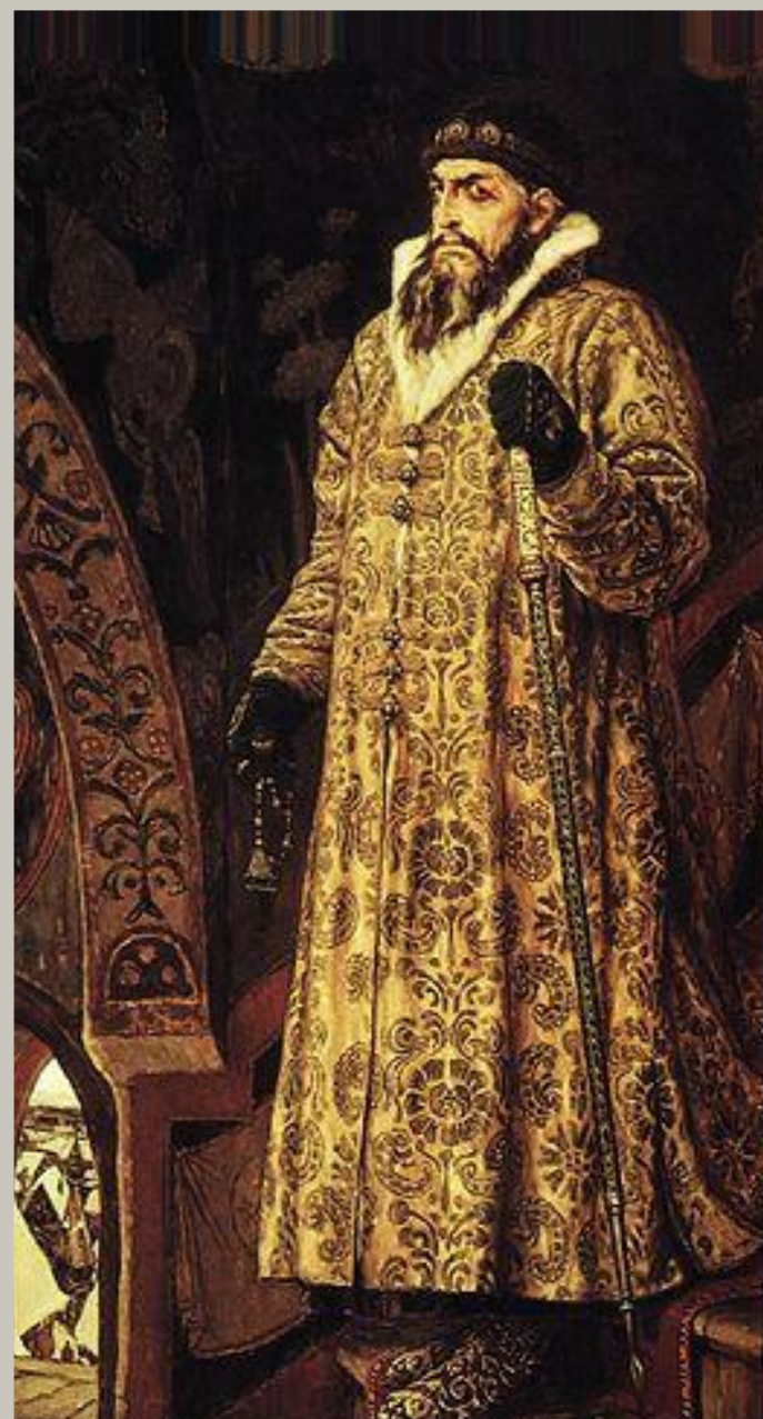
Царь Иван IV Грозный 1533 – 1584гг.

губные и земские избы , которые были выборными органами местного самоуправления связана с указом Ивана IV «Приговор царский о кормлениях и о службах» (1555–1556 гг.), отменившим систему кормлений и повсеместно ввопившим новую систему местного самоуправления.