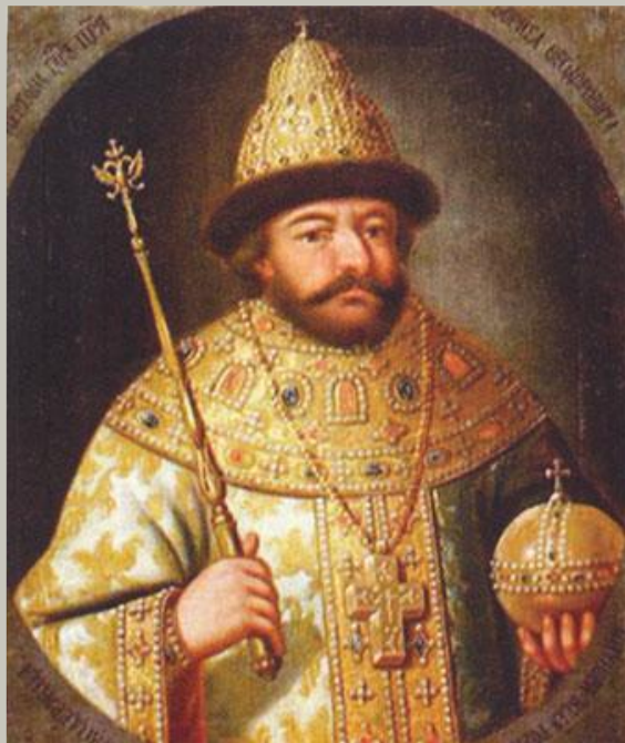
1598 г. Борис Годунов