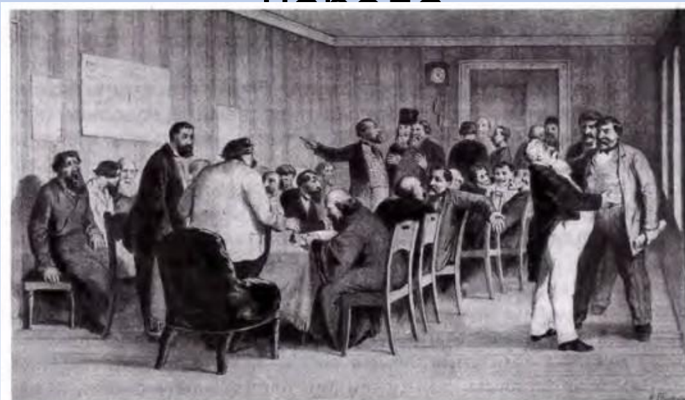
Заседание земства. С картины художника К. Трутовского

способствовали укреплению избирательных традиций, заметному повышению уровня правового сознания