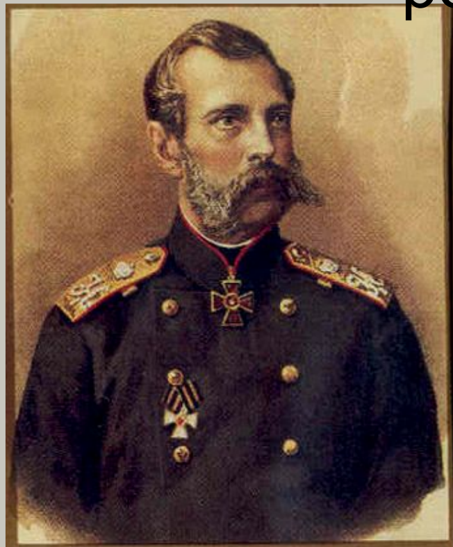
Император Александр II (1855 – 1881гг)

способствовали укреплению избирательных традиций, заметному повышению уровня правового сознания