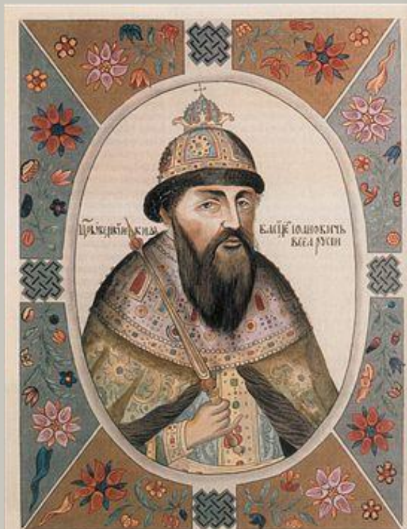
1606 г. Василий Шуйский