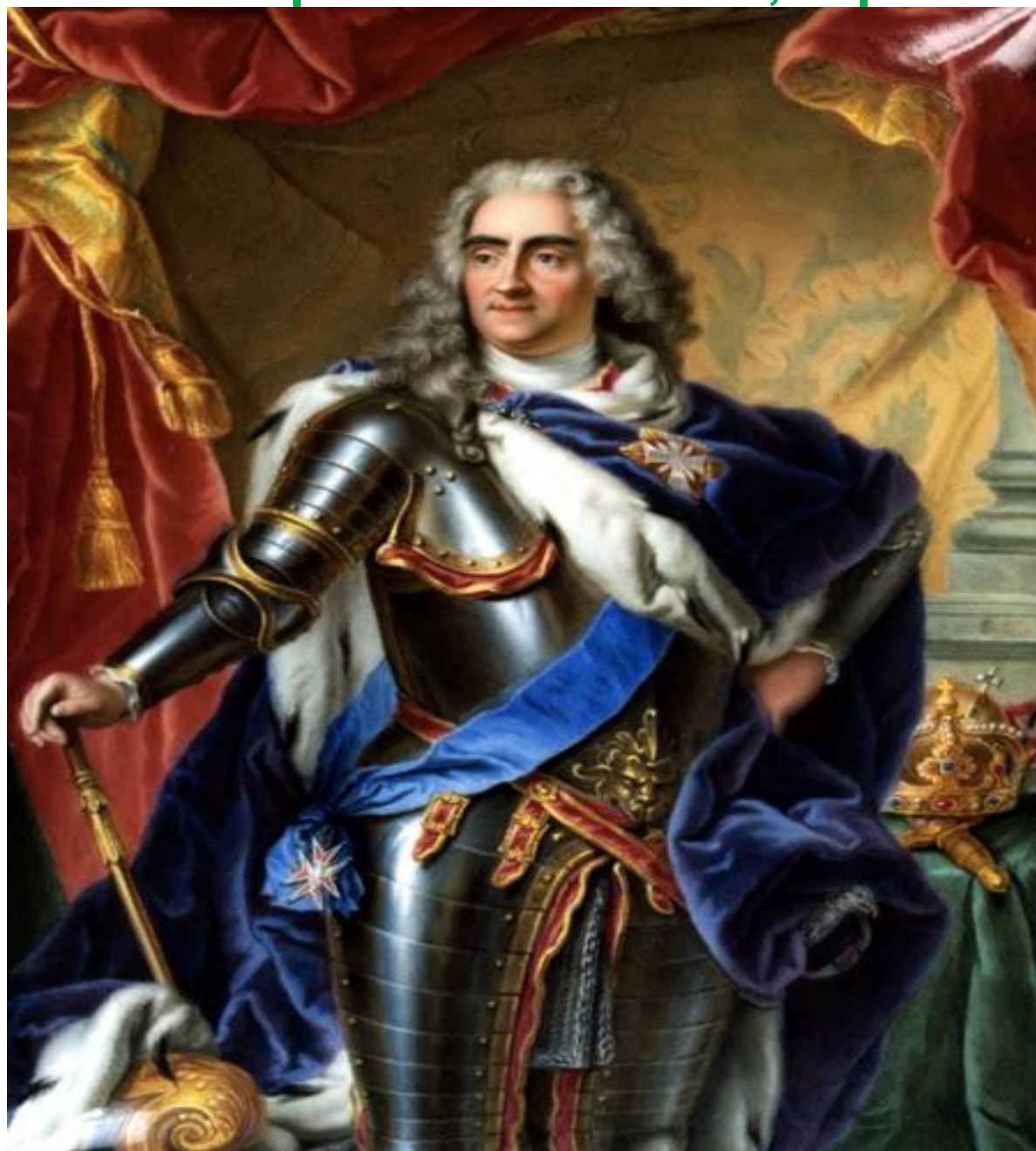
Август II (1694-1734гг) Курфюрст Саксонии.