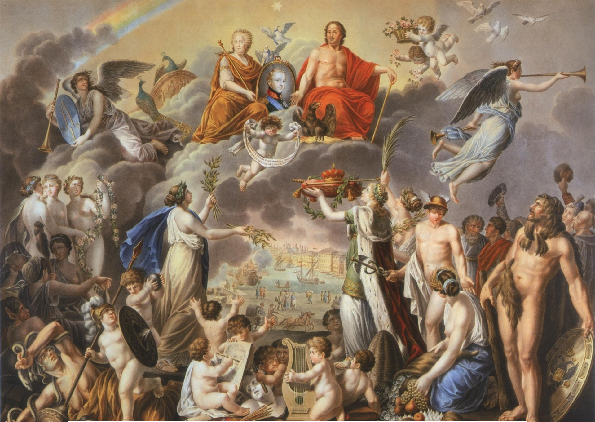
Апофеоз Александра I - аллегория на восшествие его на престол