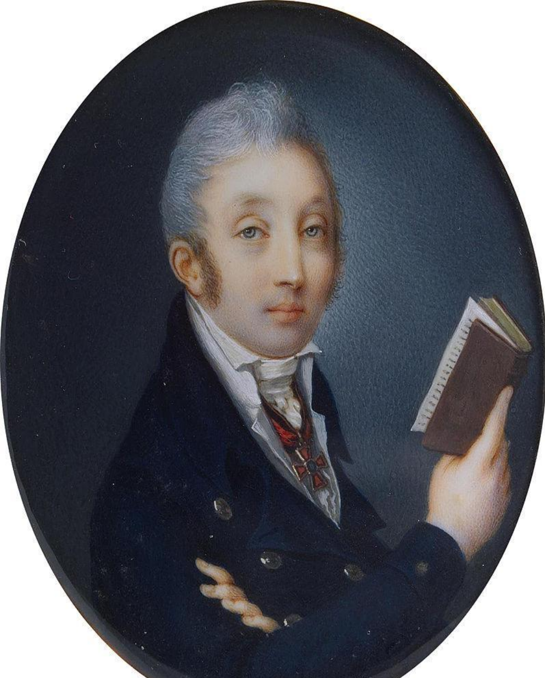
Михаил Сперанский в 1806 году