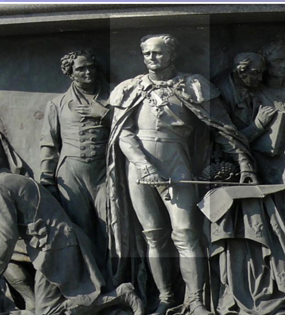
Александр I на памятнике «1000-летие России» в Великом Новгороде

Были произведены преобразования в административной системе Империи: в 1802 г. учреждены министерства и Государственный Совет, отменена Тайная Экспедиция. Была создана система средних и низших учебных заведений, учреждены Харьковский, Казанский и Санкт-Петербургский университеты.