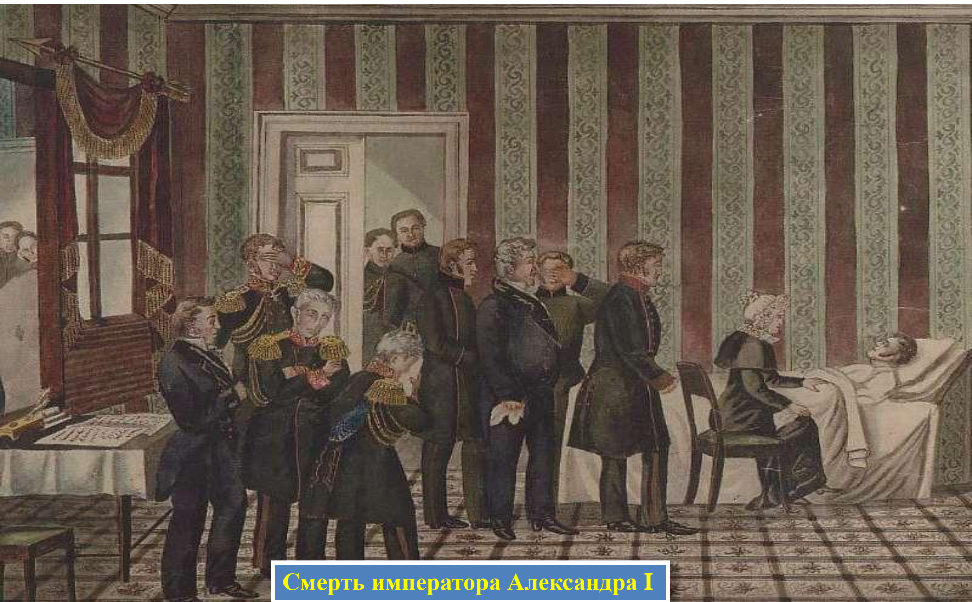
Смерть императора Александра I

Смерть Александра I произошла от брюшного тифа 1 декабря 1825 года в Таганроге. За годы своего правления Александр I многое сделал для страны: Россия одержала победу над французской армией, была проделана огромная работа по отмене крепостного права, а также проведена реформа высших органов власти.