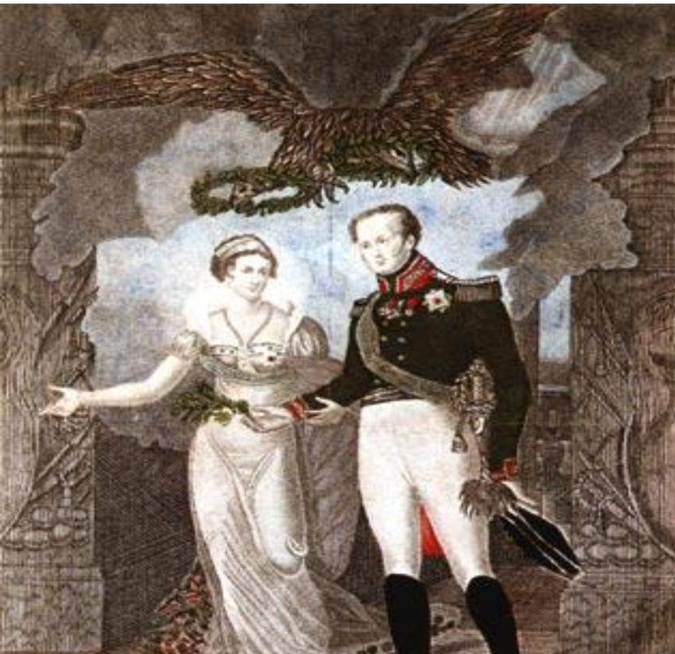
Император Александр восстанавливает мир в Европе

Особенностью внутренней политики Александра I был ввод полицейского режима, создание военных поселений, которые позже стали называться «аракчеевщиной». Такие меры вызывали недовольство широких масс населения. В 1817 г. было создано « Министерство духовных дел и народного просвещения » возглавляемое А.Н. Голицыным . В 1822 г. император Александр I запретил в России тайные общества, включая масонство .