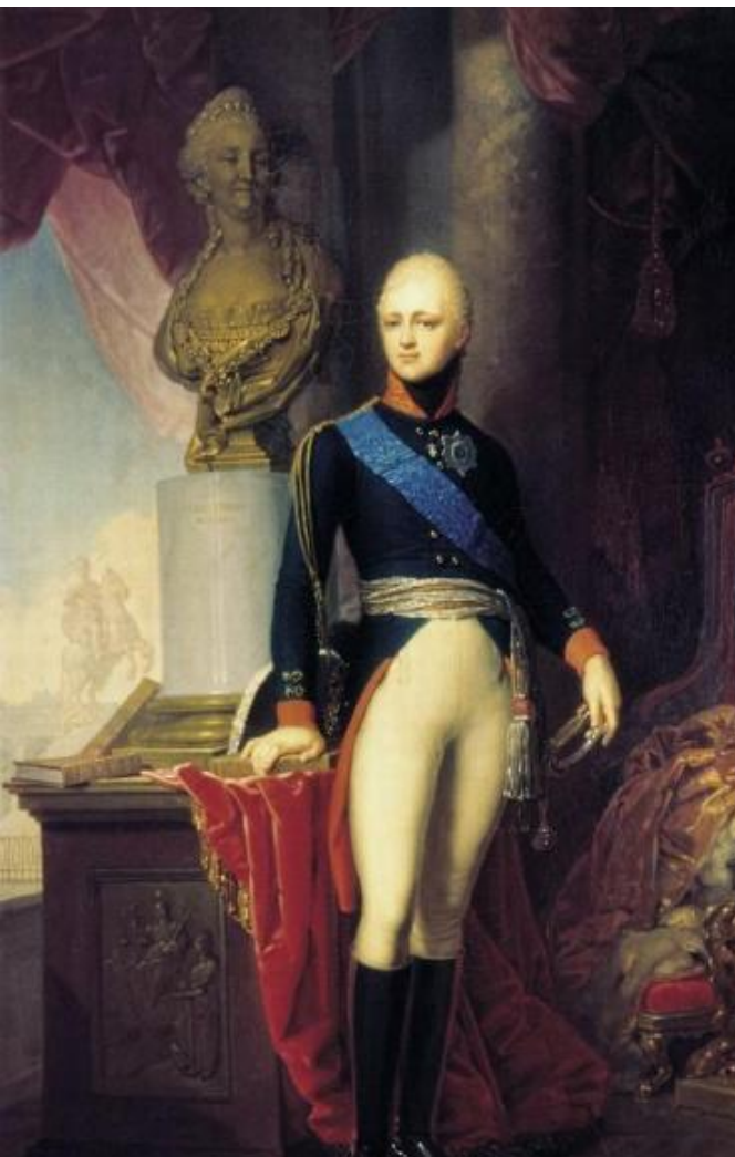
Император Александр I

В официальной дореволюционной историографии именовался Благословенный .