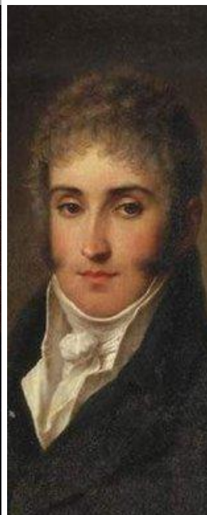
Князь Чарторый- ский