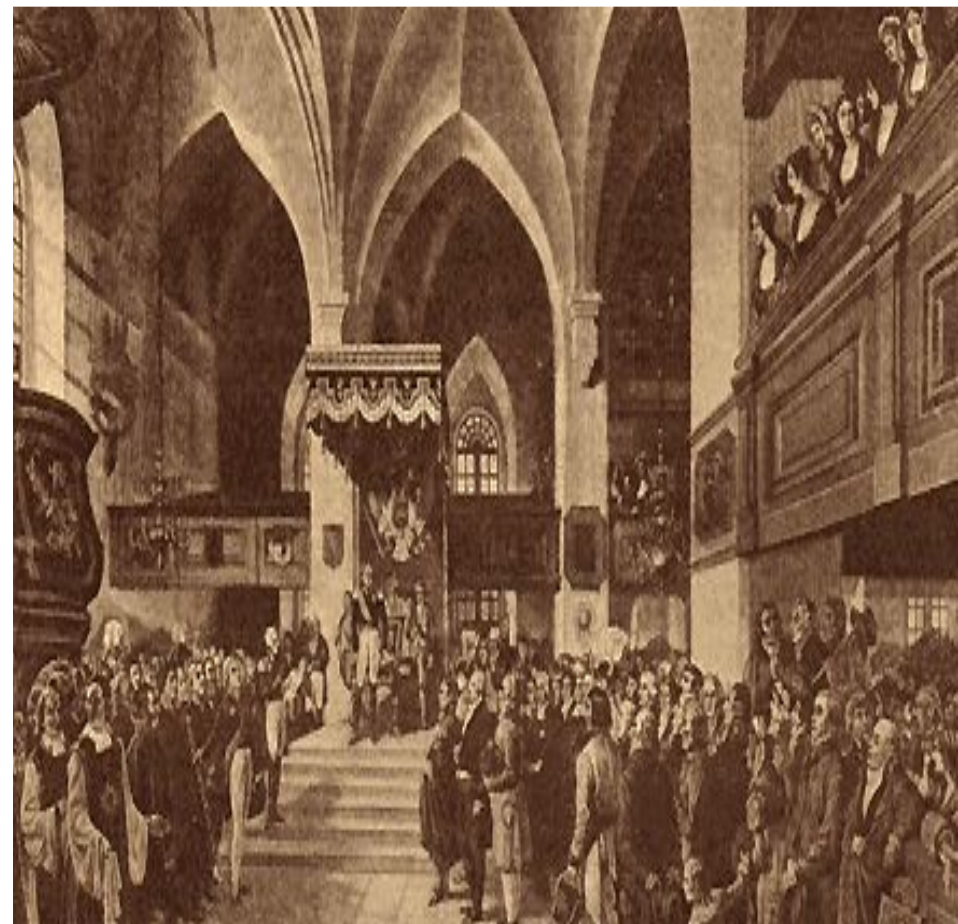
Александр I открывает заседания Финского Сейма