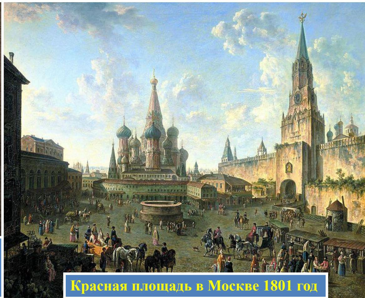
Красная площадь в Москве 1801 год