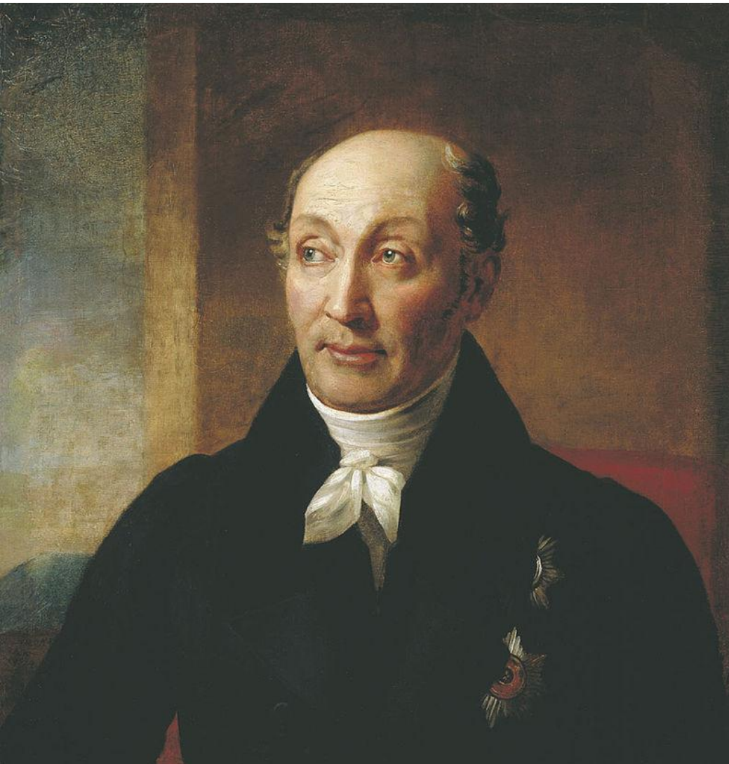
Михаил Михайлович Сперанский

Главным исполнителем этих преобразований был видный масон статс-секретарь М. М. Сперанский . Наряду с положительным эффектом некоторых из этих мер либеральный курс привел к распространению вольнодумства, безверия, появились тайные революционные общества.