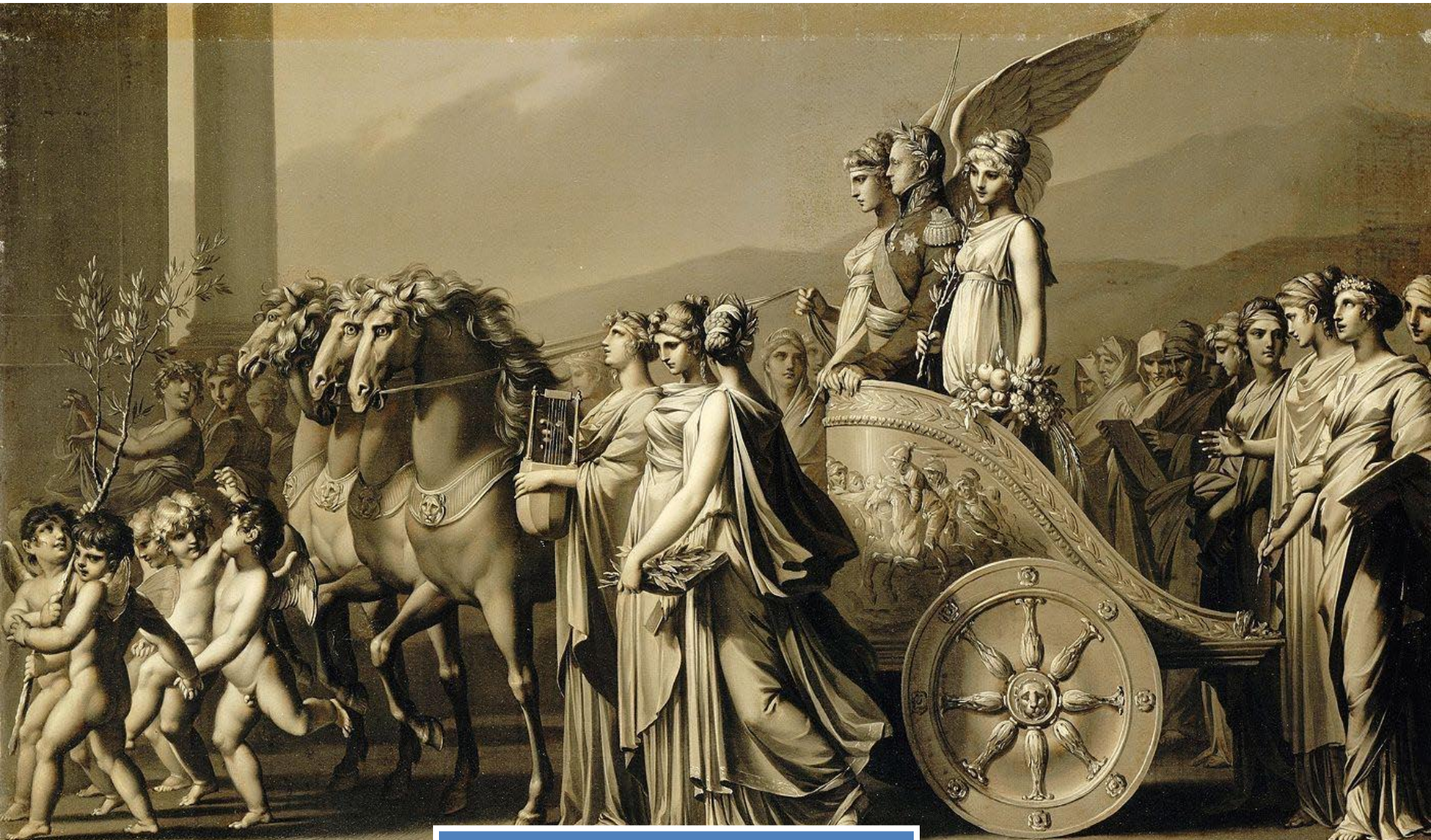
Триумф царя Александра I

Александр восстановил выборы предводителей дворянства, отмененные Павлом , освободил священников от телесных наказаний, отменил ограничения в гражданской одежде и косы у солдат, был вновь разрешен ввоз иностранных книг и деятельность частных типографий.