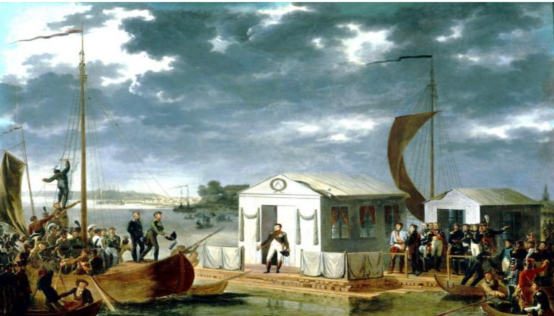
Встреча Александра I и Наполеона на Немане в Тильзите 7 июля 1807 года

Во внешней политике император Александр I участвовал в двух коалициях против наполеоновской Франции (с Пруссией в 1804-1805 гг. и с Австрией в 1806-1807 гг.). Потерпев поражение под Аустерлицем в 1805 г. и под Фридландом в 1807 г., Россия заключила Тильзитский мир (1807) и союз с Наполеоном .