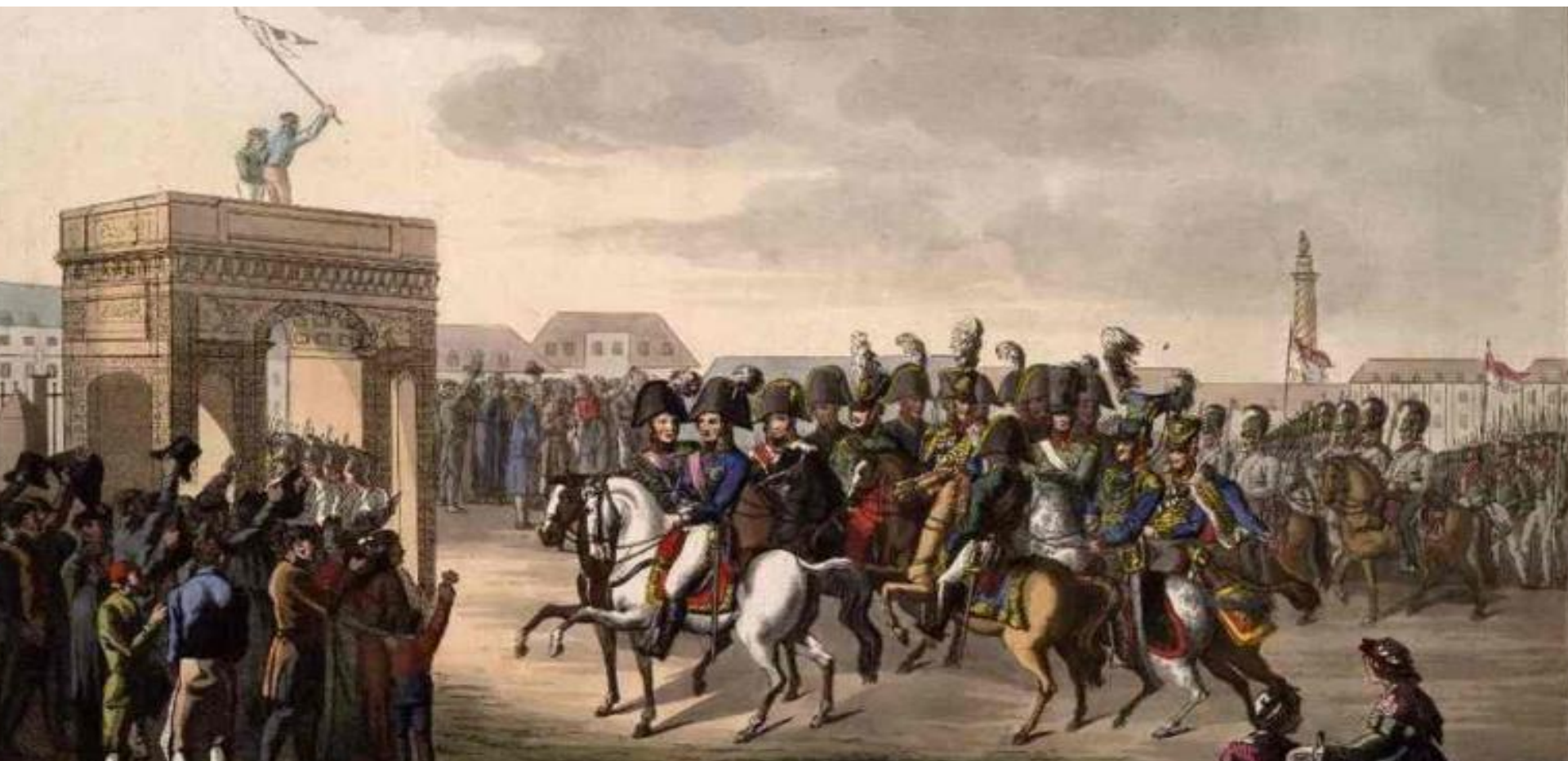
Торжественный въезд императора Александра I и прусского короля Фридриха Вильгельма III в Париж.

Государь вел также успешные войны с Турцией (1806-12) и Швецией (1808-09). Война со Швецией закончилась Фридрихсгамским миром, по которому Россия присоединила территорию Финляндии до р. Торнео и Аландские острова на правах Великого княжества . При Александре I к России были присоединены территории Восточной Грузии (1801), Бессарабии (1812), Азербайджана (1813), бывшего герцогства Варшавского (1815).