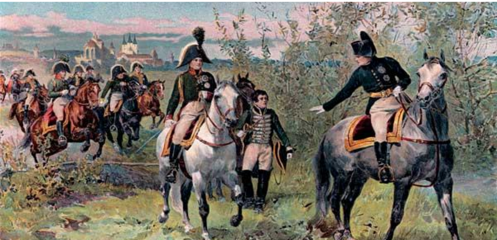
Наполеон и Александр I на конной прогулке в окрестностях Эрфурта

Перелом в политике Императора Александра I произошел в 1812 г. под воздействием Отечественной войны 1812 года. Государь отправил в отставку, а затем и в ссылку Сперанского , стал опираться на лидеров «русской партии» архимандрита Фотия (Спасского) , графа А.А.Аракчеева , адмирала А.С.Шипкова . Была свернута политика церковного экуменизма, закрыты Библейские общества , отправлен в отставку главный идеолог церковно-либерального курса князь Голицын , наконец, в 1822 г. были запрещены масонские общества .