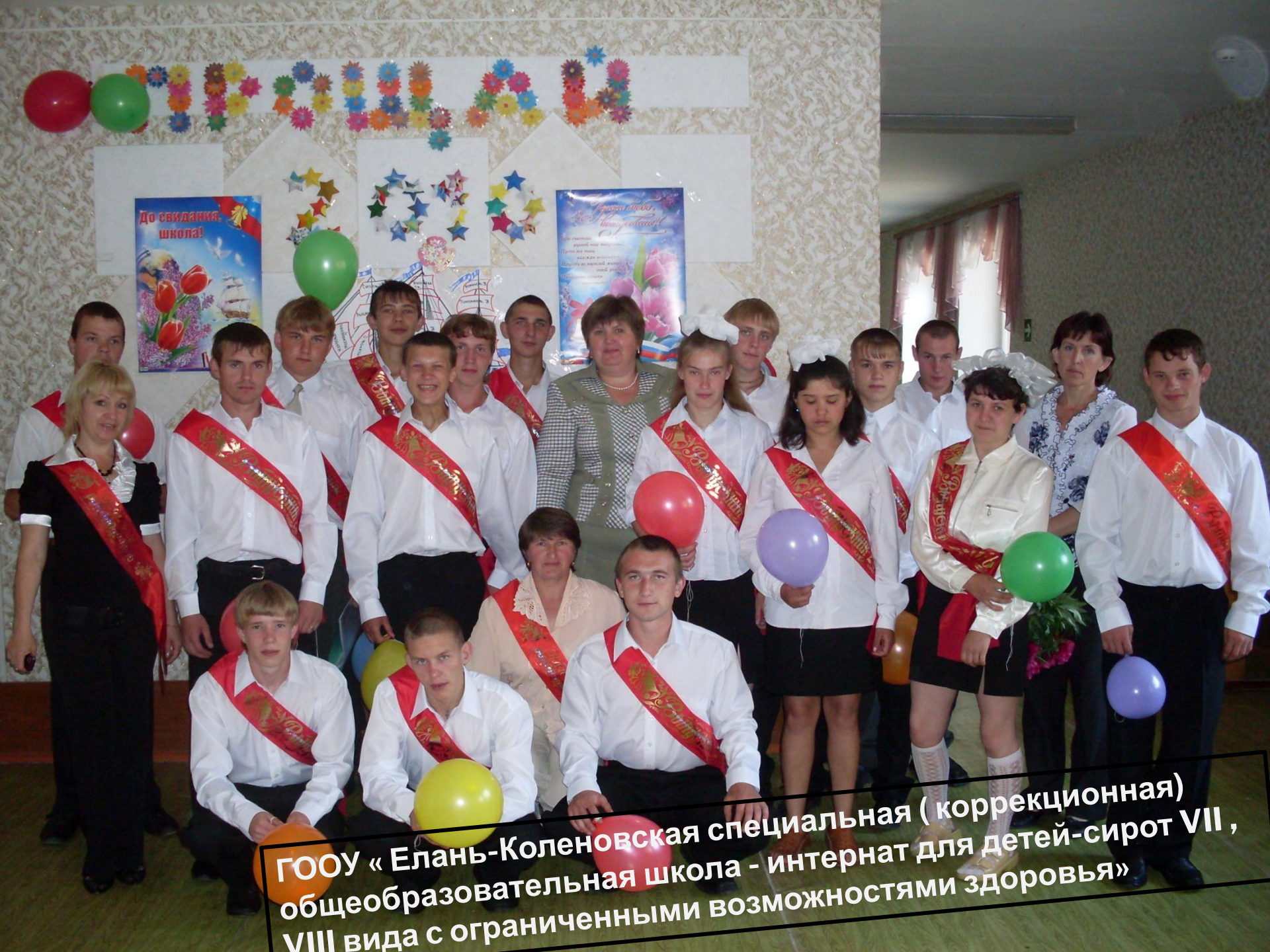
ГООУ «Елань-Коленовская специальная (коррекционная) общеобразовательная школа - интернат для детей-сирот VII, VIII вида с ограниченными возможностями здоровья»