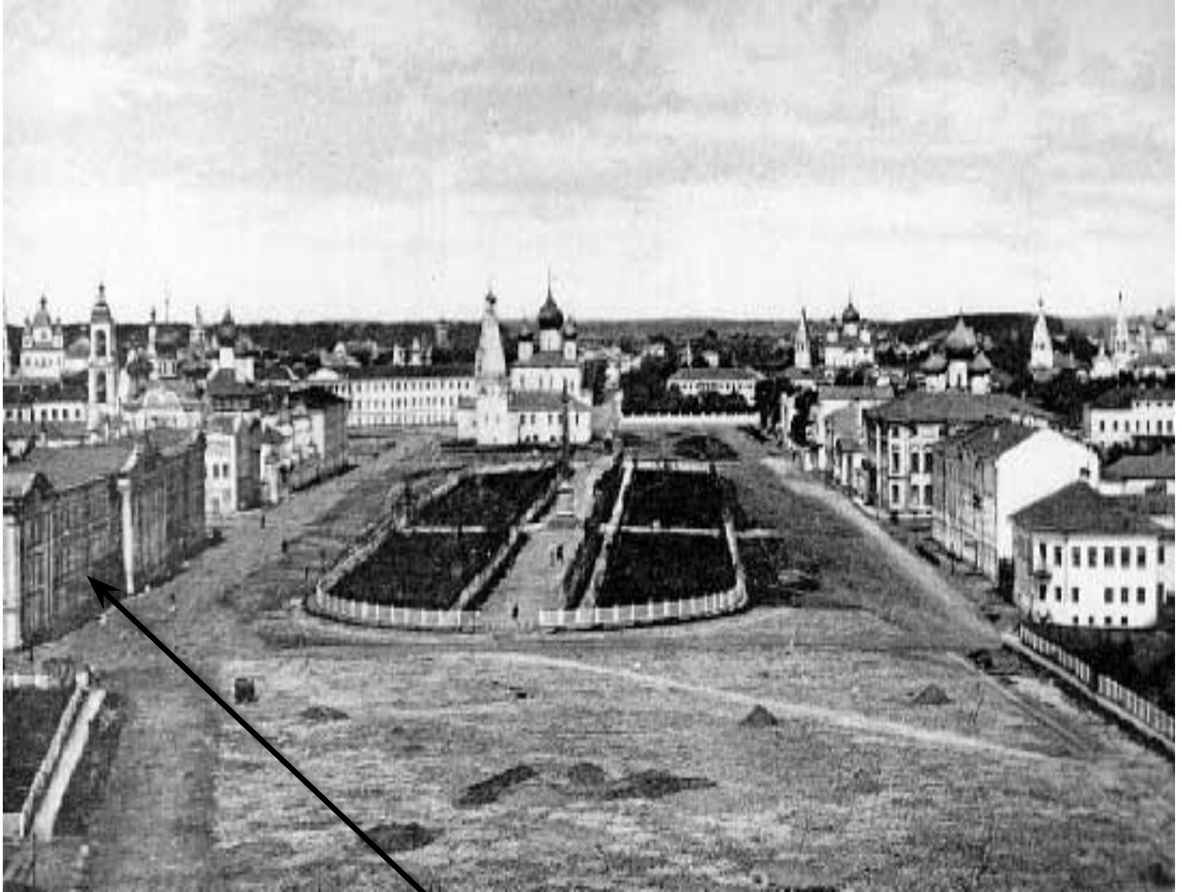
Городская Дума и Управа