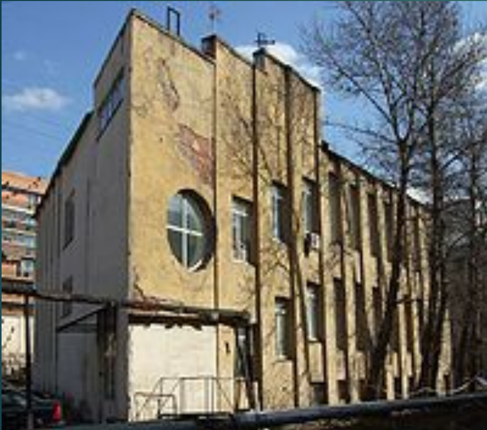
Здание конторы Ново-Сухаревского рынка