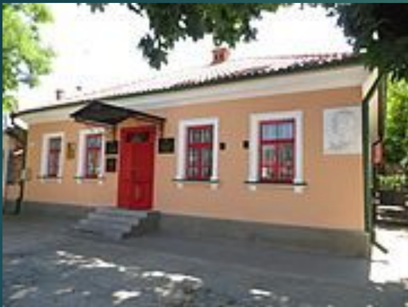
Дом-музей Щусева в Кишинёве