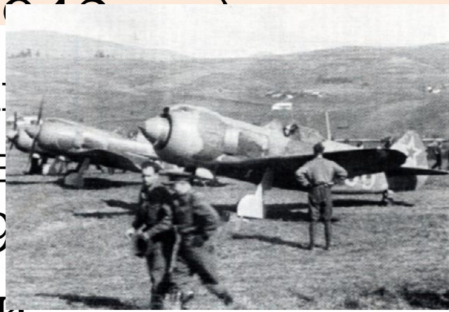
Советские истребители на 3-м полевом аэродроме во время воздушных сражений на Кубани 1 января – 9 упательными

Битва за Кавказ началась 25 июля 1942 г. и продолжалась до 9 октября 1943 г. Она стала одним из крупнейших событий Великой Отечественной войны. Военные историки выделяют в ней два периода: первый (25 июля – 31 декабря 1942 г.) характеризовался оборонительными действиями советских войск, а второй (с 9 октября 1942 г.) – наступательными операциями.