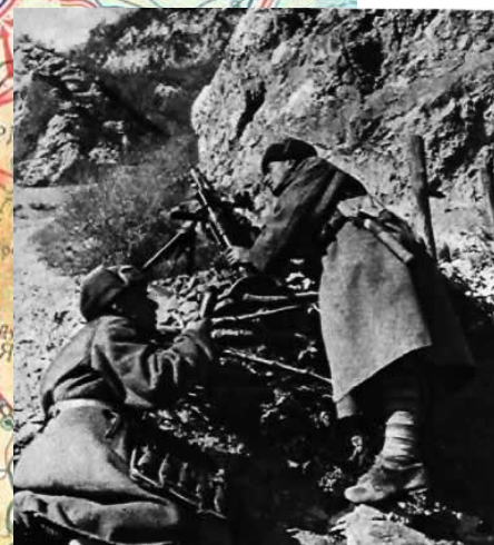
394-й стрелковая дивизия