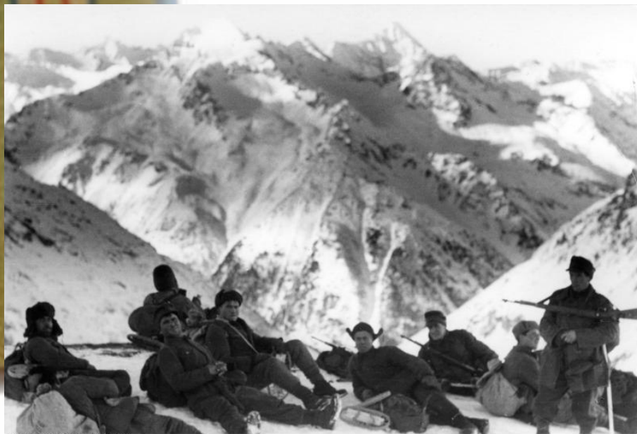
Немецкие солдаты на привале в горах Северного Кавказа 22 декабря 1942 года

Офицеры и генералы воинских частей противника были снабжены специальным «Справочником – путеводителем по Кавказу», изданным в Лейпциге.