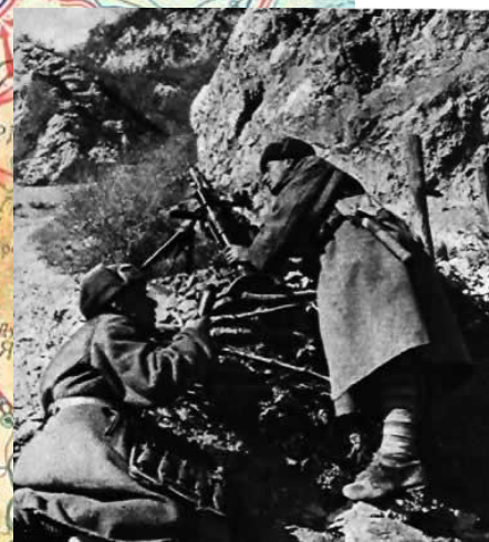
394-й стрелковая дивизия