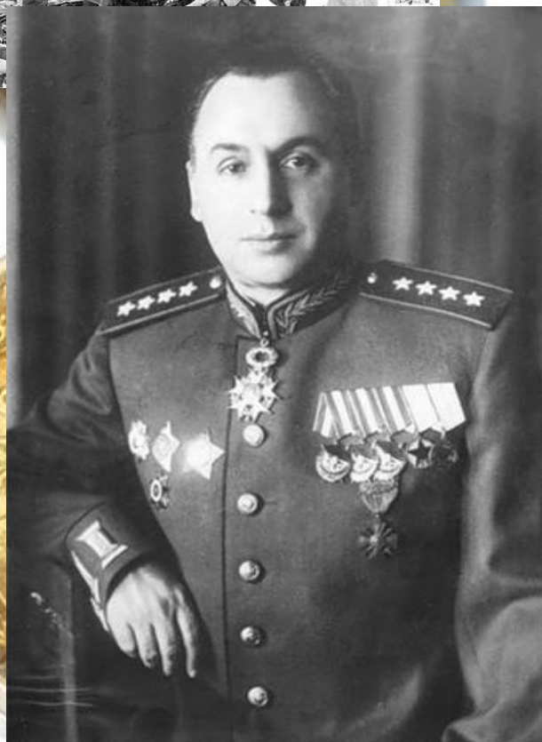
генерал А.И. Антонов

Растерявшийся маршал (Будённый С.М.) практически потерял управление войсками. Только хладнокровие и находчивость начштаба фронта генерала А.И. Антонова спасали положение. Под натиском превосходящих сил противника войска 12-й армии отходили в сторону Армавира, а