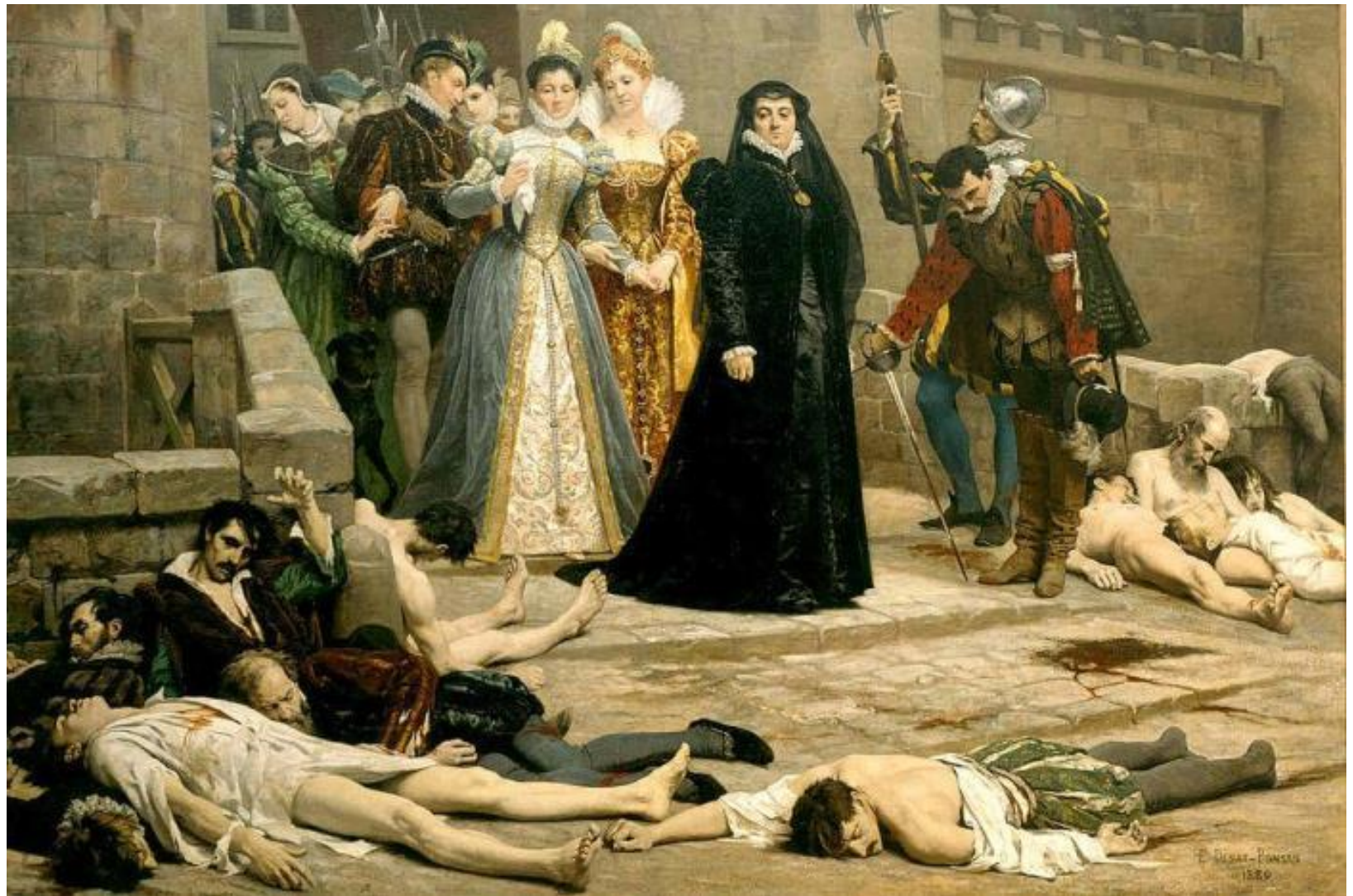
Эдуард Деба-Понсан. Утро около ворот Лувра, 1880. Фрагмент