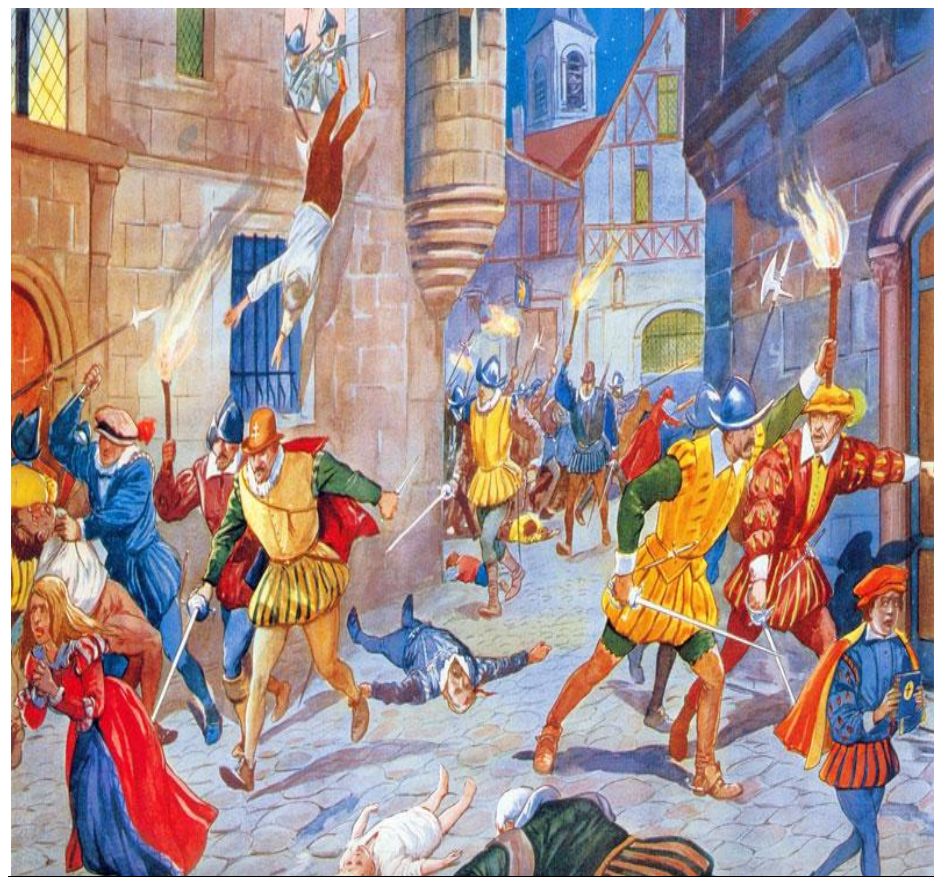
Резня во имя веры .

В этой борьбе гугеноты получали помощь от Англии и протестантских князей Германии, а католики — от Испании.