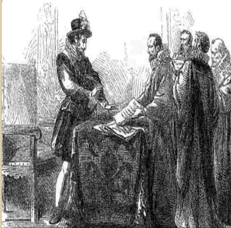
Подписание Нантского эдикта

13 апреля 1598 Генрих IV издал Нантский эдикт, который подвел итог религиозным войнам. «... Мы позволили и позволяем исповедующим ... реформированную религию жить и обитать во всех городах и местах нашего королевства... без преследований, притеснений и принуждений». Из Нантского эдикта