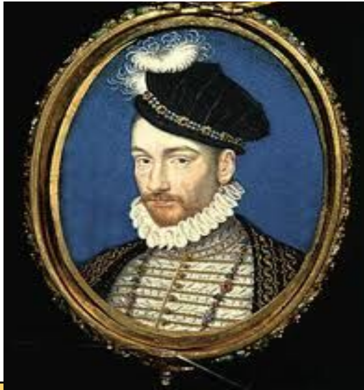
Король Франции Карл IX

С 1560 по 1574 г. во Франции правил король из династии Валуа. Он не был сильным правителем. Фактически вся власть принадлежала его матери Екатерине Медичи.