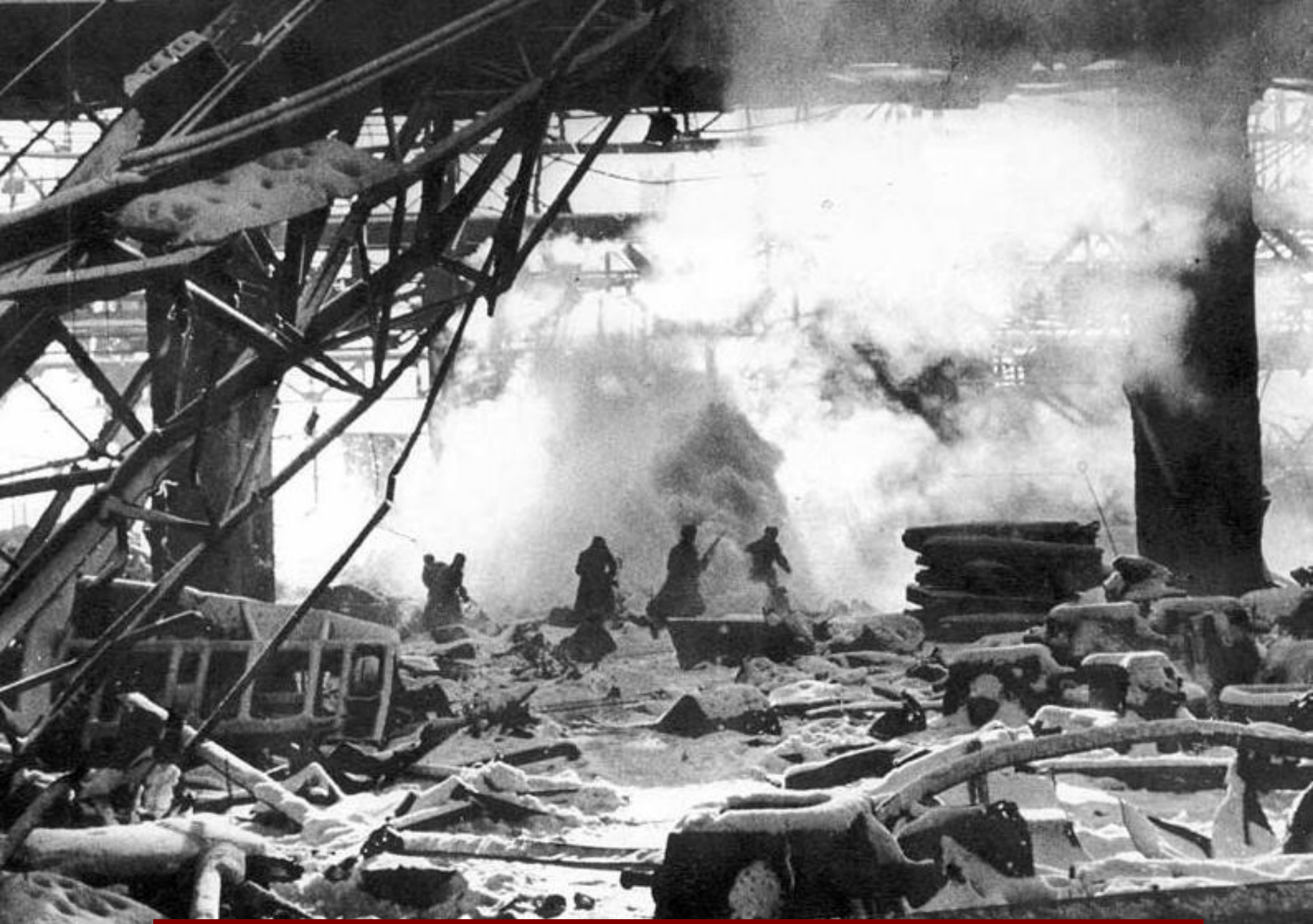
Разрушения на заводе Сельмаш в г. Ростове-на-Дону