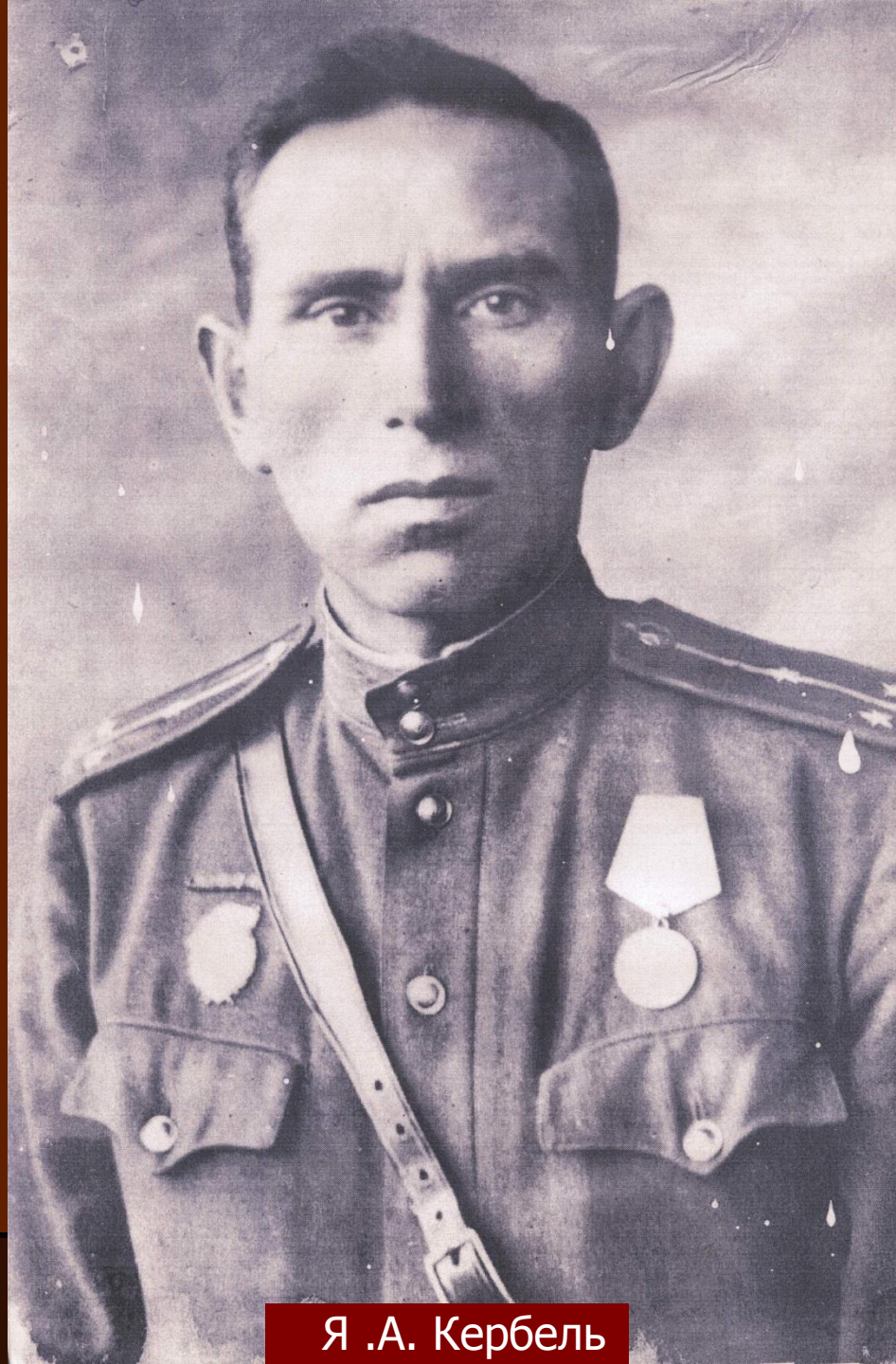
Я .А. Кербель