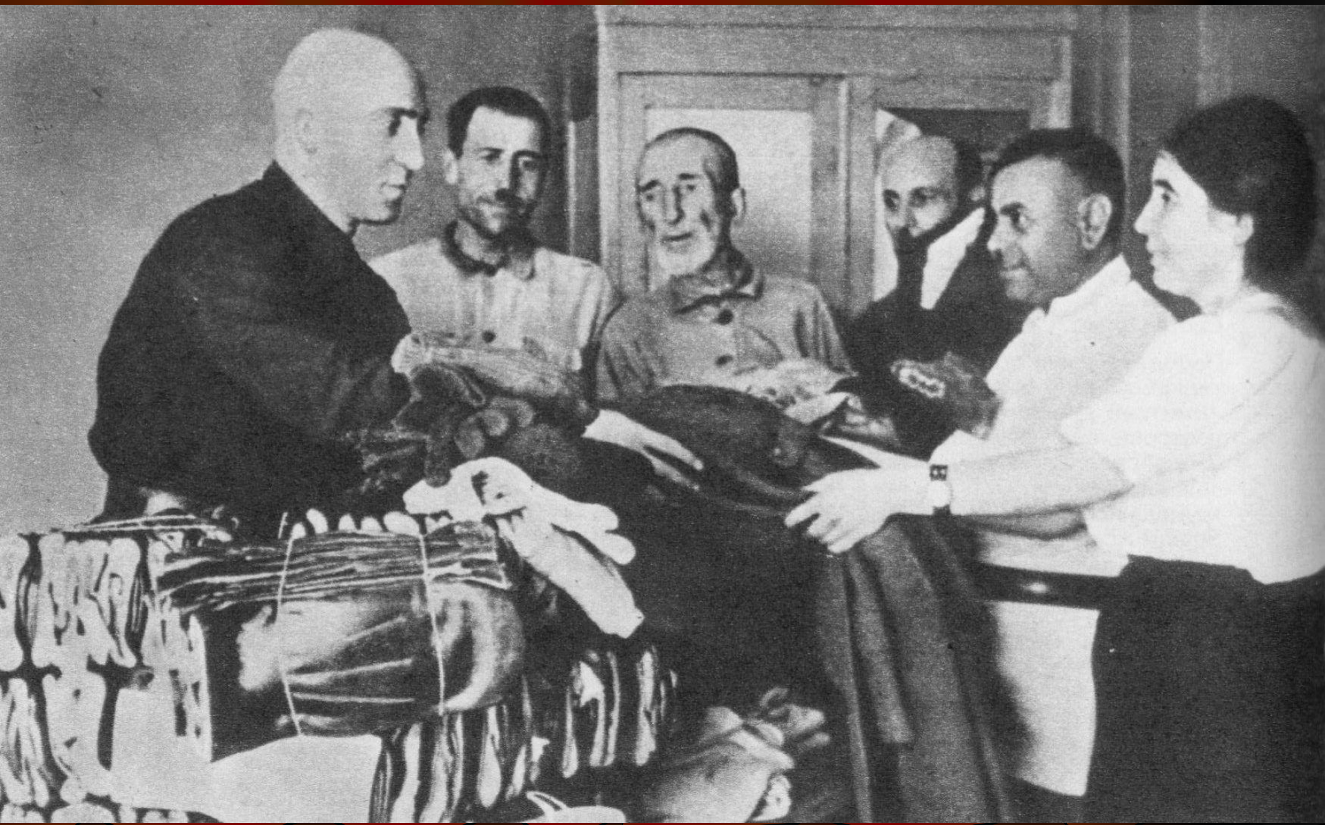
Сбор вещей для фронта