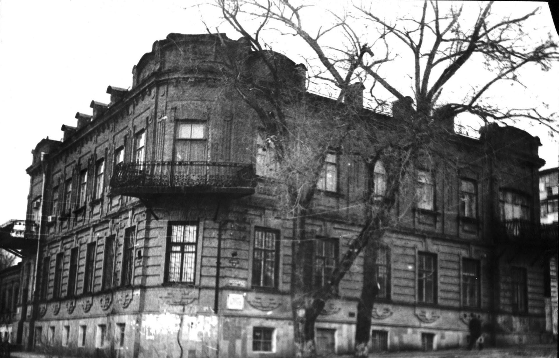
Здание на котором 13 февраля 1943 года вывесили красный флаг. Бывшее здание школы № 17.