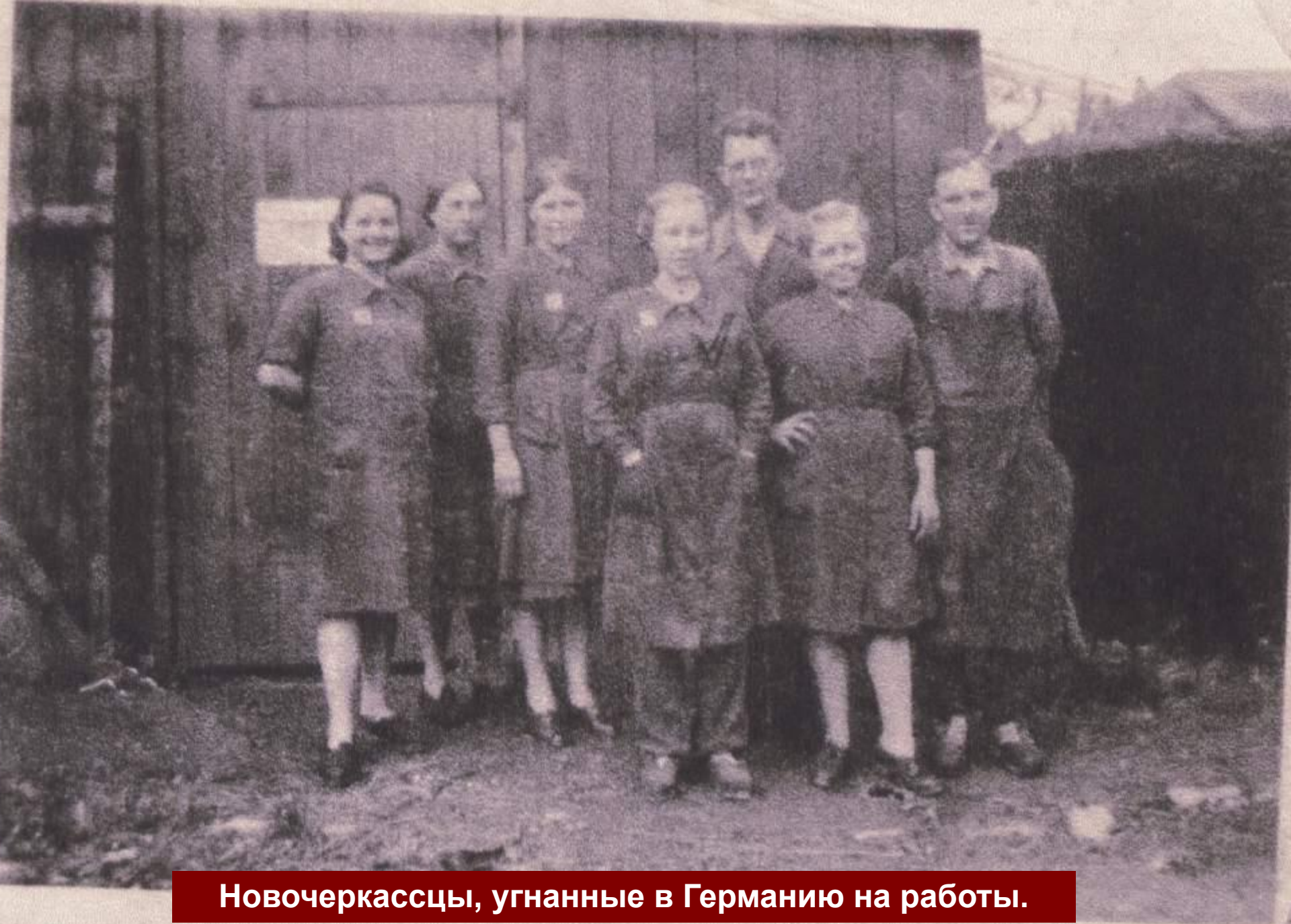
Новочеркасцы, угнанные в Германию на работы.