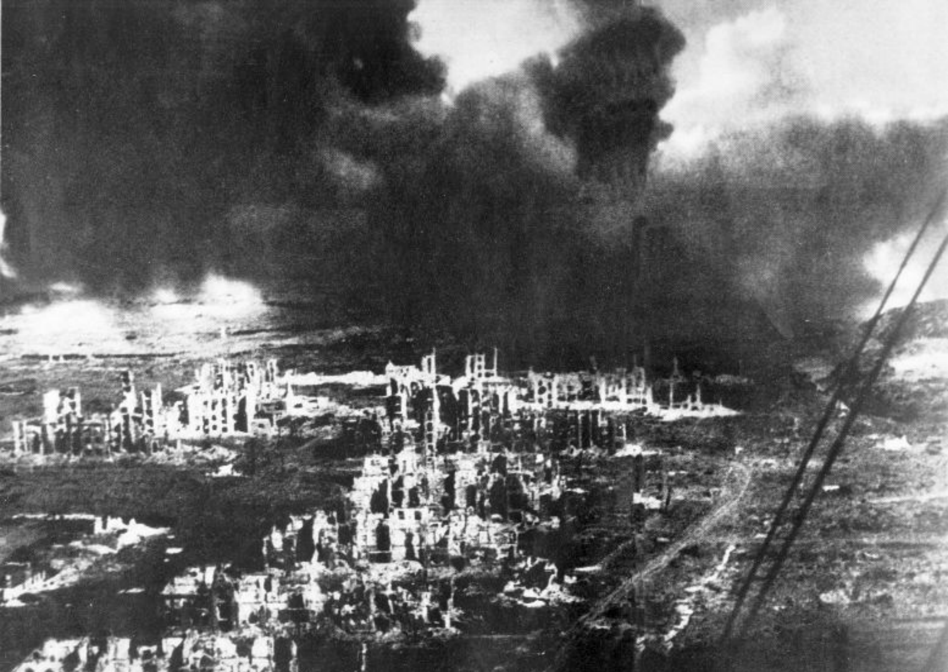
Вид разрушенного Сталинграда