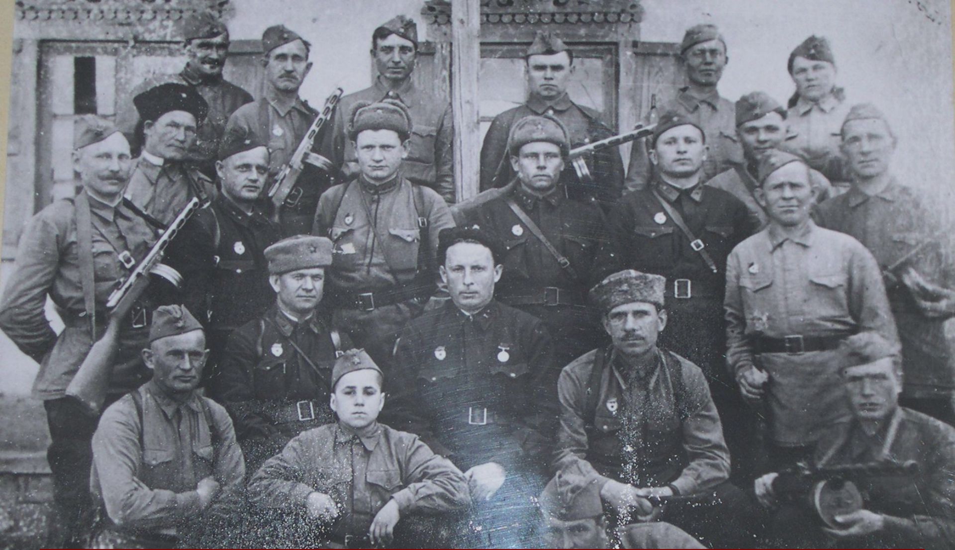
Народное ополчение, сформированное в Новочеркаске. 11 Гвардейская Кавалерийская Дивизия.