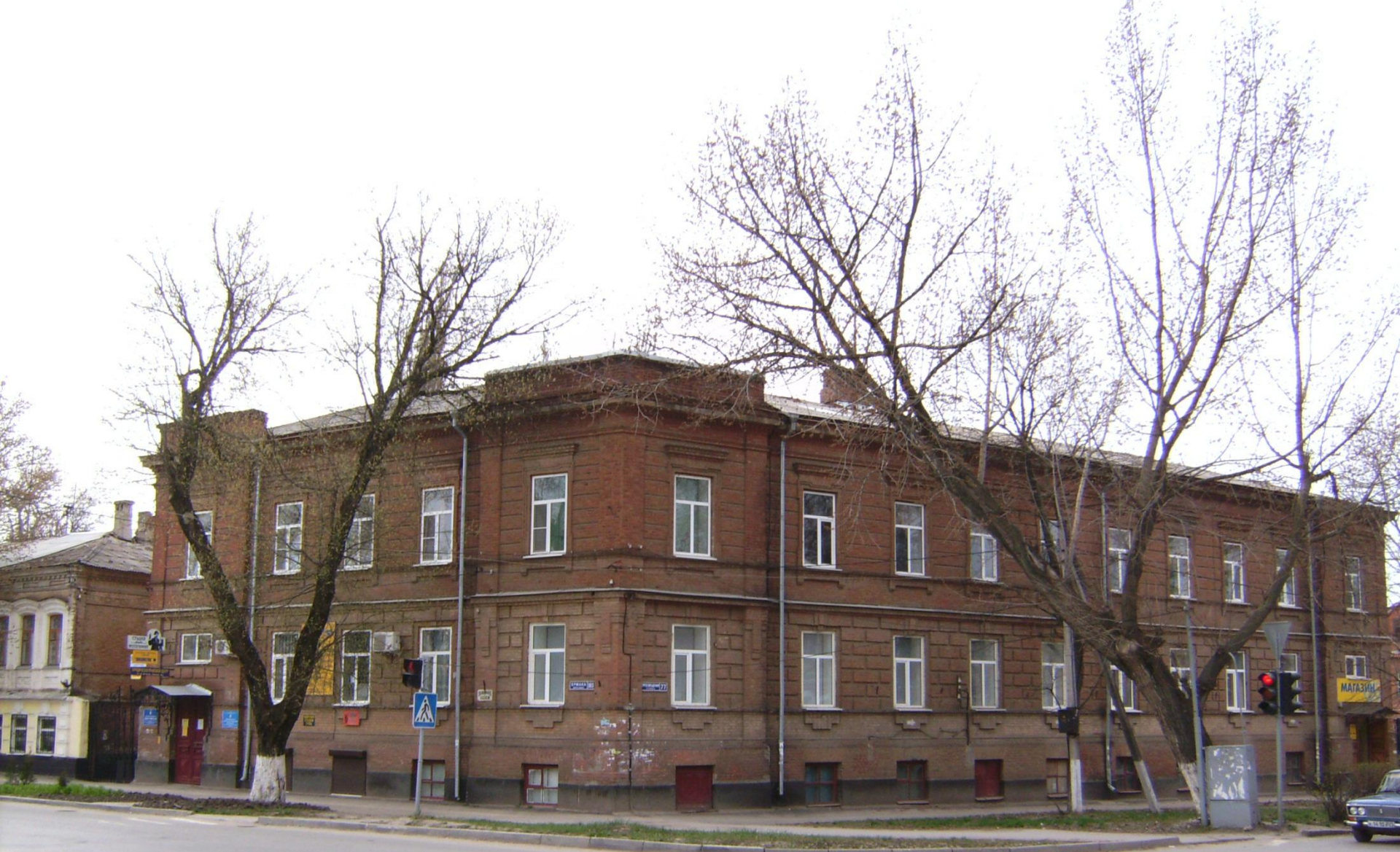
Немецкая биржа труда. На пересечении проспекта Ермака и улицы Просвещения.