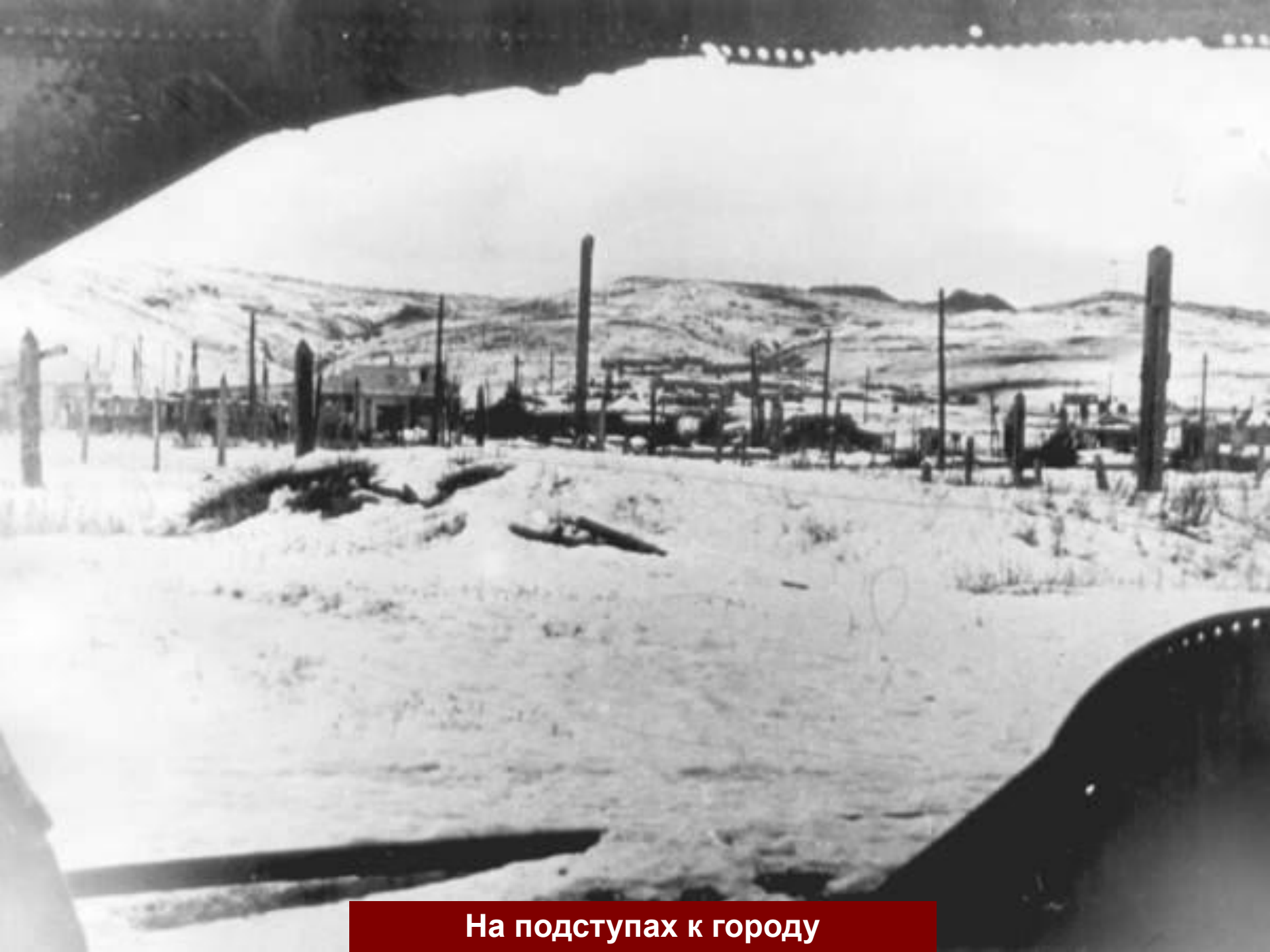
На подступах к городу