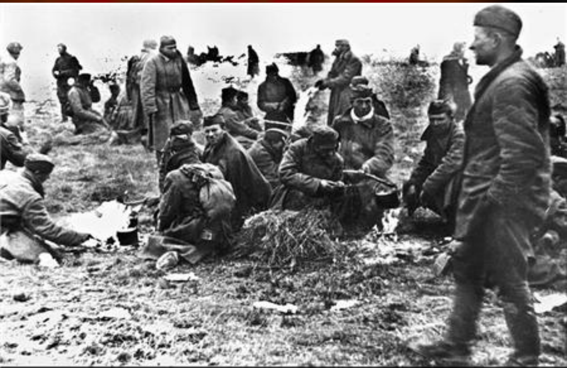
Затишье перед боем.