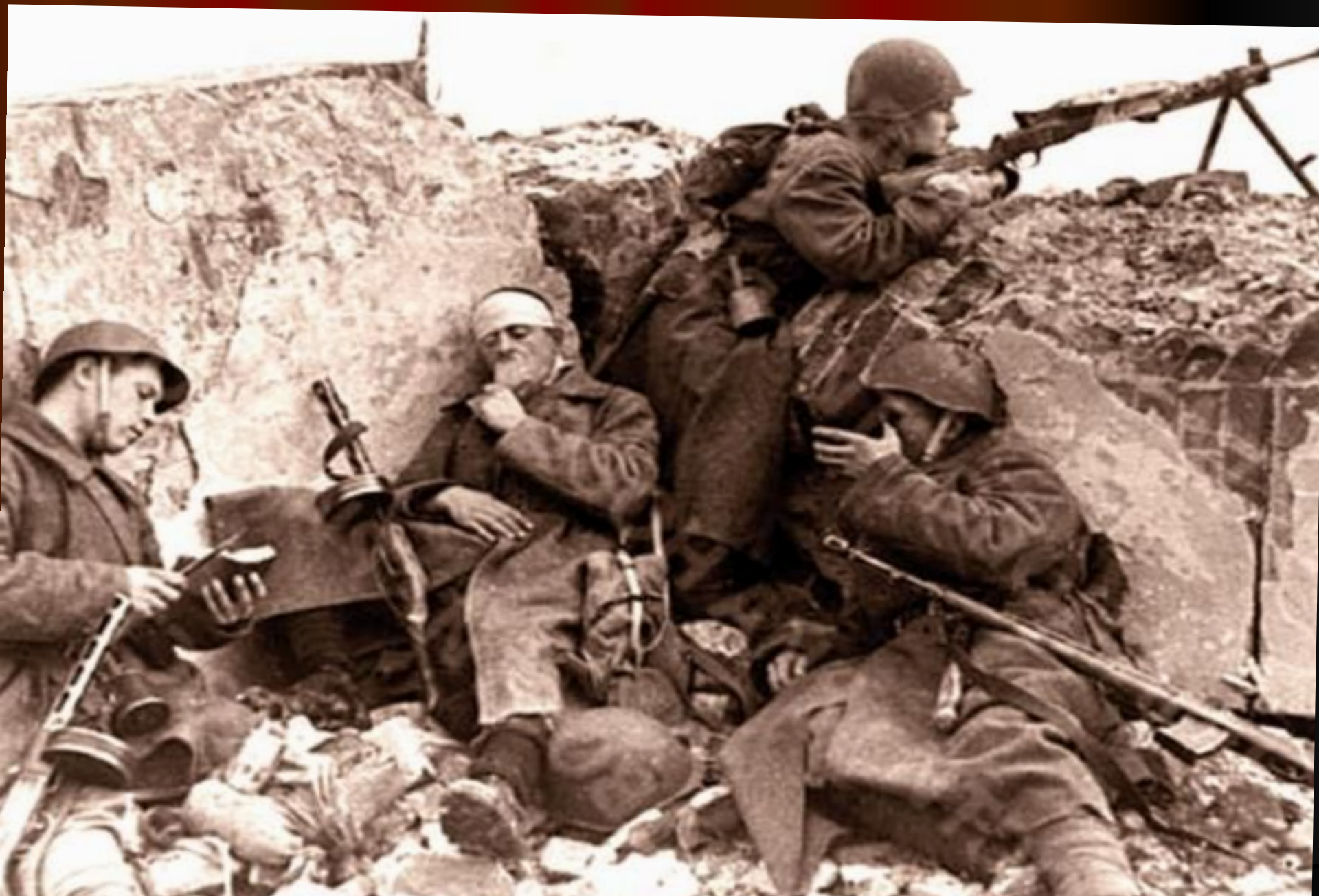
Бои под Новочеркасском