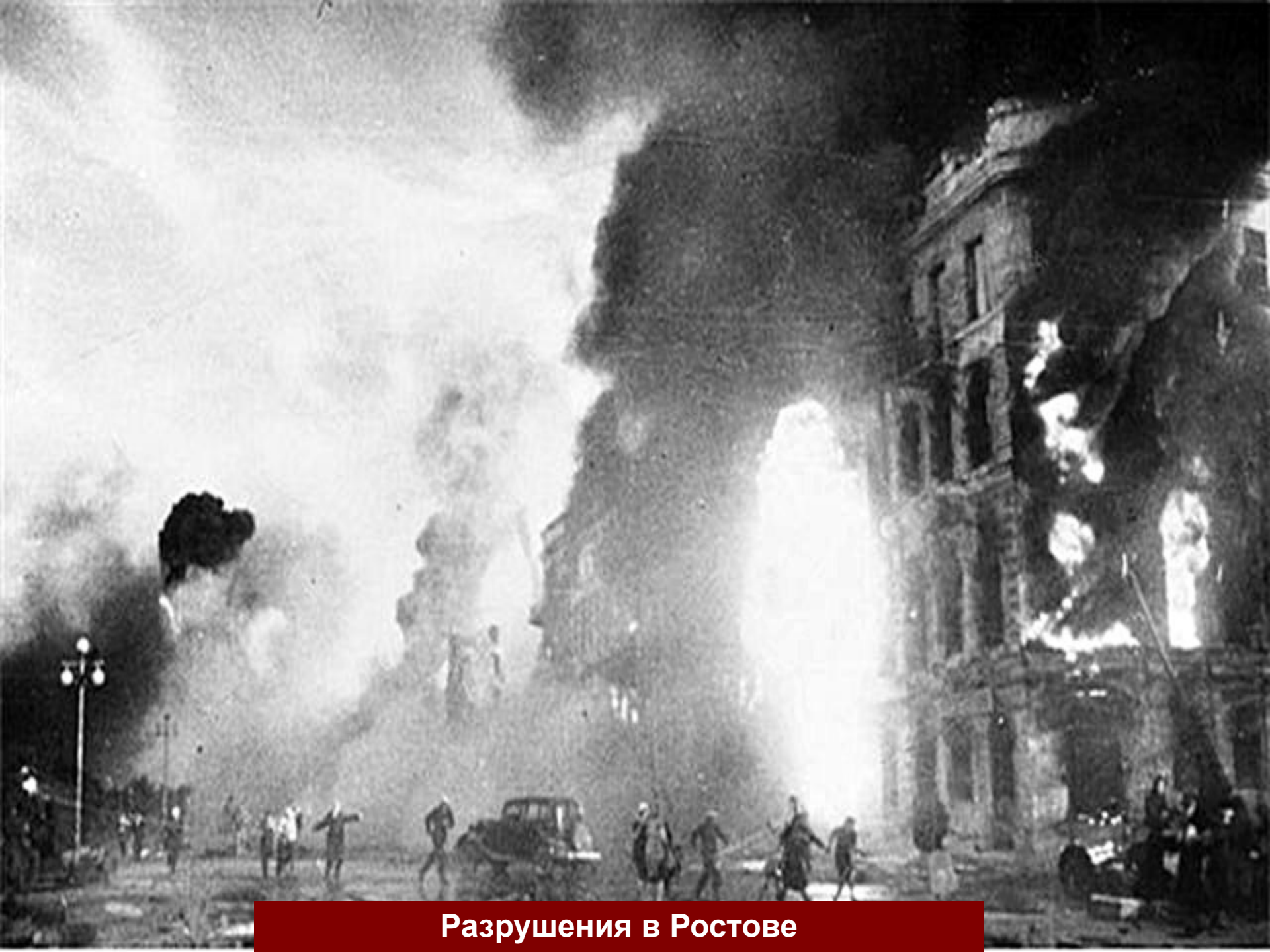
Разрушения в Ростове