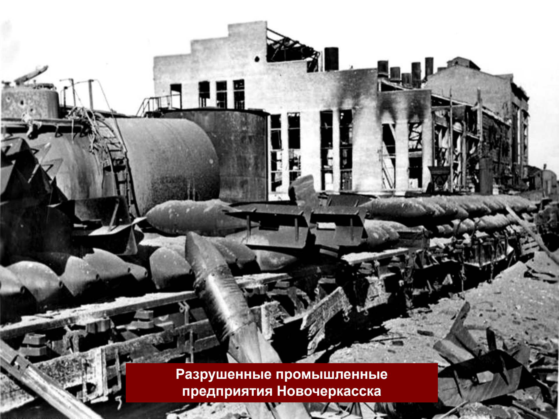
Разрушенные промышленные предприятия Новочеркаска