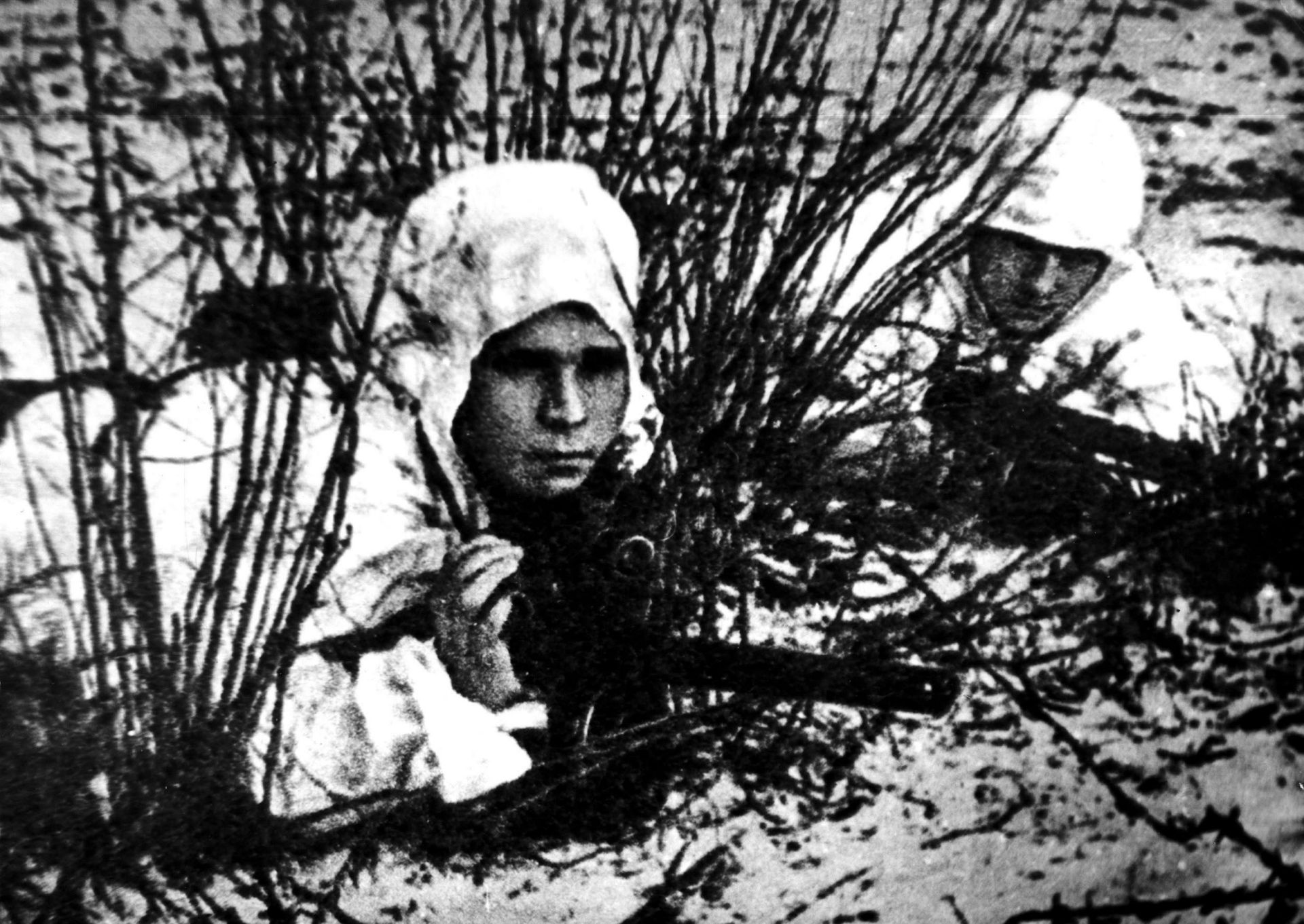
Наступление перед освобождением Новочеркаска.