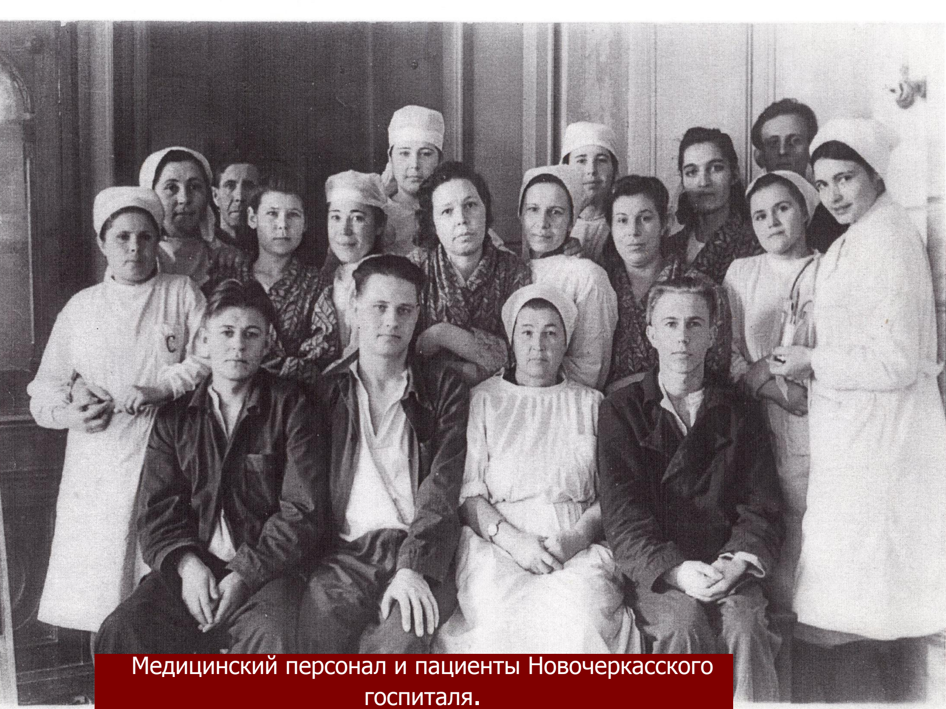
Медицинский персонал и пациенты Новочеркасского госпиталя.