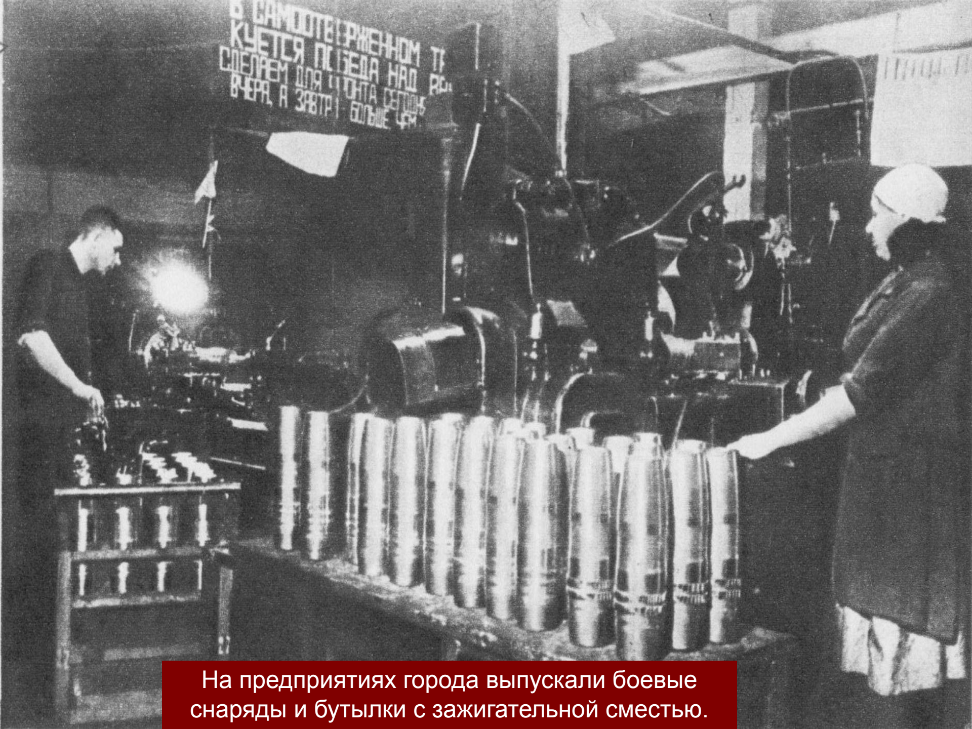
На предприятиях города выпускали боевые снаряды и бутылки с зажигательной смесью.