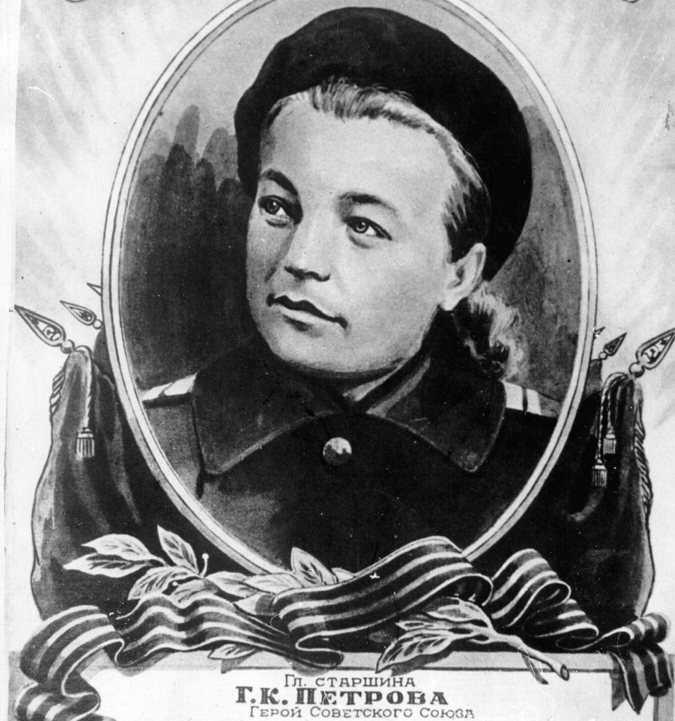
Пл. старшина Г. К. ПЕТРОВА Герой Советского Союза

★ ГЕРОИ ВЕЛИКОЙ ОТЕЧЕСТВЕННОЙ ВОЙНЫ 1941-1945 гг.