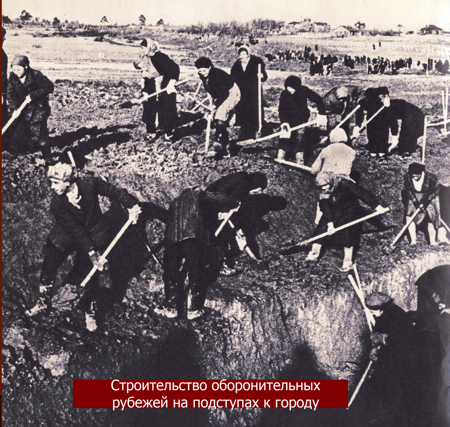
Строительство оборонительных рубежей на подступах к городу