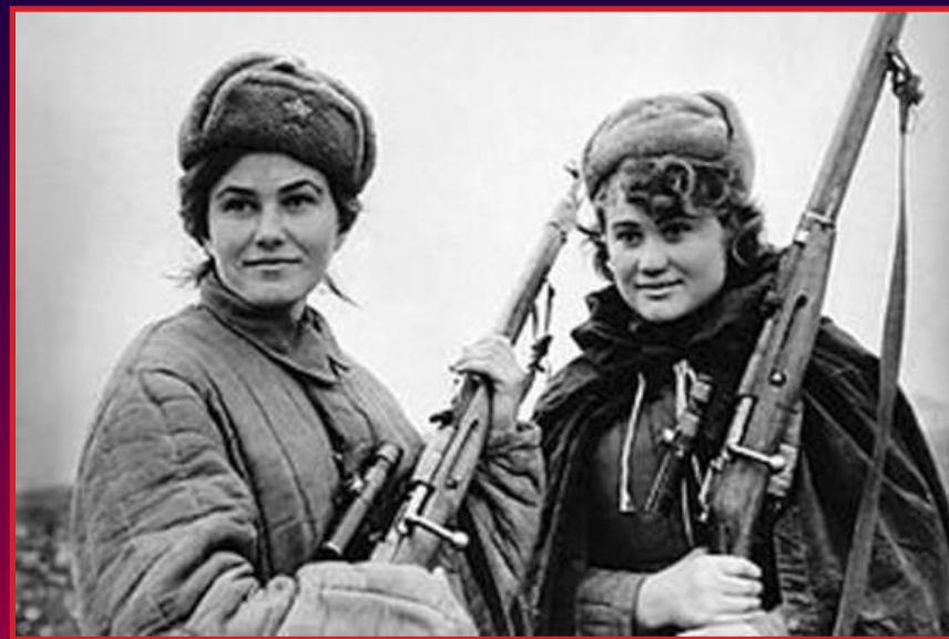
Девушки – снайперы.