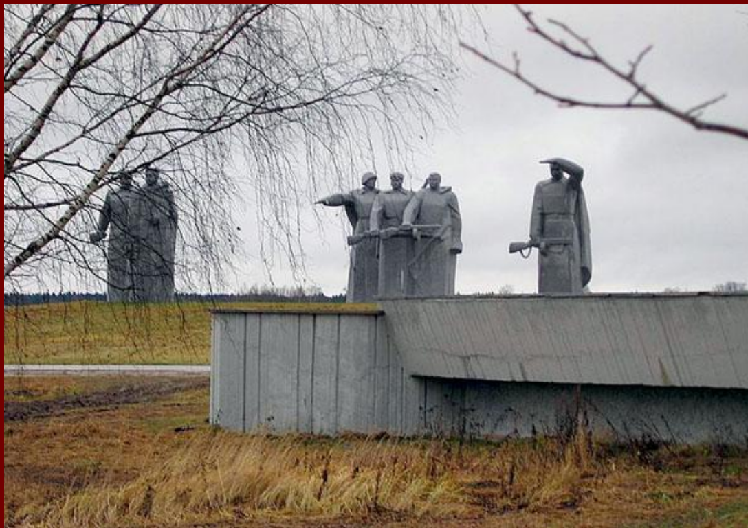
Мемориальный комплекс героев-панфиловцев.