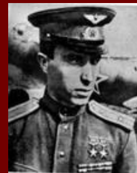
Л. И. Беда.

4 казахстанца стали дважды Героями Советского Союза: лётчики-штурмовики Талгат Бегельдинов, Леонид Беда, Иван Павлов и лётчик-истребитель Сергей Луганский