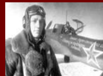
И. Ф. Павлов