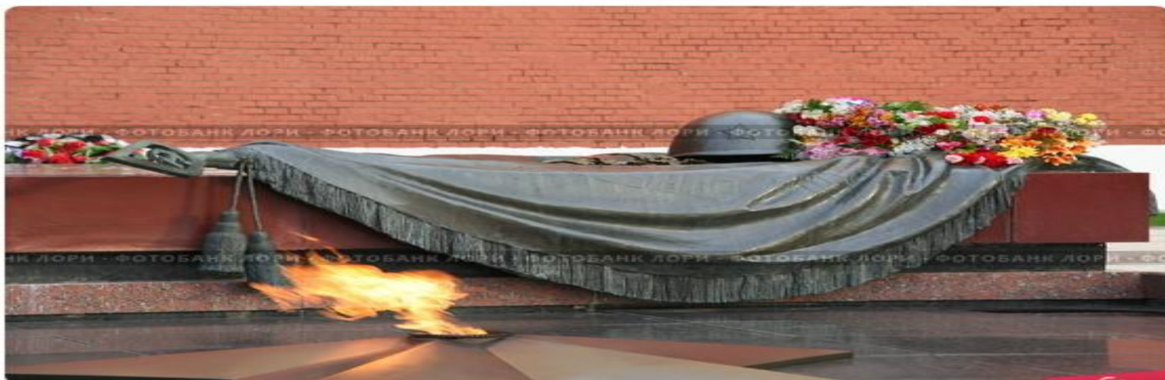
Мемориал Вечный Огонь, Москва, Красная площадь