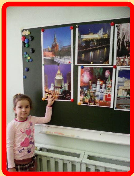
Рассматривание иллюстраций. Составление мини рассказов.

Цель: развивать у детей дошкольного возраста словарный запас. Развивать мышление, память, внимание. Учить детей составлять рассказы по иллюстрациям.