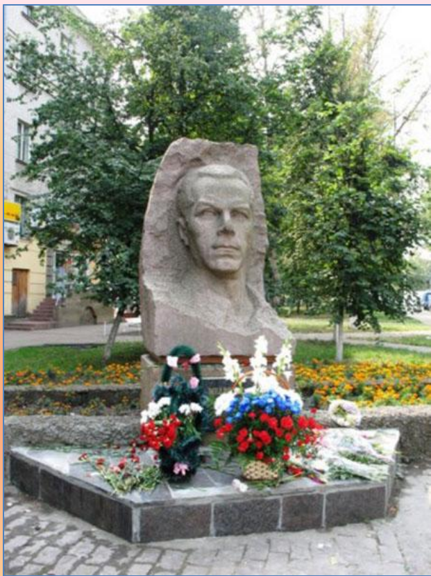
Бюст Д.Н.Медведеву в Брянске