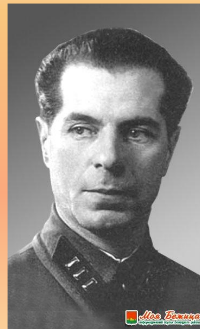
Дмитрий Николаевич Медведев (1898—1954) — чекист, партизан, писатель, Герой Советского Союза (1944)