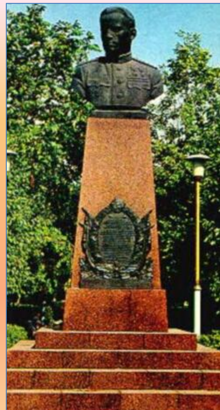
Бюст П.М. Камозину в Брянске