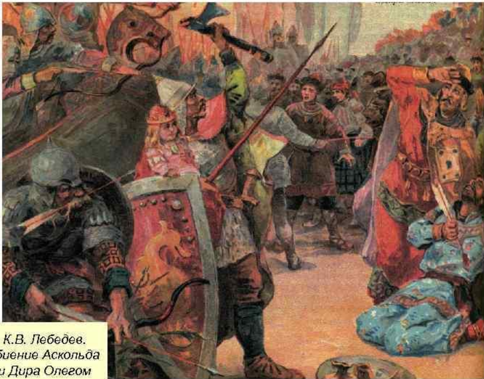
К.В. Лебедев. Убиение Аскольда и Дира Олегом