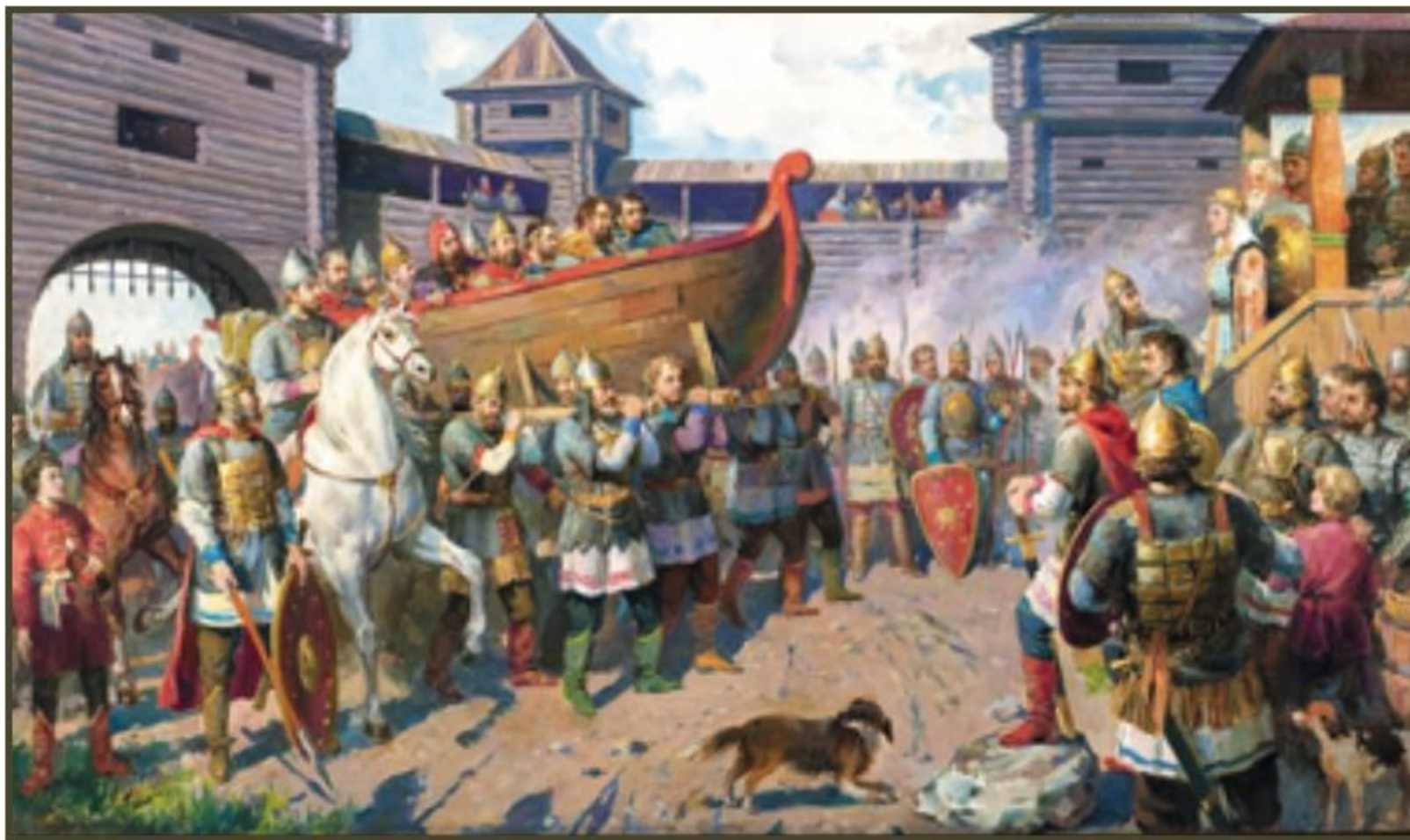
«МЕСТЬ КНЯГИНИ ОЛЬГИ ДРЕВЛЯНАМ ЗА СМЕРТЬ КНЯЗЯ ИГОРЯ» художник Коваленко И.А.