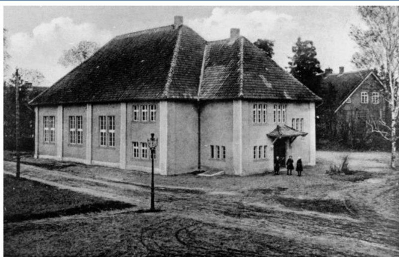
Heinrichswalde i. Ostpr. — Turnhalle

www.Bildarchiv-Ostpreussen.de 000397 / ID 3_81