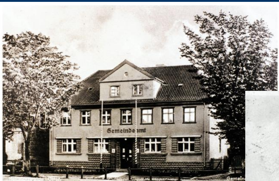
000094 / 03_81_06 Heinrichswalde, Kreis Elchniederung, MT09096-7. Heinrichswalde Gemeindegemeindeamt in der Marktstr.. (1920-1945)