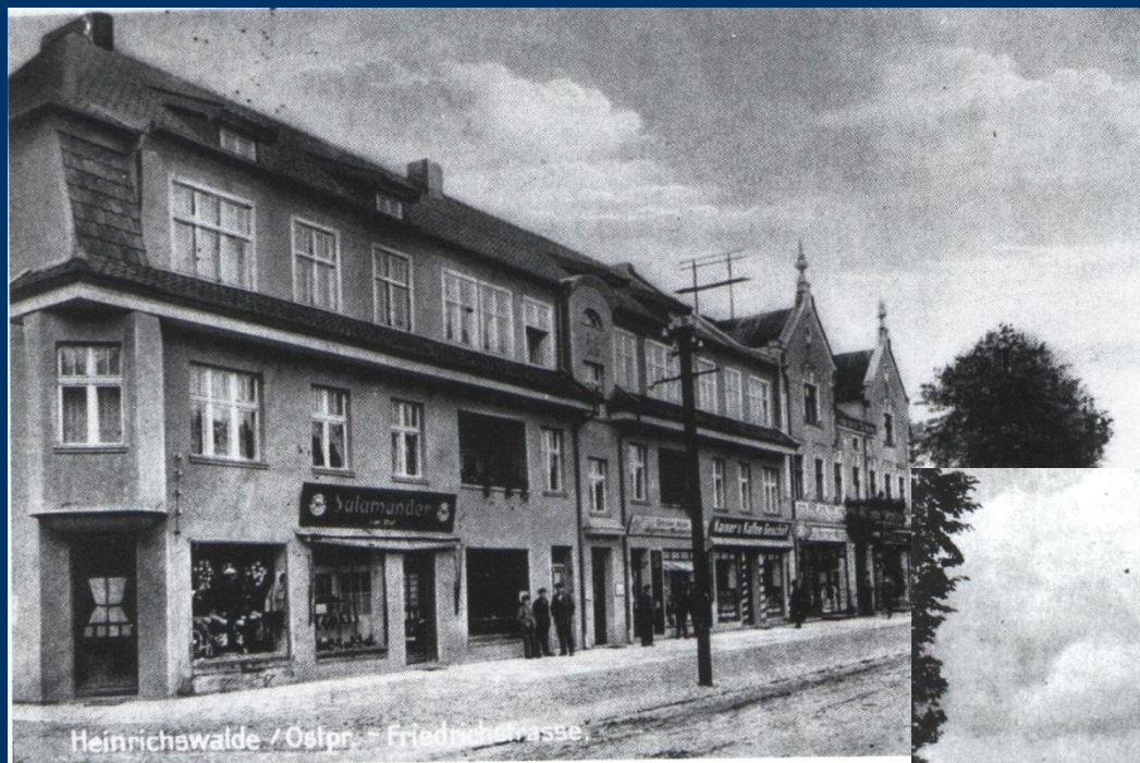
Friedrichstraße um 1930. Partie Mittelstraße in Richtung Grünbaumer Allee.