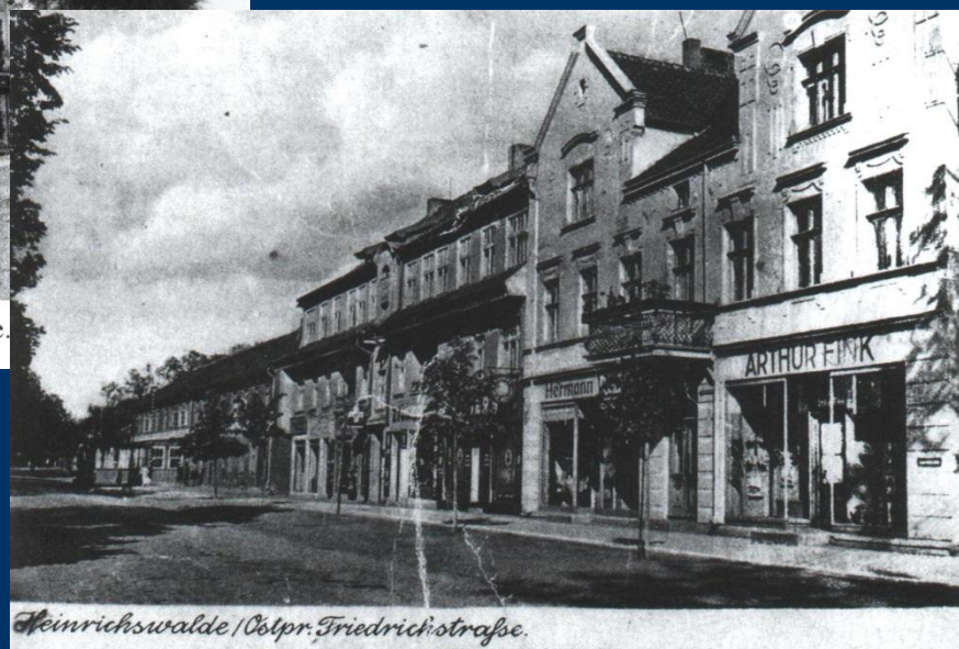
Heinrichswalde / Ostpr. Friedrichstraße.