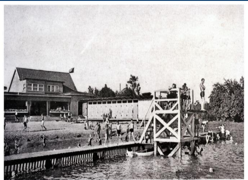
Heinrichswalde / Ostpr. Salz- und schwefelhaltiges Freibad.

Heinrichswalde, Kreis Elchniederung, MT09096-7. Turnhalle. (1925-1930)