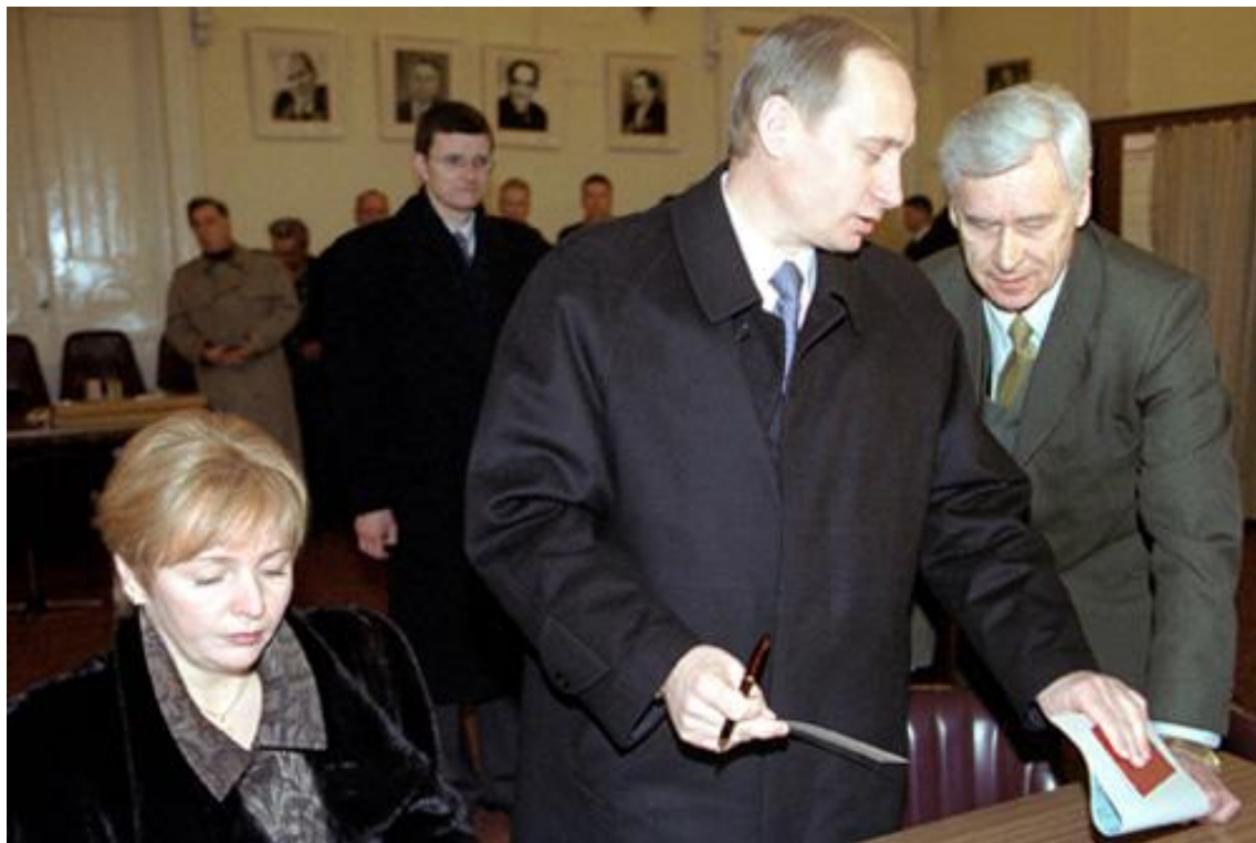
В.В. Путин на выборах 2000 год.

Первый срок президентства В.В. Путина был направлен на укрепление федеральной власти и продолжение социально-экономических преобразований в стране. Первой реформой нового президента после вступления в должность стали меры по укреплению вертикали государственной власти и усилению ее централизации в стране, а именно: