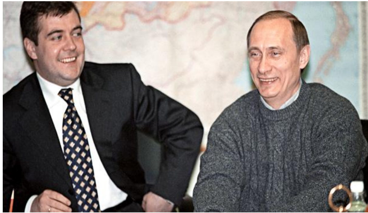
В.В. Путин на выборах 2000 год.

По мнению британского историка, заведующего кафедрой международных отношений Билькентского университета Нормана Стоуна, Путину «удалось вырвать Россию из исторической тенденции, которая при её продолжении могла привести к распаду России как государства».