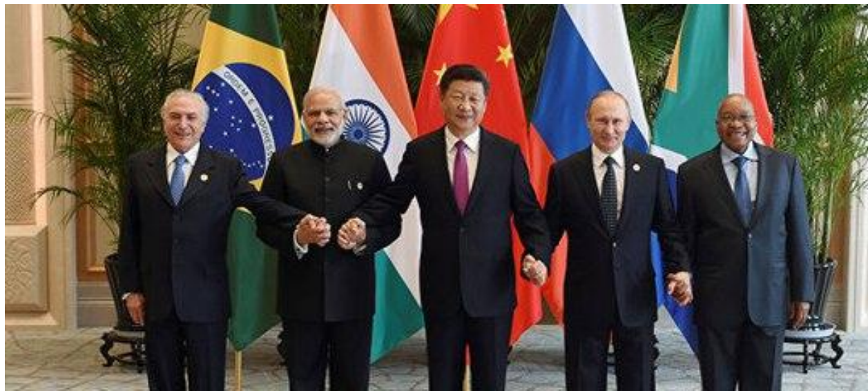
В.В. Путин с лидерами стран БРИГС.