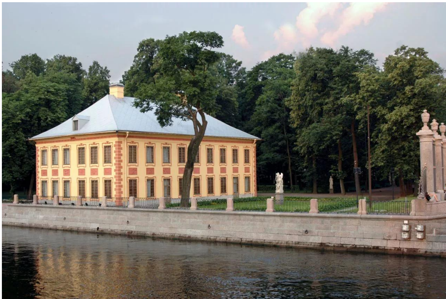
Летний дворец. С-П. Арх. Доменико Трезини. Первая половина 18 века.