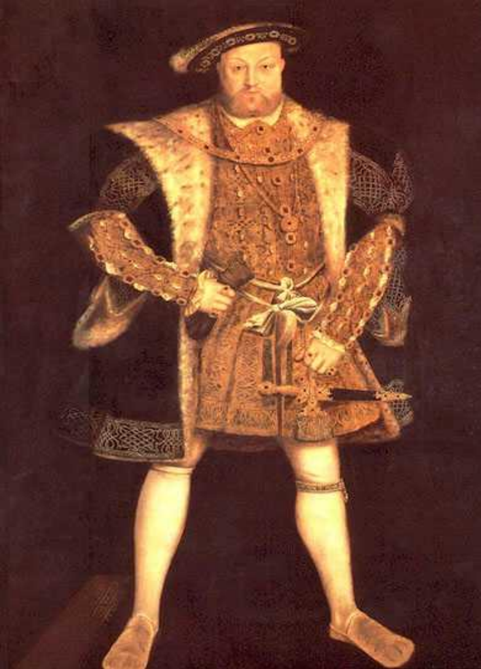
○ Генрих VIII