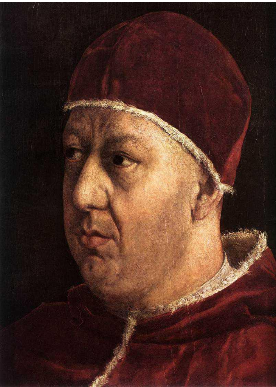
ПАПА ЛЕВ X