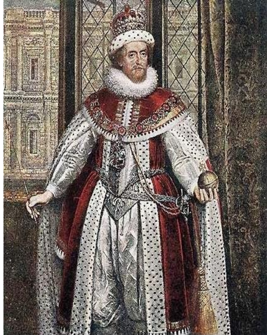
Коронационный портрет Якова I