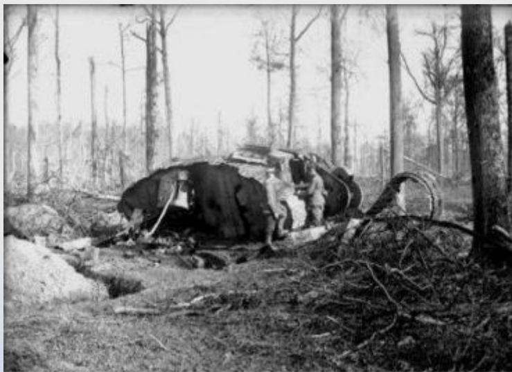
Imperial War Museum, London File 1-101 1107 November - December

Однако в результате стремительной атаки пехота отстала, а танки продвинулись далеко вперёд, понеся серьёзные потери. 30 ноября 2-я германская армия совершила внезапную контратаку, отбросив силы союзников на первоначальные рубежи. Несмотря на отражение атаки, танки доказали свою эффективность в бою, а сама битва положила начало широкому применению танков и развитию противотанковой обороны.