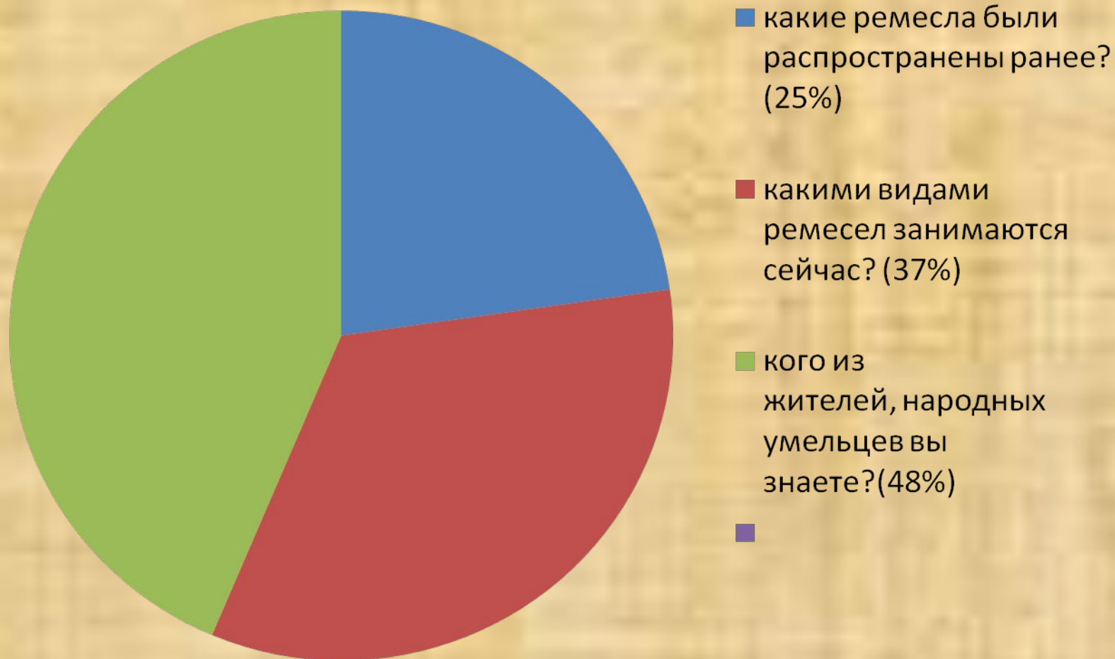
Диаграмма «Результаты социологического опроса»