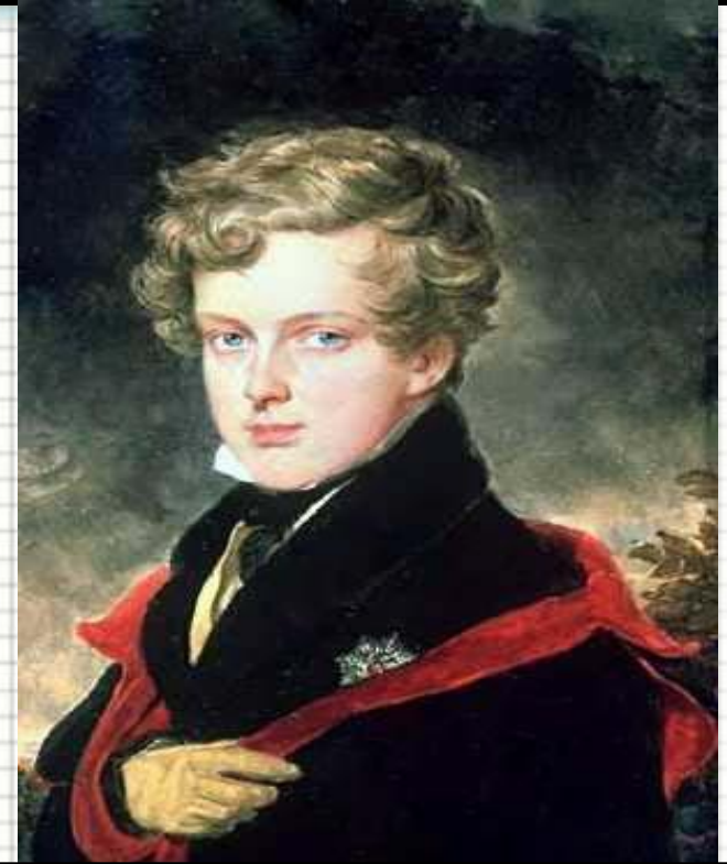
Наполеон II – сын Бонапарта

В 1810 г. Наполеон женится на дочери австрийского императора Марии – Луизе, подарившая ему наследника, который умер молодым.