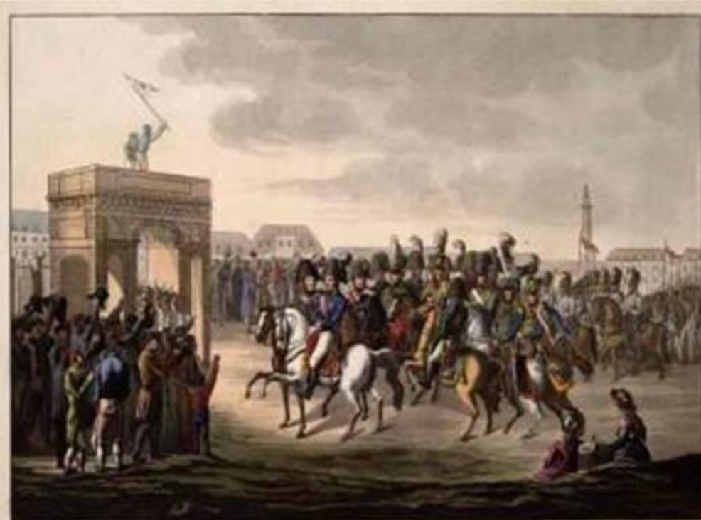
FEIERLICHER ZUG DER ALLIIRTEN KÖNIGLICHEN UND KÖNIGLICHEN TRUPPEN IN PARIS.

31 марта 1814 года войска коалиции вошли в Париж . Верхом на белом коне ехал русский император Александр I.