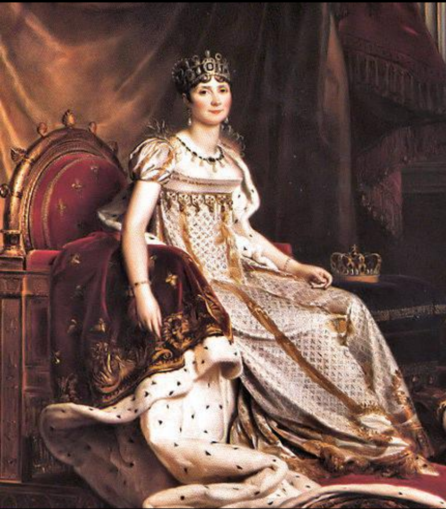
Жозефина, первая жена Наполеона

В распоряжении Наполеона было три королевских дворца, к национальным французским праздникам прибавился ещё один – день рождение императора, к его жене, Жозефине, обращались « мадам »