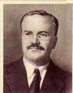
В. М. МОЛОТОВ