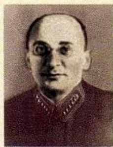
Л. П. БЕРИЯ

30 июня 1941 года – создан Государственный Комитет Обораны (ГКО)