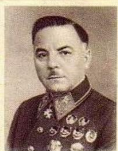
К. Е. ВОРОШИЛОВ