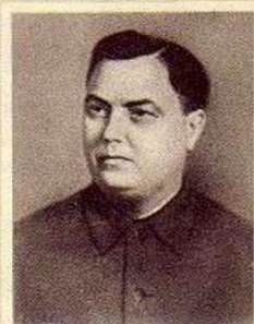
Г. М. МАЛЕНКОВ