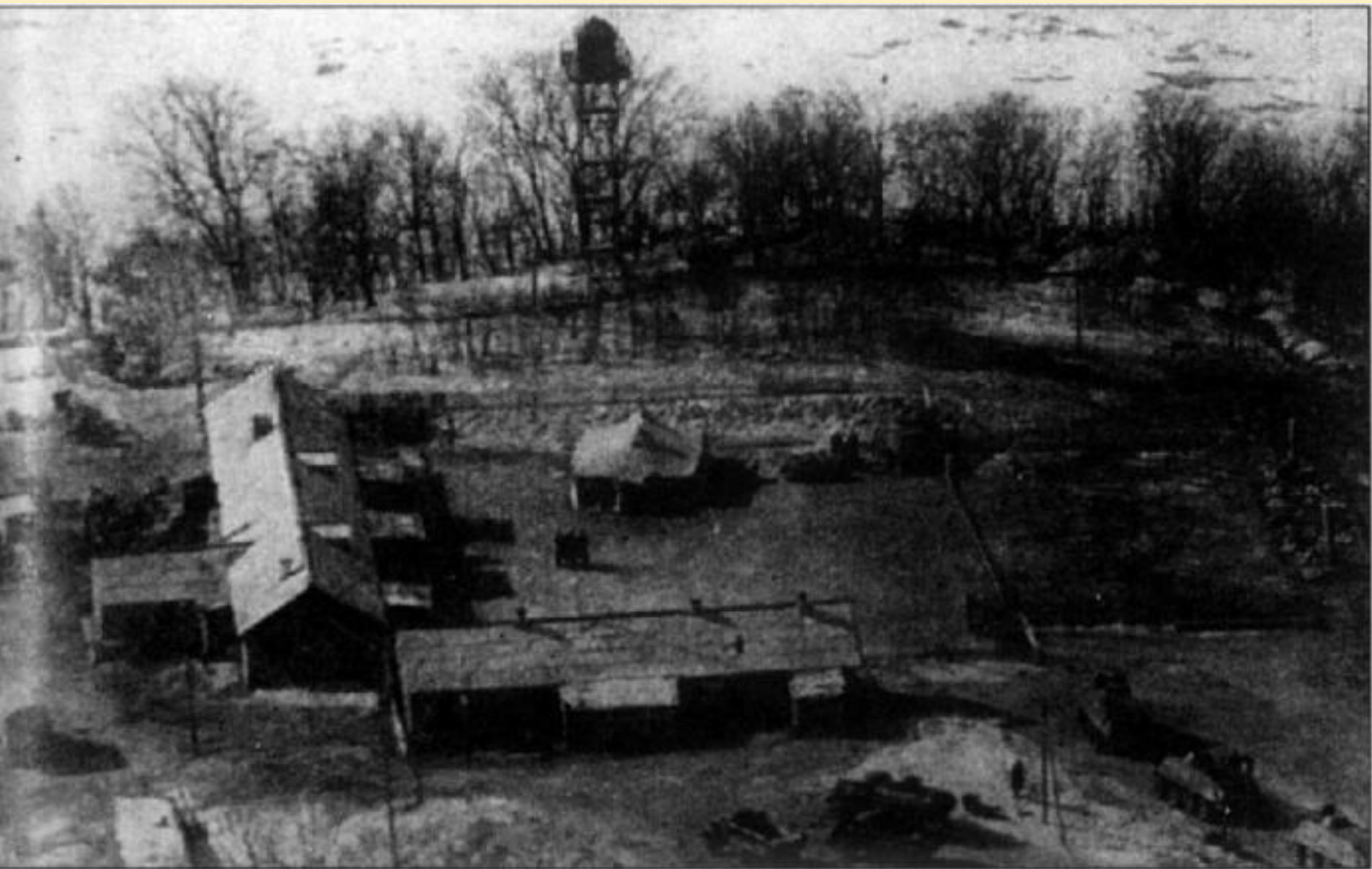
Знаменитая застава «Нижне-Михайловка». В правом нижнем углу видны бронетранспортеры БТР-60ПБ