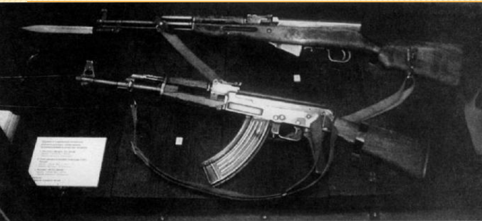
Китайские карабин Симонова и автомат Калашникова, захваченные в боях на острове Даманский