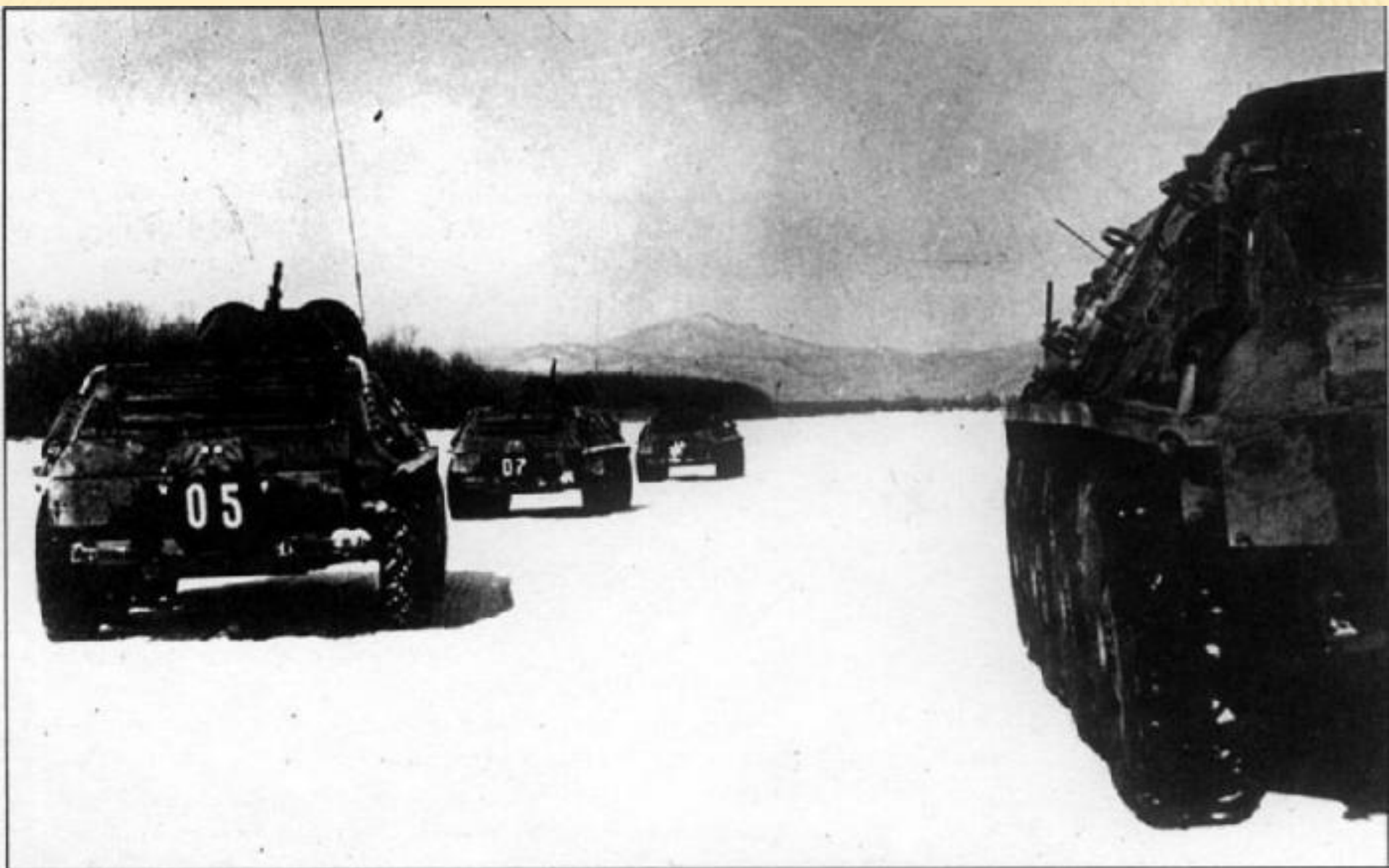
Бронетранспортеры БТР-60ПБ выдвигаются на позиции. 15 марта 1969 г. район о. Даманский