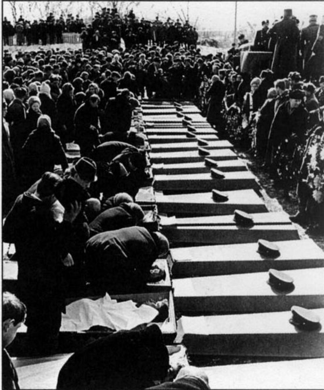
Похороны бойцов, погибших в бою на Даманском. Март 1969 г.