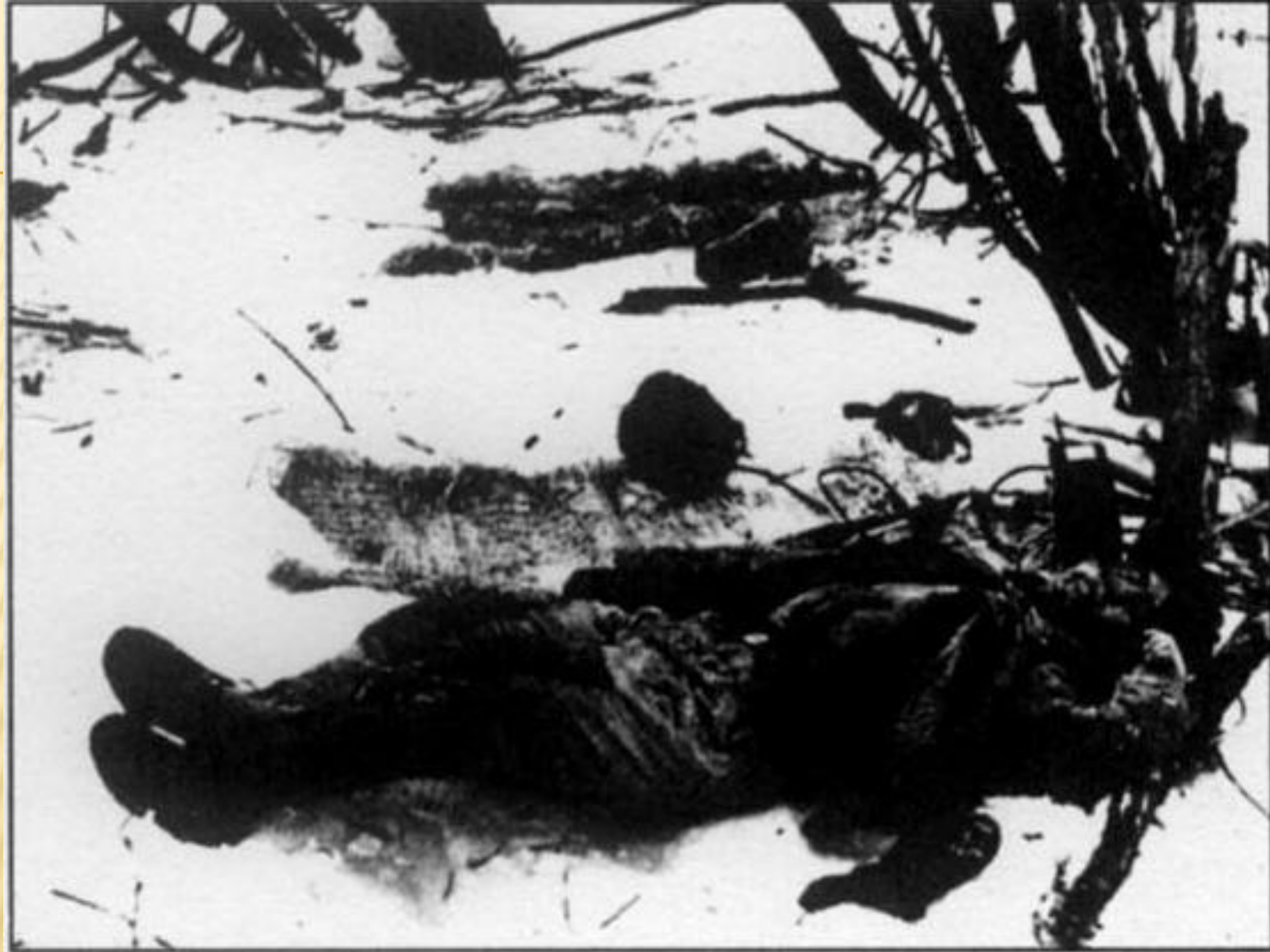
Один из китайских провокаторов, убитый на Даманском в бою 2 марта 1969 г.