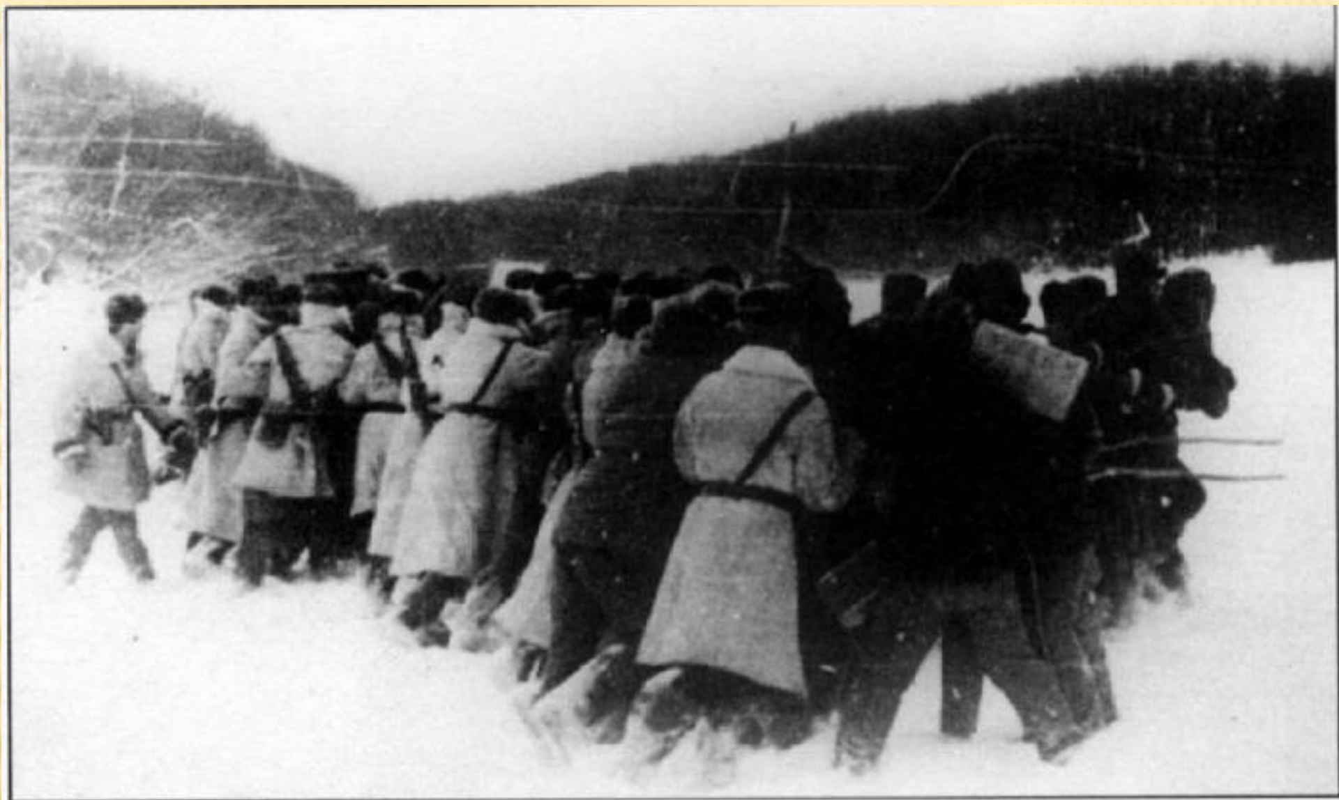
«Тактика живота». Личный состав 1-й погранзаставы вытесняет китайских провокаторов с советской территории. Остров Киркинский, 13 декабря 1967 г.