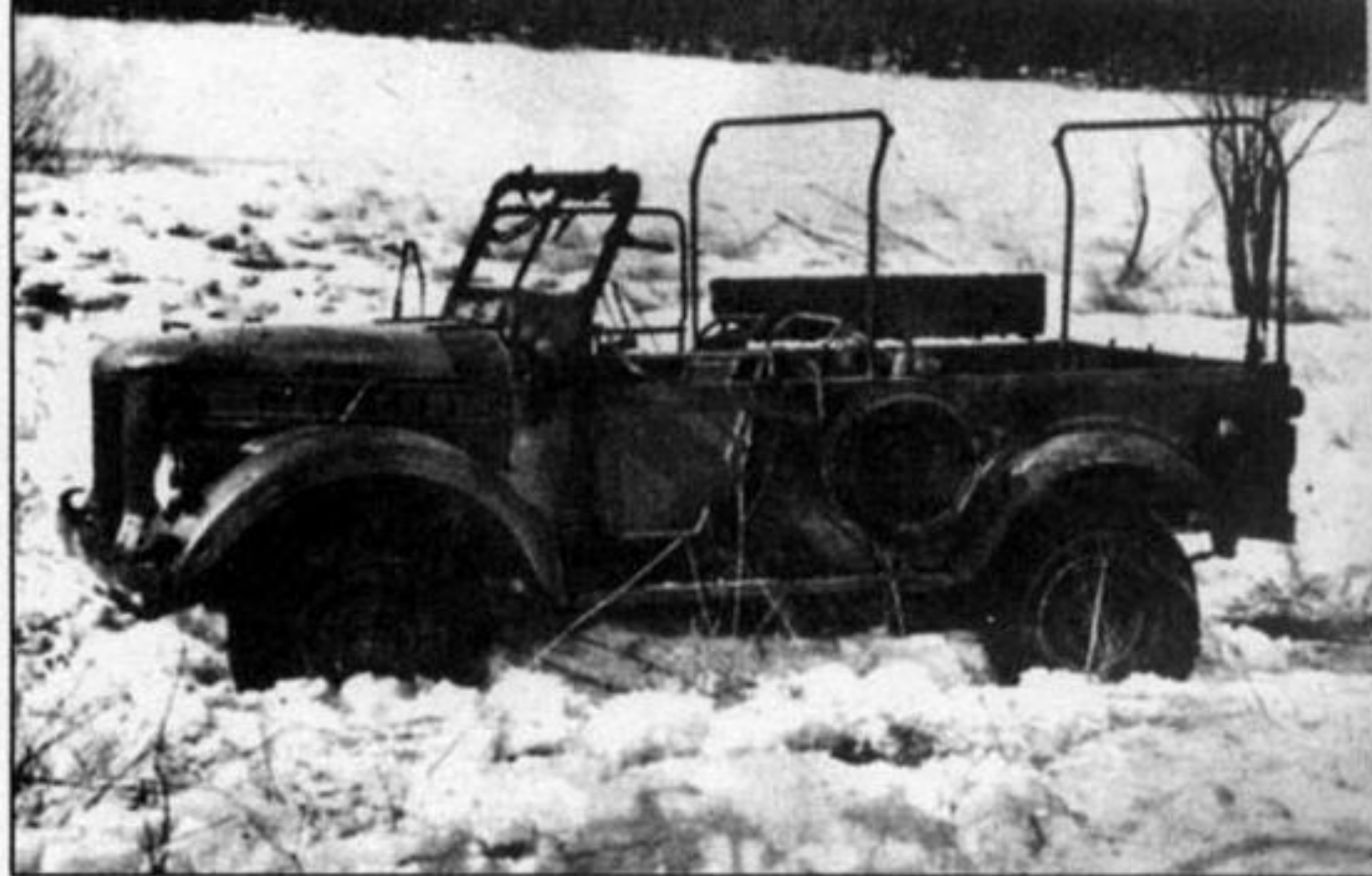
Подбитый ГАЗ-69, принадлежавший 2-й погранзаставе. 2 марта 1969 г.