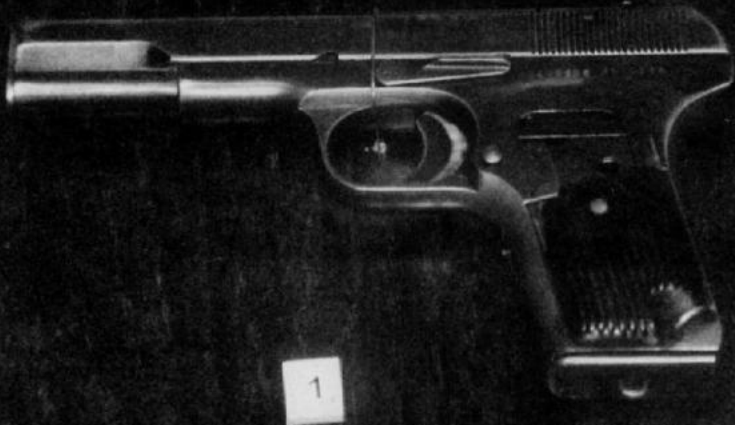
Китайский аналог советского пистолета ТТ, захваченный в боях на Даманском в марте 1969 г.