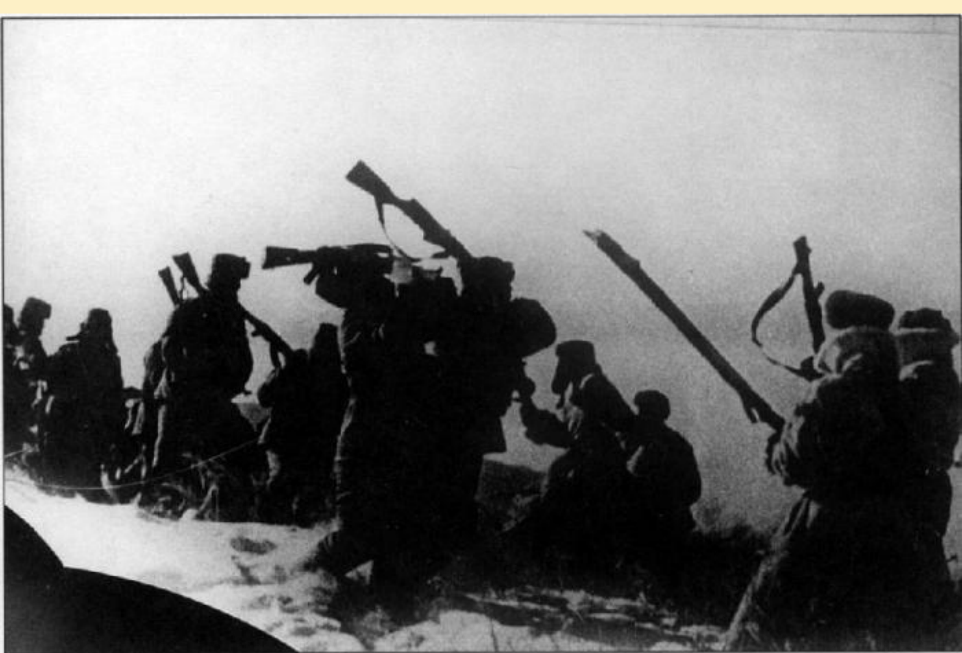
«Атака» китайцев на советских пограничников. Одна из драк на о. Даманском. Зима 1969 г.