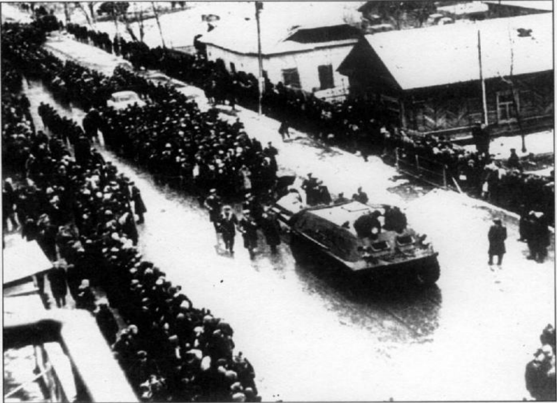
Похороны пограничников, погибших в бою на острове Даманский. Март 1969 г.