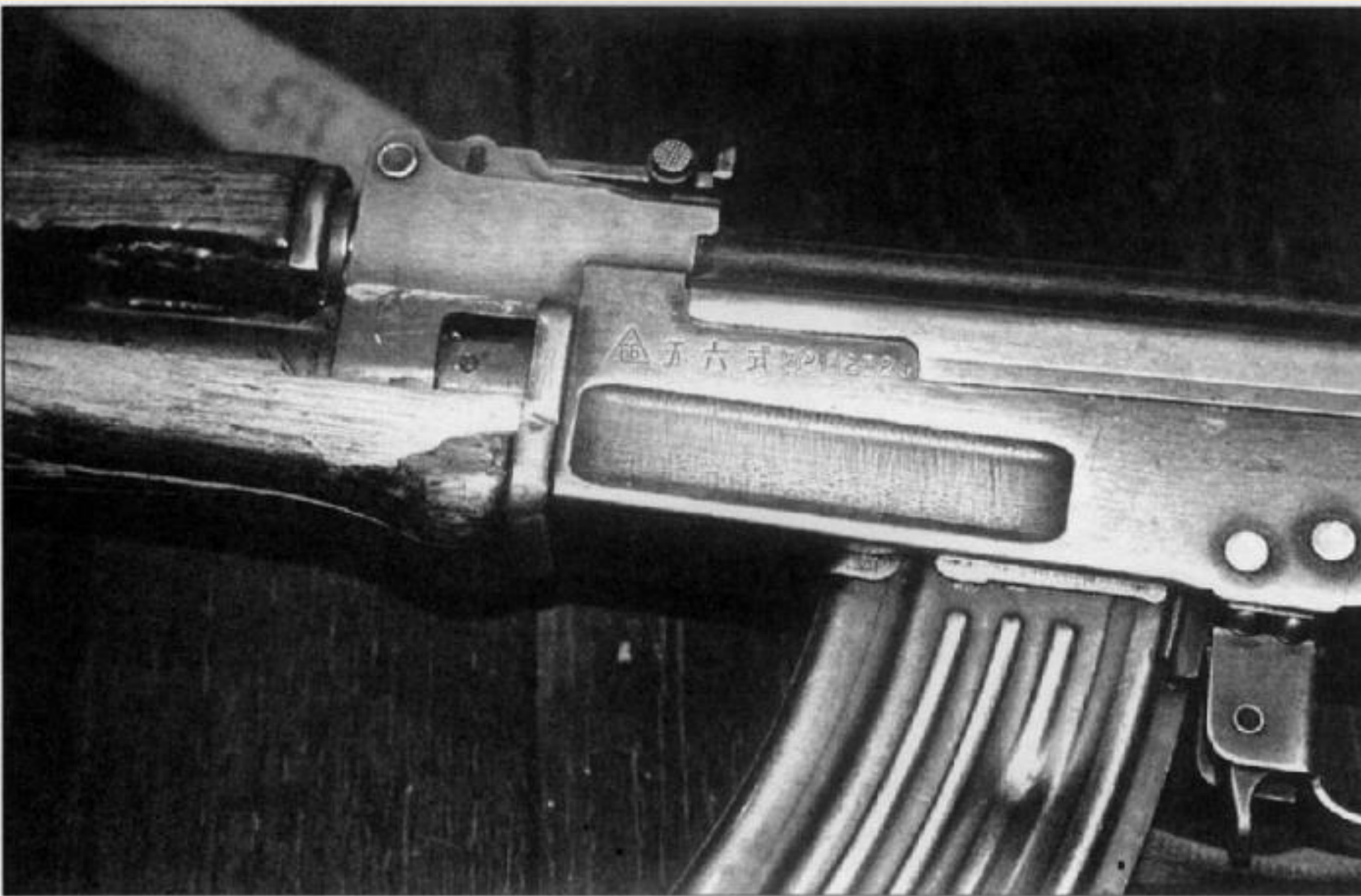
Китайский аналог советского автомата Калашникова, захваченный в бою на острове Даманский