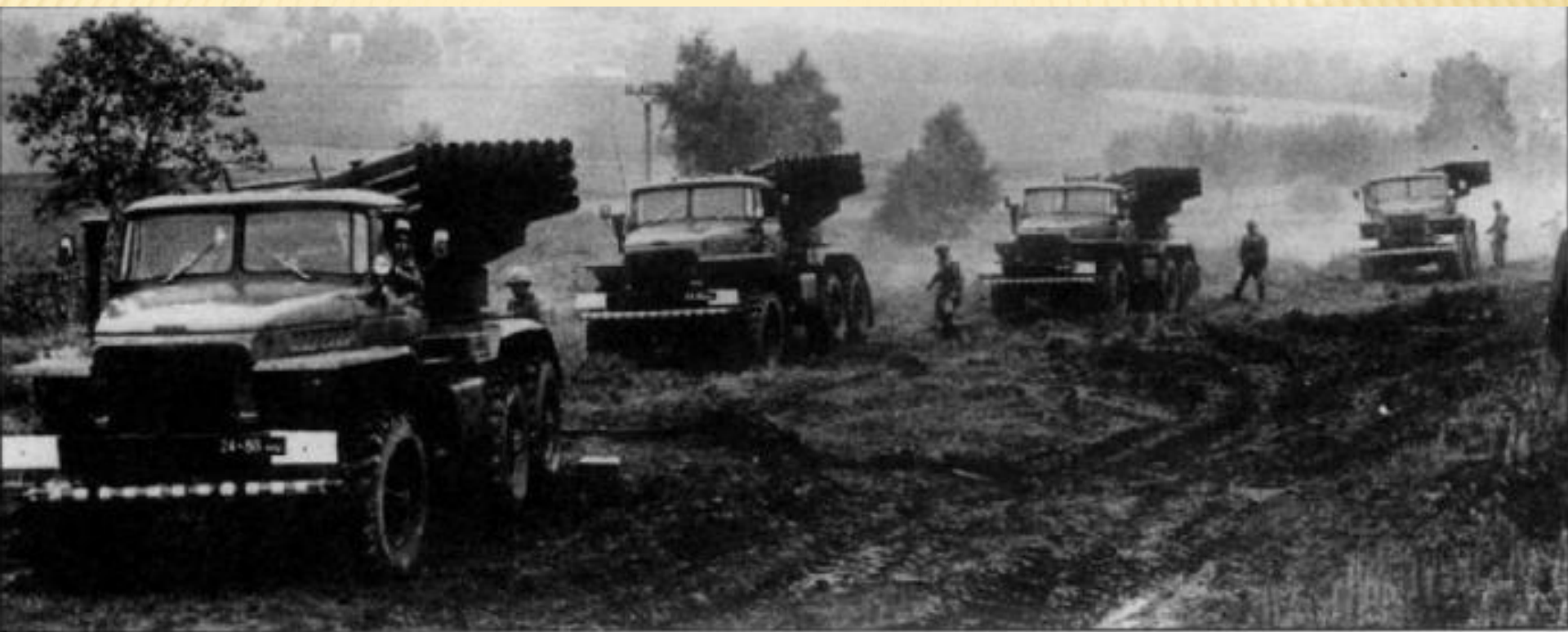
Установки залпового огня БМ-21 «Град». В 1969 г. они считались секретным оружием, поэтому фотографии именно тех, которые решили исход боя на о. Даманском 15 марта отсутствуют