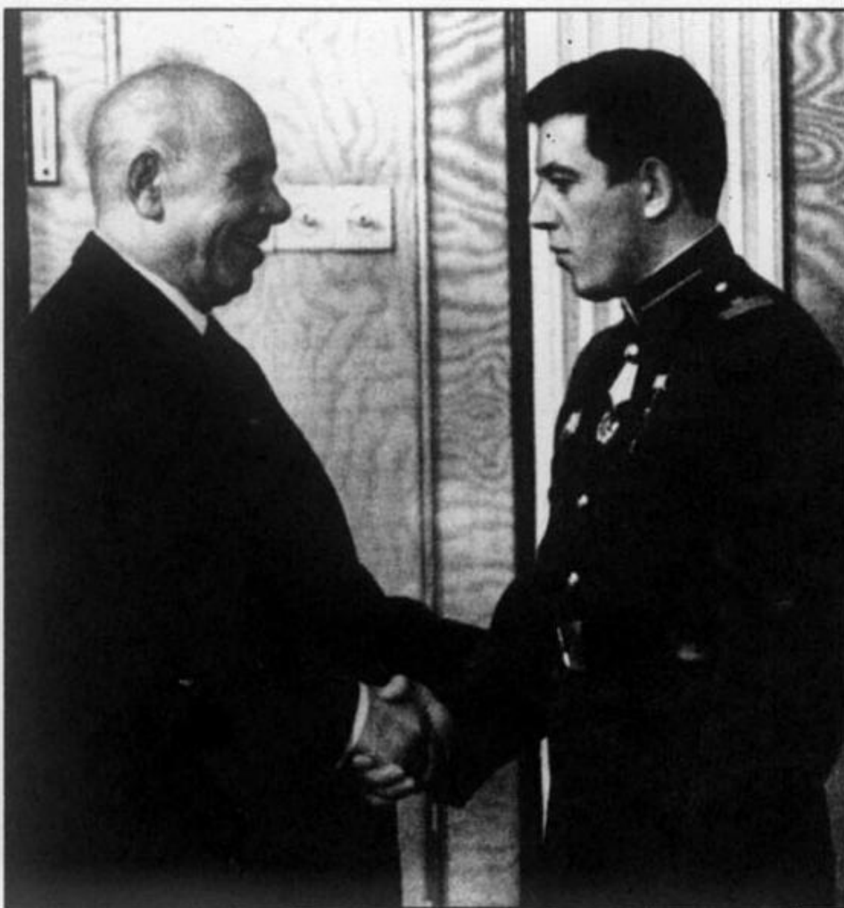
Ю. В. Бабанский (справа) во время награждения в Кремле. Апрель 1969 г.