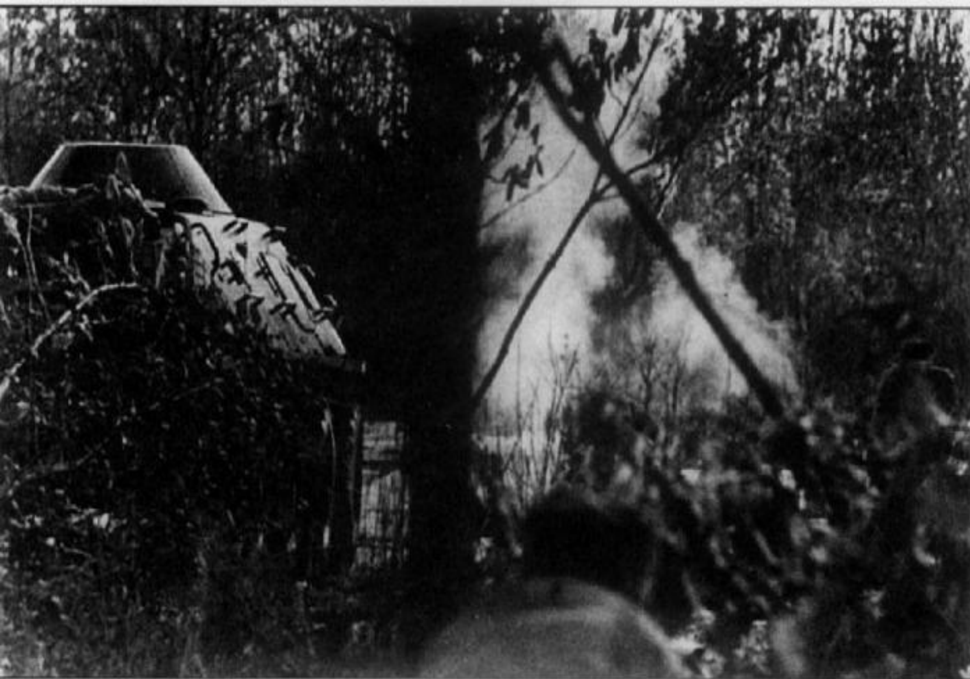
Под прикрытием бронетранспортера БТР-60ПБ пограничники ведут бой на острове Даманский. 15 марта 1969 г.