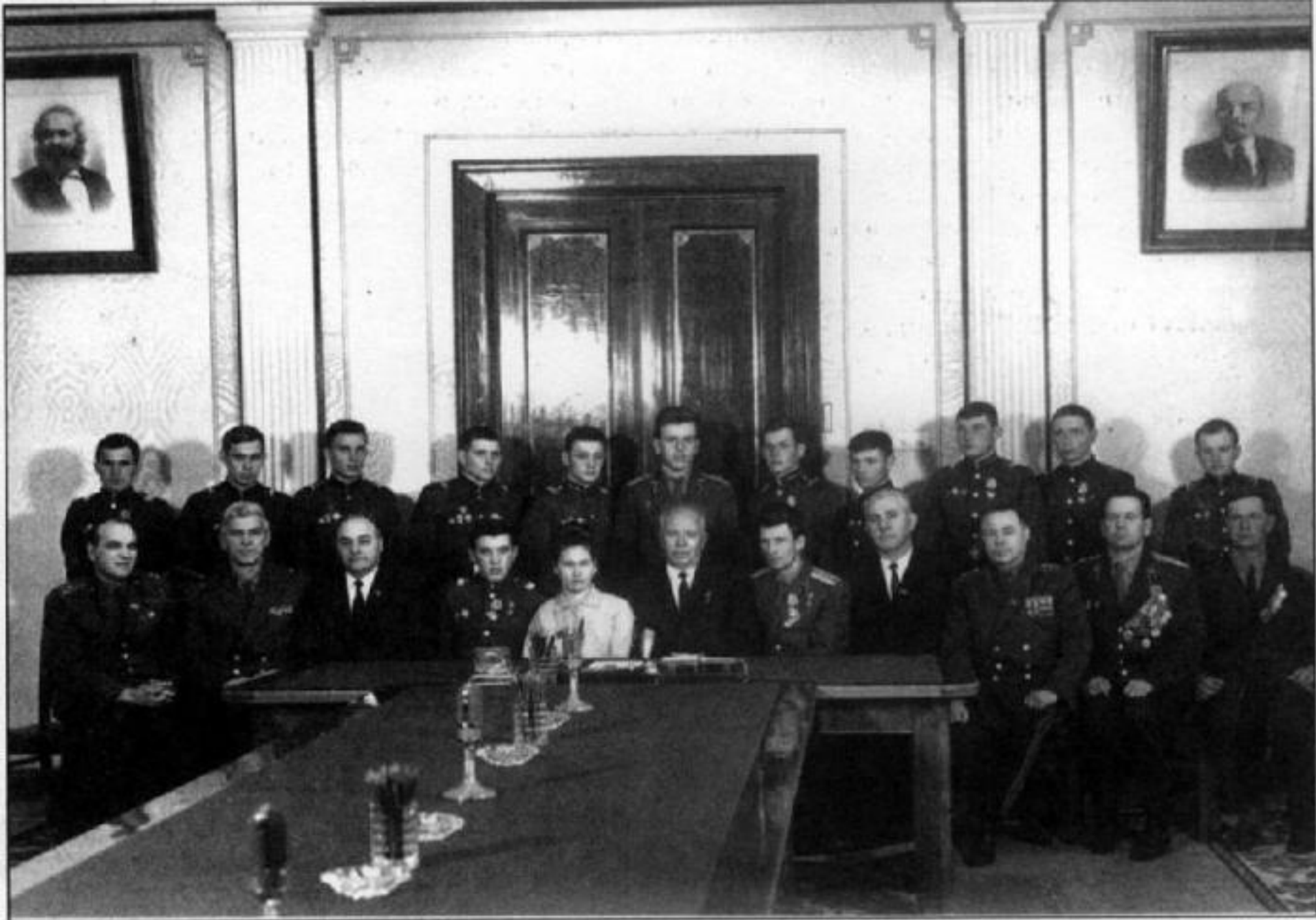
Участники боев на о. Даманском во время награждения в Кремле. Апрель 1969 г.