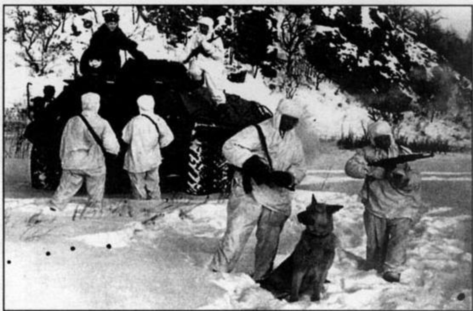
Пограничный наряд 1-й погранзаставы. Декабрь 1968 г.