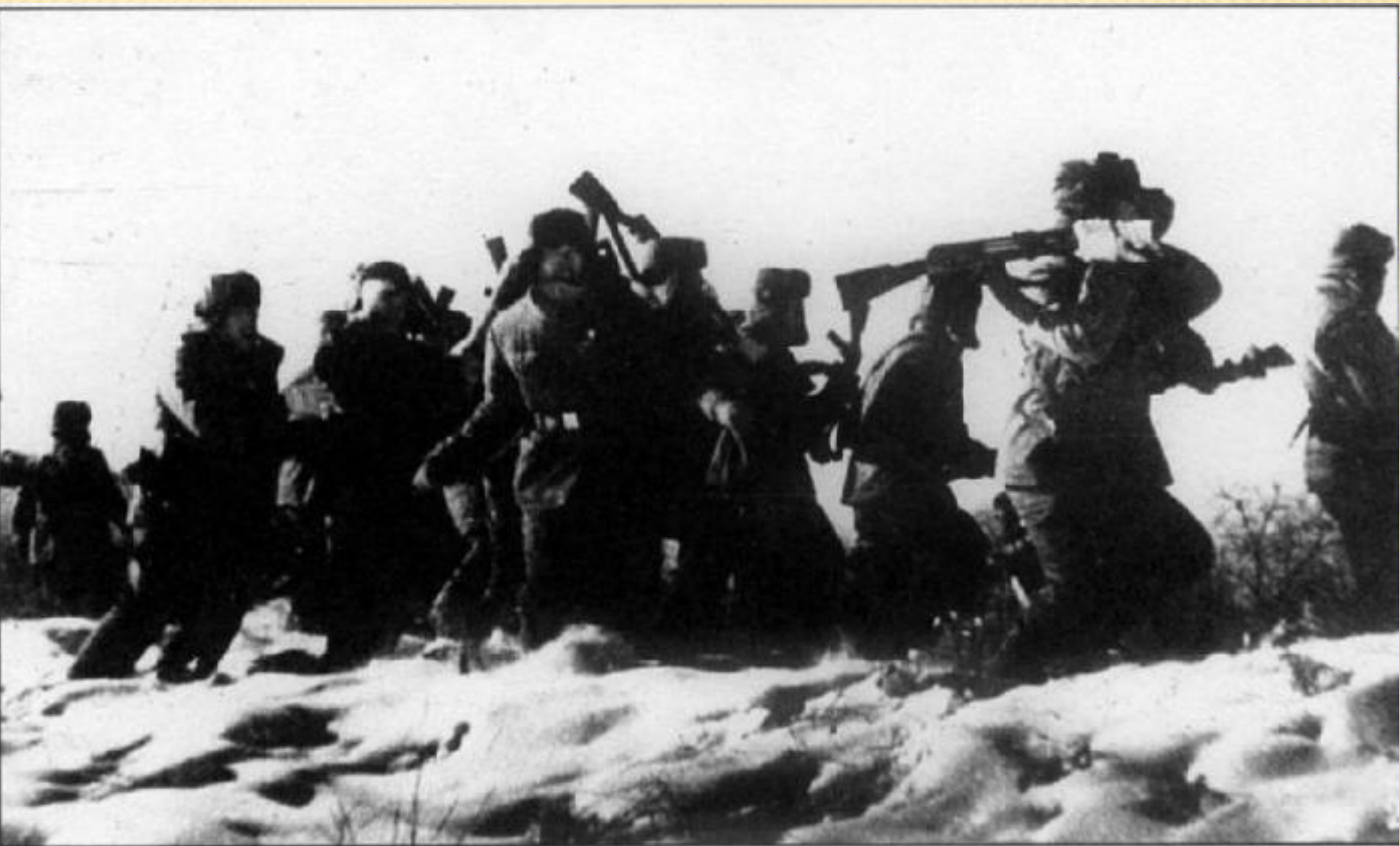
Китайские военнослужащие провоцируют драку. Автоматы и карабины пока используются в качестве дубин. В центре толпы начальник китайского погранпоста «Гунсы» размахивает кобурой с пистолетом. Даманский, январь 1969 г.