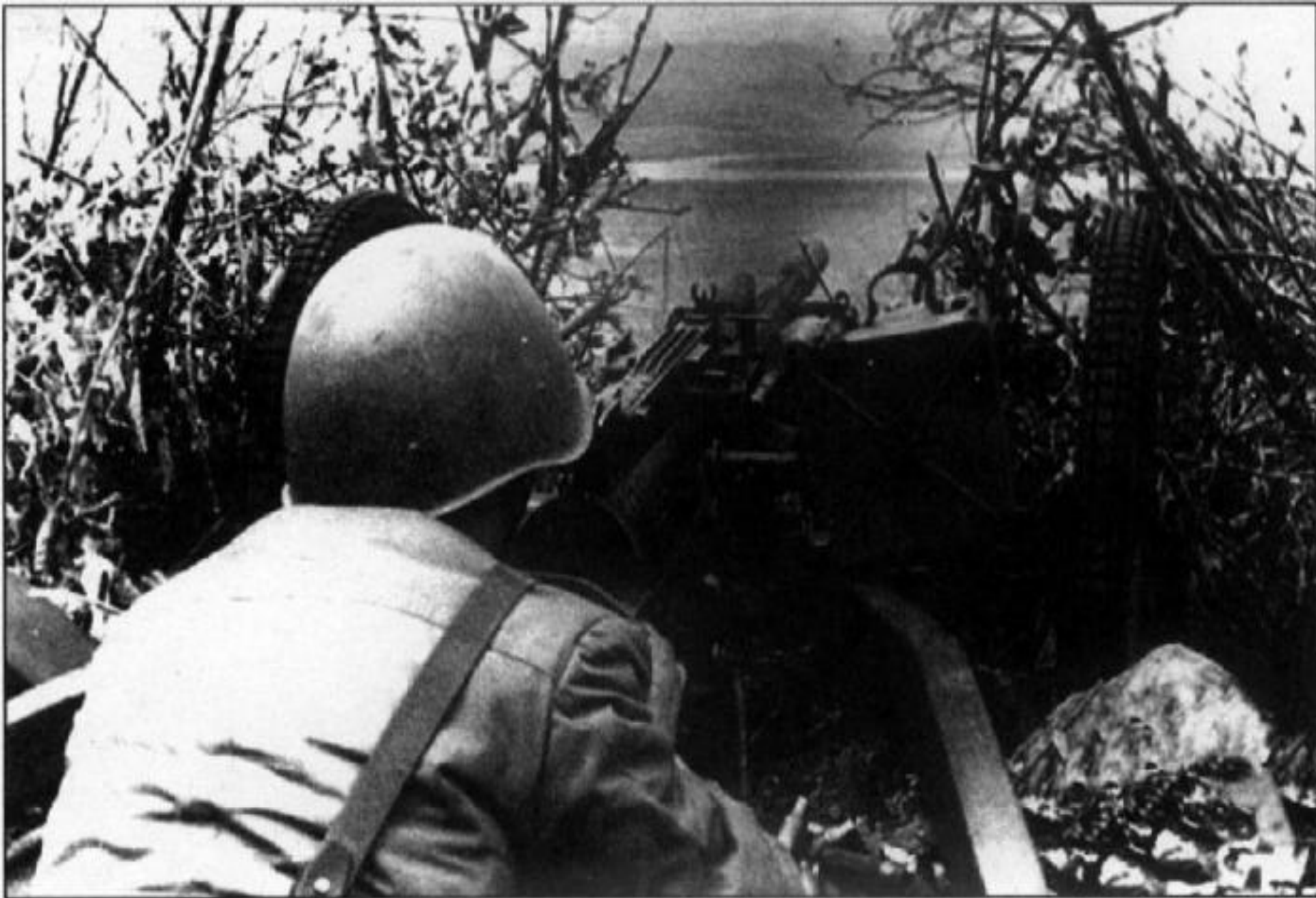
Майор Жезлов во время боя 15 марта 1969 г. на о. Даманский