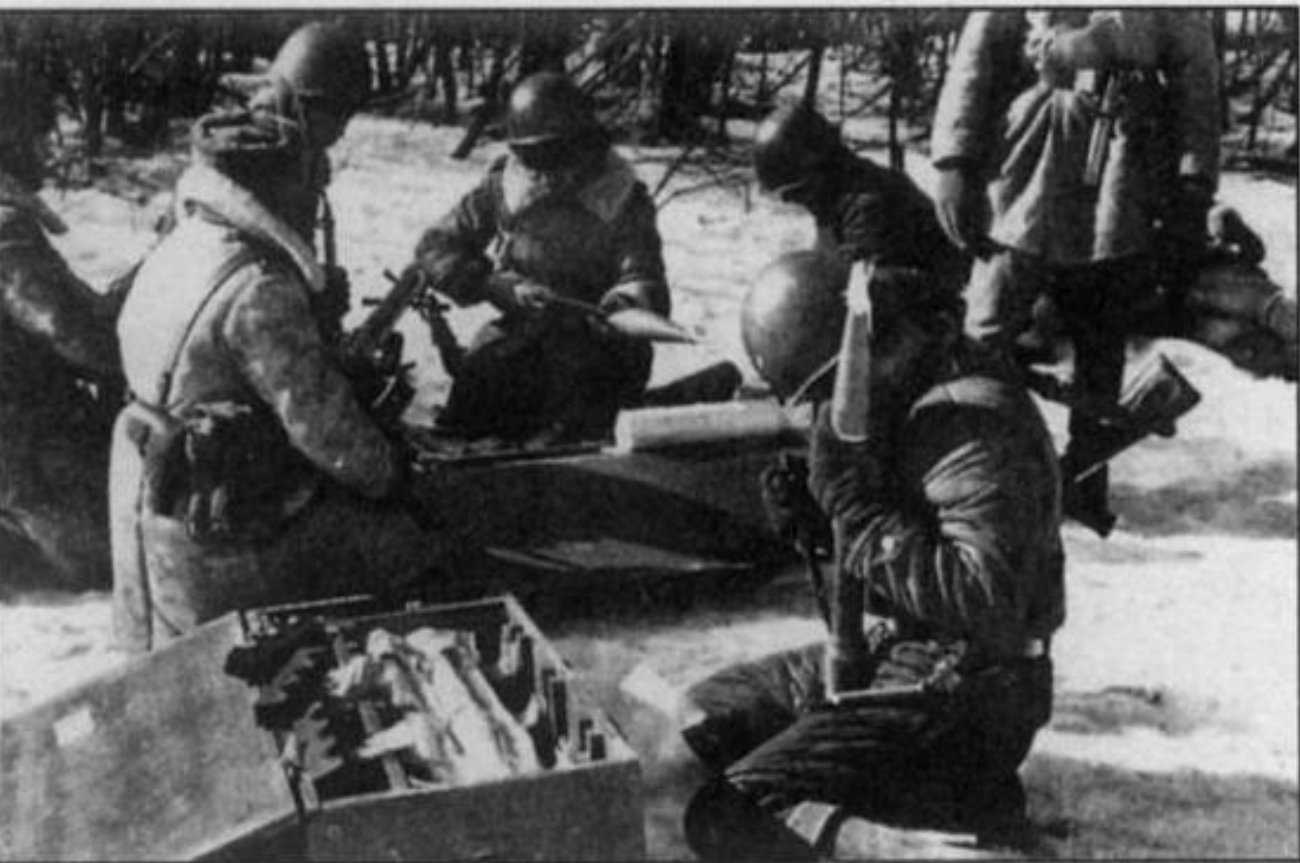
Пограничники из мотомангруппы 57-го погранотряда готовятся к бою, 15 марта 1969 г.