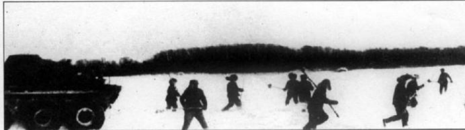
Разгон китайских провокаторов с помощью БТРа