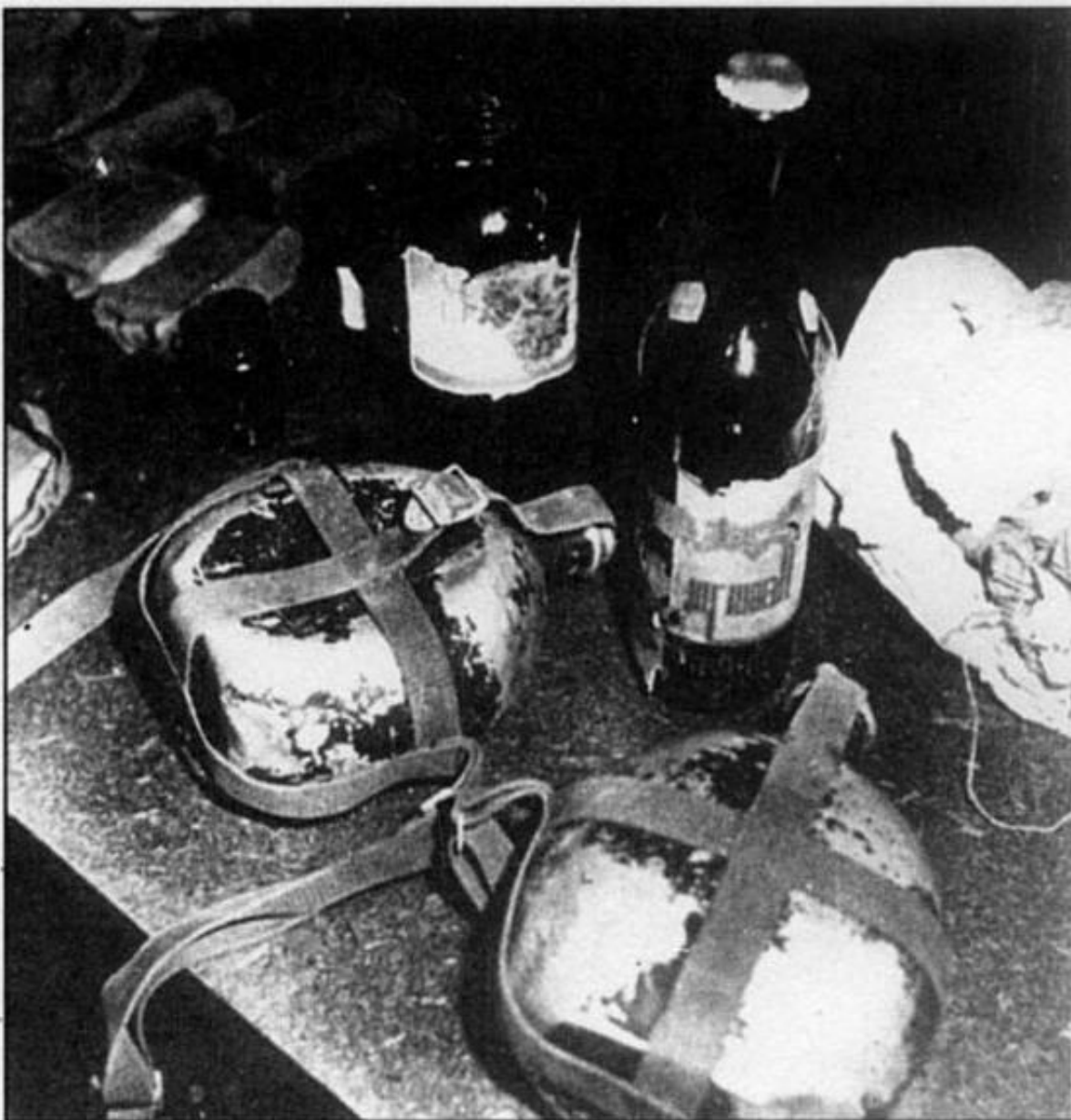
Буылки и фляги со спиртом, котрым согривались китайские солдаты, уквившиеся на острове Даманском в ночь на 2 марта 1969 г.