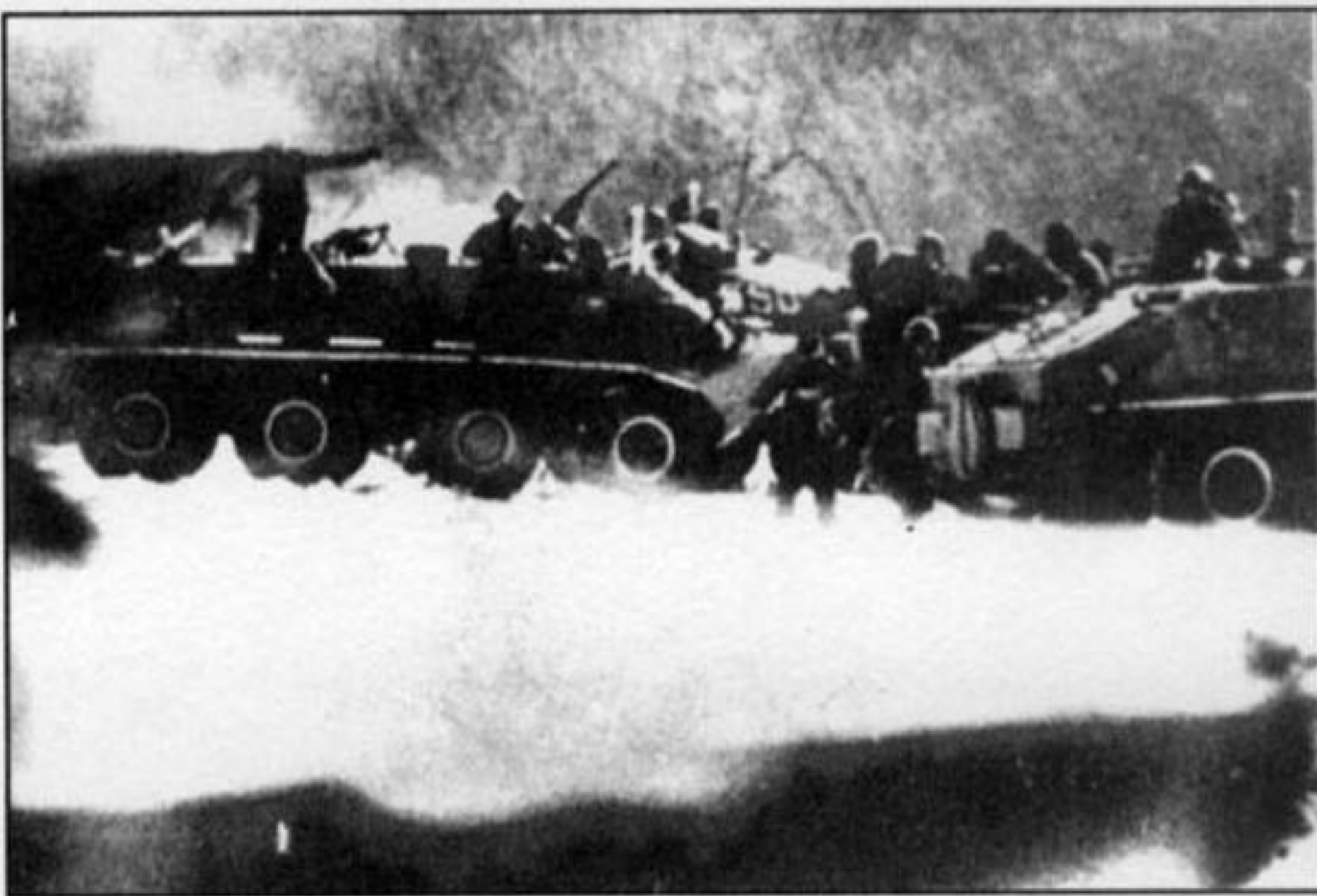
БТР-60П из подразделения Е. Яншина. 15 марта 1969 г.