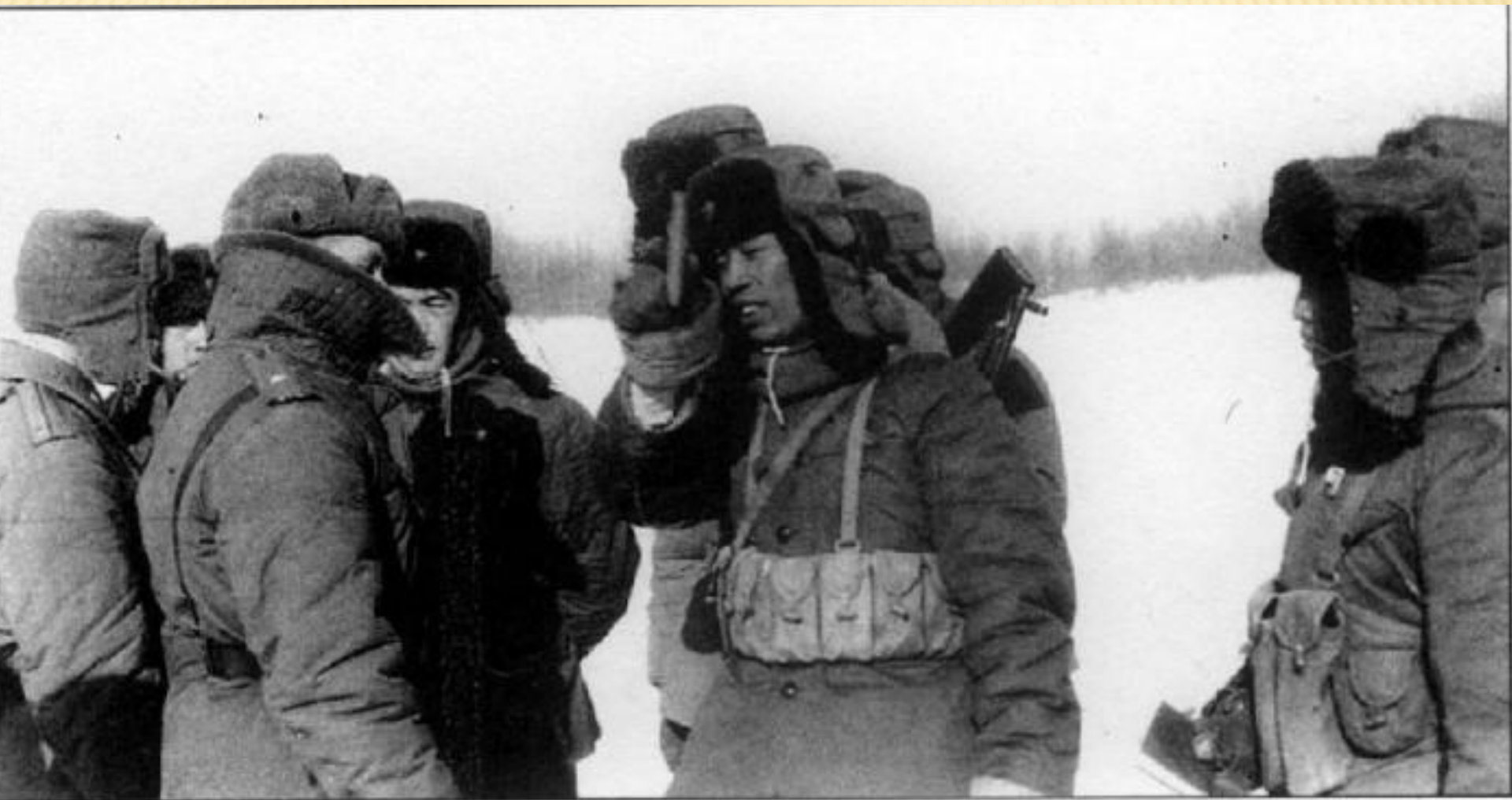
Китайские военнослужащие с цитатниками Мао в руках спорят с советскими офицерами о границе