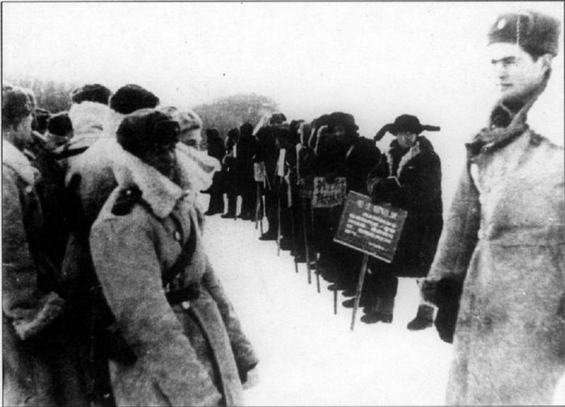
Очередное противостояние советских пограничников и китайских провокаторов на острове Киркинский.