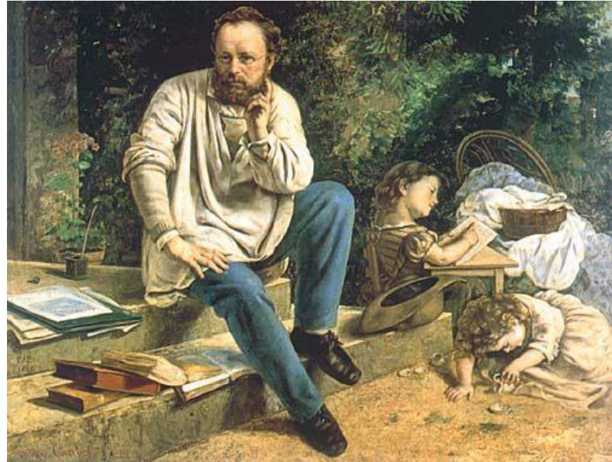
Пьер – Жозеф Прудон