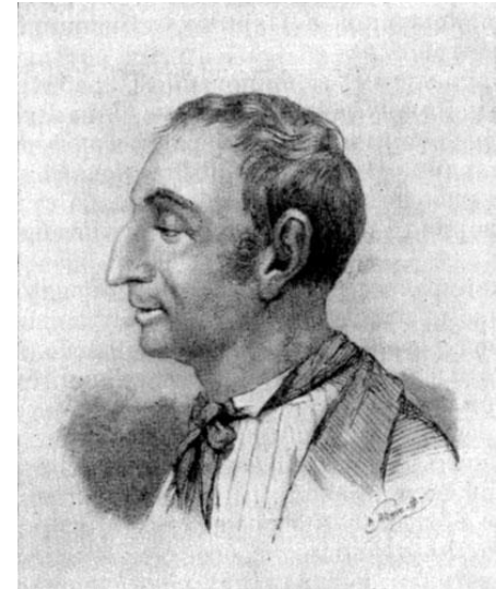
Клод-Анри Сен Симон