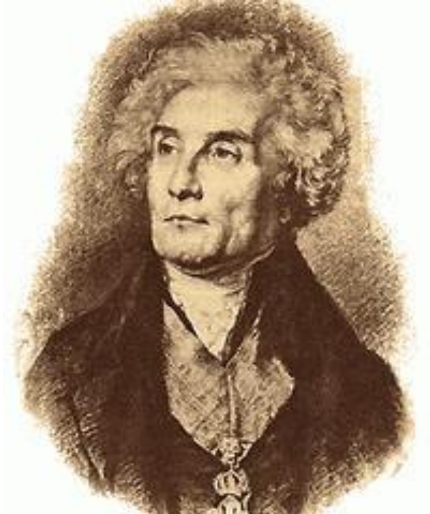
Жозефа де Местра