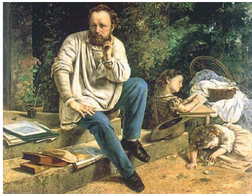
Пьер – Жозеф Прудон