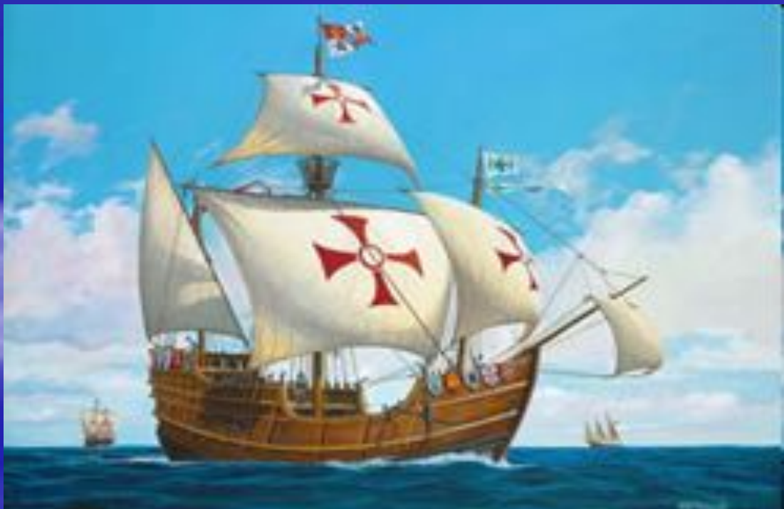
«Санта-Мария» Флагманский корабль, на котором находился Христофор Колумб