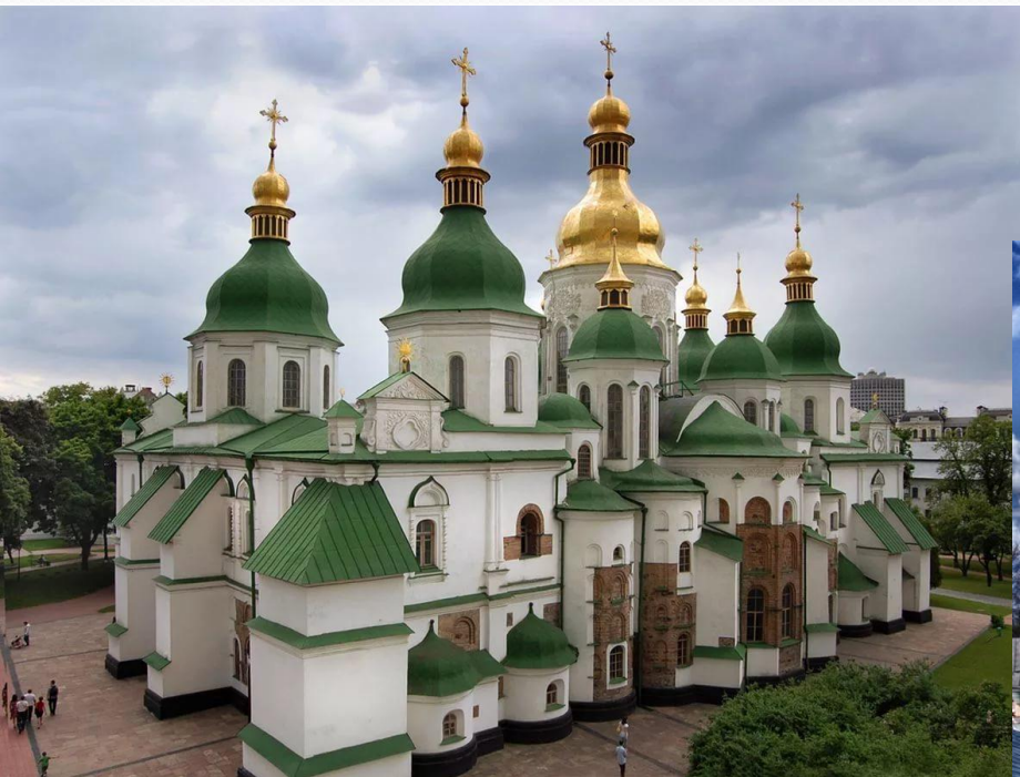
Софийский собор в Киеве