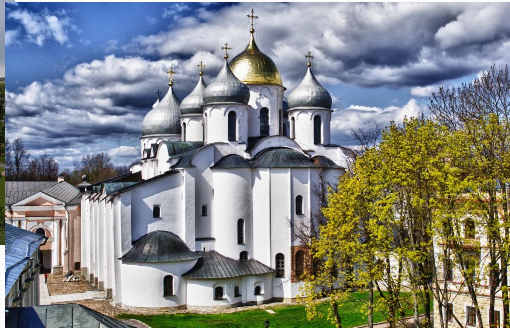
Софийский собор в Новгороде