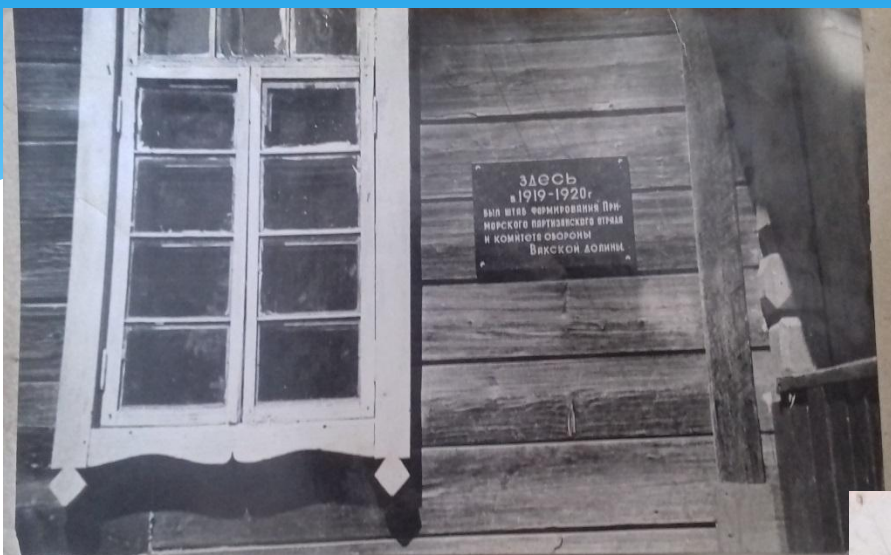
Здание школы в с. Ракитное Дальнереченского р-она

В 1919-1920 в здании школы с. Ракитное находился штаб формирования Приморского партизанского отряда и комитета обороны Вакской долины