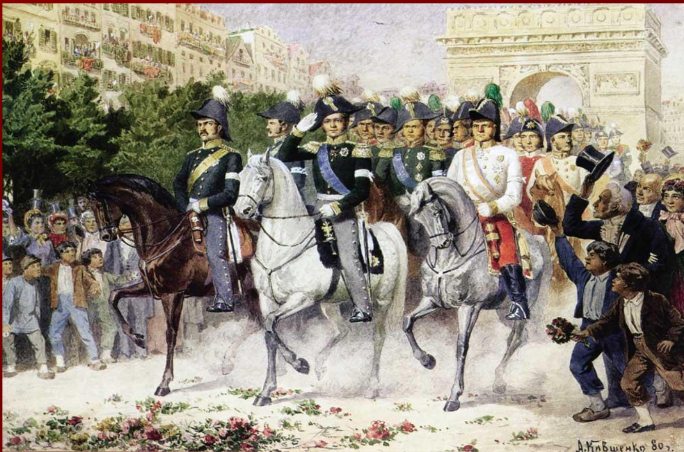
А. Кившенко. Вступление русских и союзных войск в Париж.