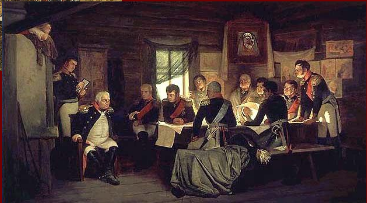
А.Кившенко. Военный совет в Филях