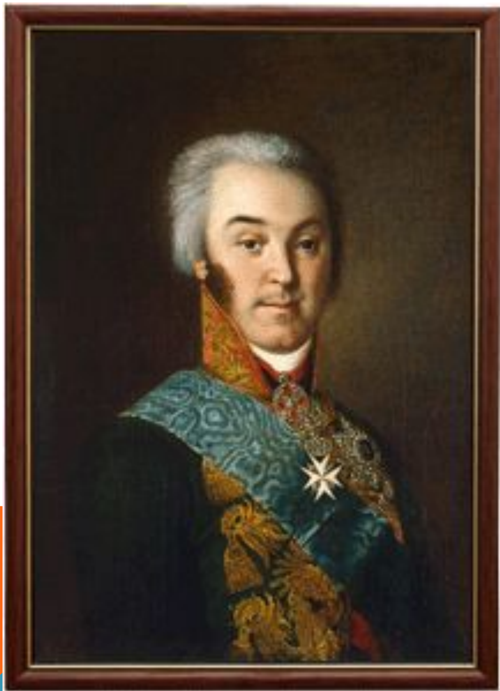
Граф Н.П. Шереметев