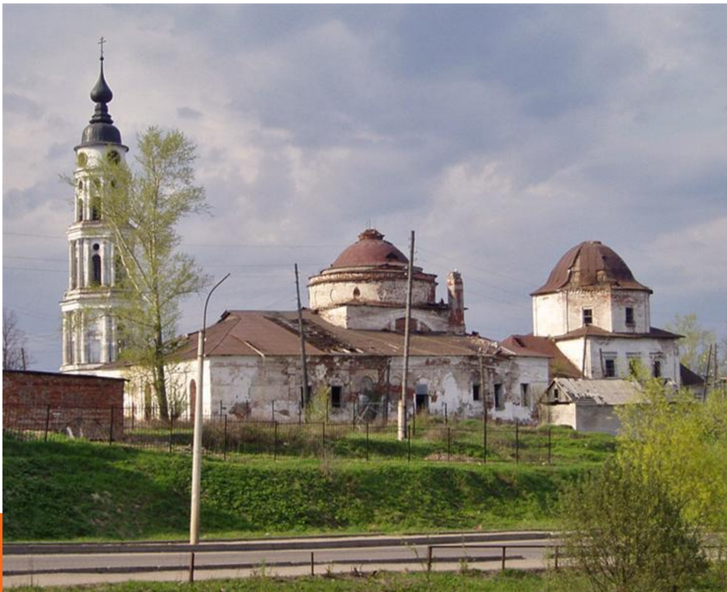
Троице-Знаменская церковь в п.Лежнево