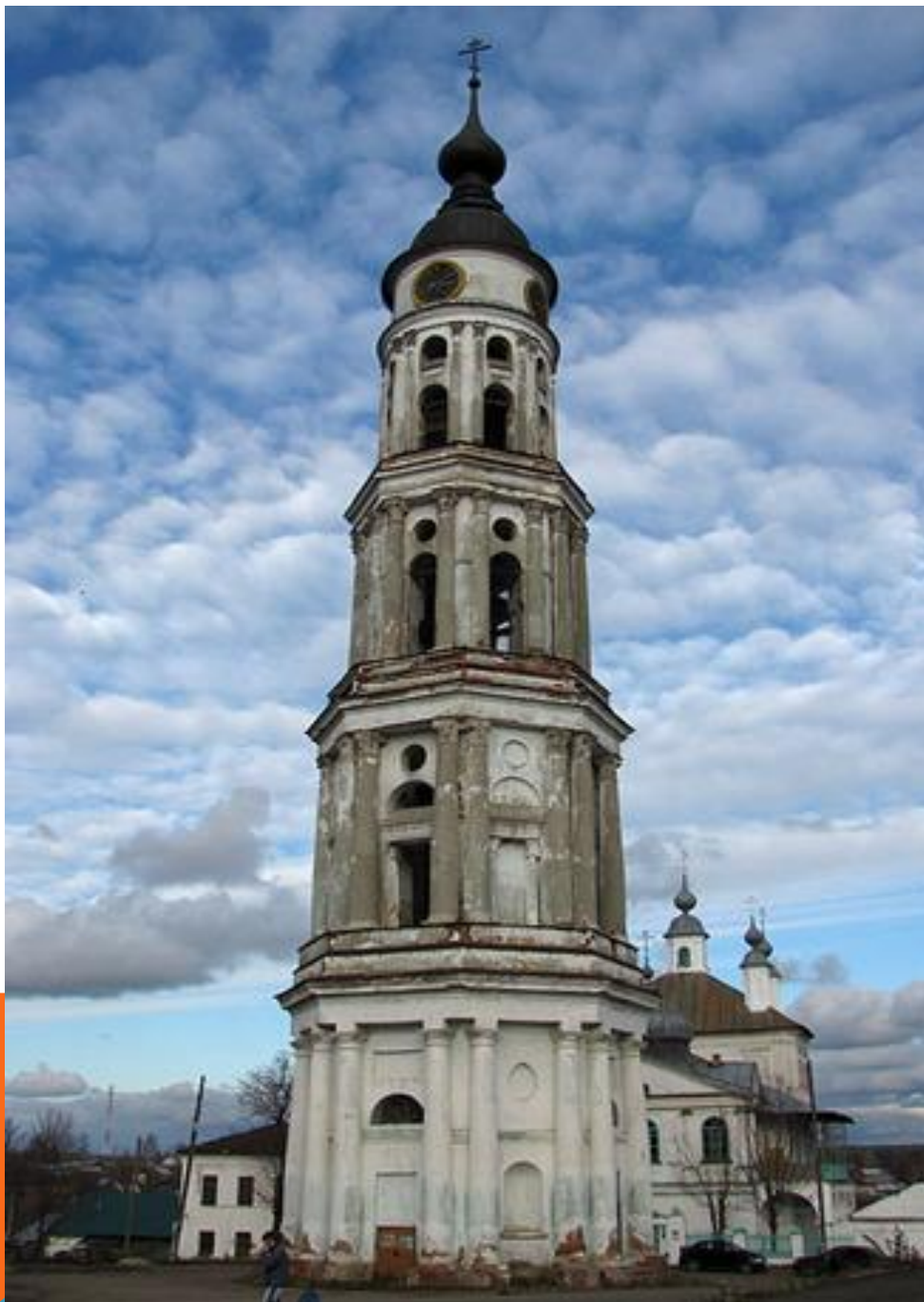
Колокольня Троице-Знаменской церкви п.Лежнево.