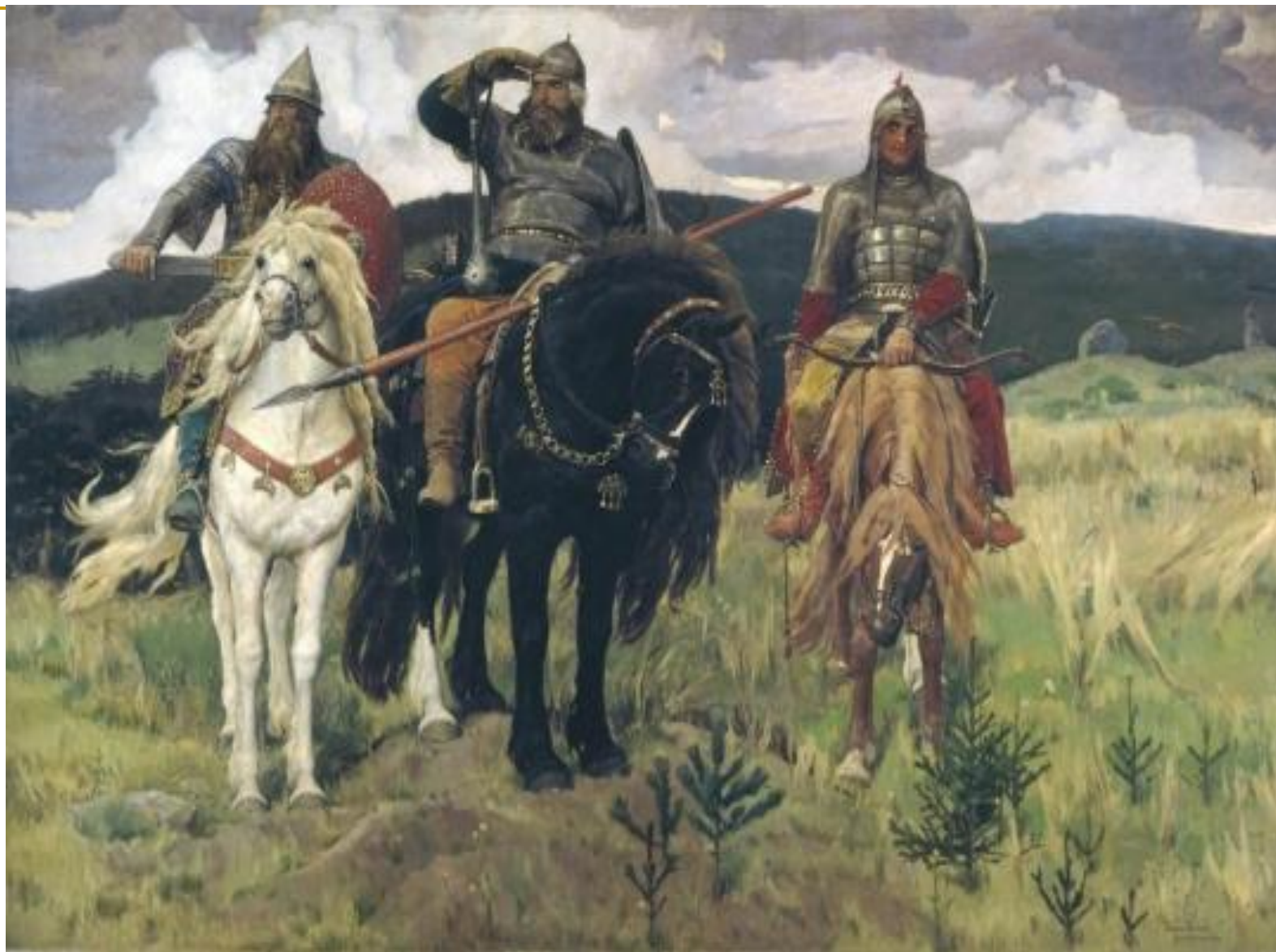
В.М. Васнецов. Богатыри.