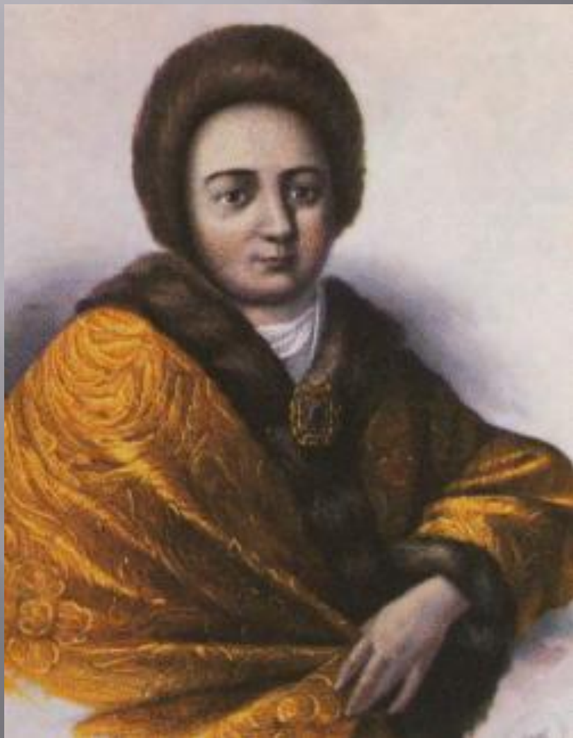
Наталья Кирилловна Нарышкина

Появилась портретная живопись – создавались парсуны