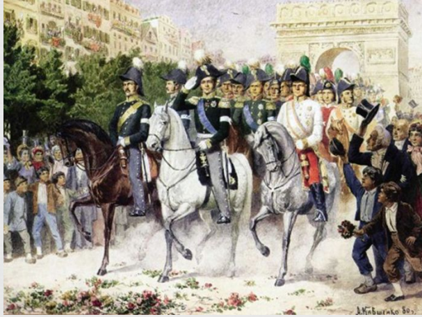
Русские войска входят в Париж 1814 г.

Заграничный поход 1813 г. - это цепь новых славных побед русской армии под командованием Кутузова. В результате активных действий русских войск 25 декабря 1813 г. был взят Кенигсберг, за ним пали Плоцк и Варшава. Русская армия вышла к Висле и, перейдя ее, заняла Познань, Калиш и Торн. Вскоре был взят Берлин, а после нового замечательного маневра, осуществленного Кутузовым в целях концентрации сил для новых решительных боев, русские овладели Дрезденом и Лейпцигом. Но Кутузову не довелось больше встретиться с Наполеоном - 16 (28) апреля великий полководец скончался. И в этой войне Кутузов нашел замечательные по глубине стратегические решения. Используя национально-освободительную борьбу угнетенных Наполеоном народов Европы, он создавал благоприятную обстановку и для действий своей армии.