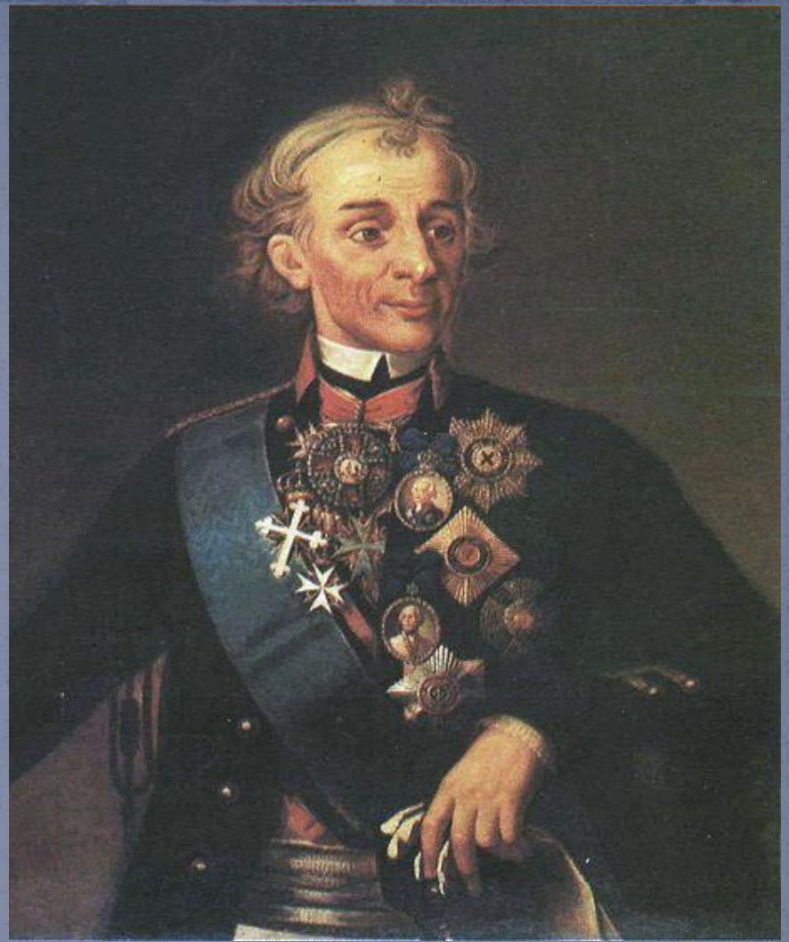
А В Суворов