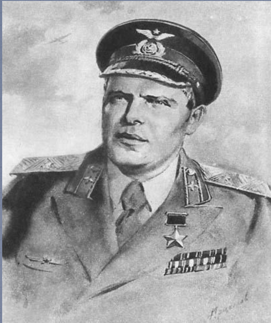
Михаил Васильевич Водопьянов