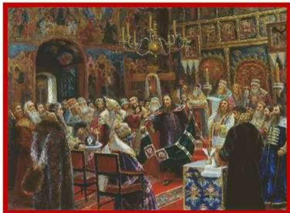
Суд над патриархом Никоном (С. Д. Милорадович, 1885 год)