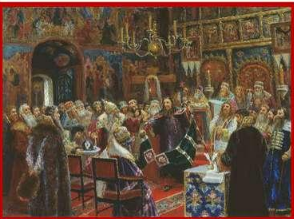
Суд над патриархом Никоном (С. Д. Милорадович, 1885 год)