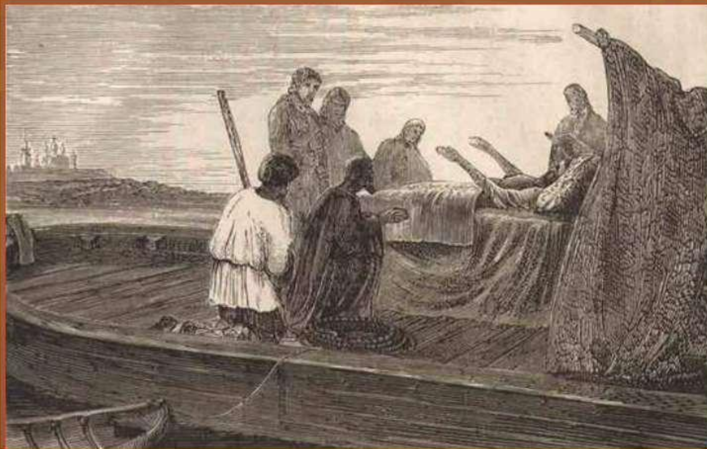
Смерть патриарха Никона (гравюра, 1870-е годы)

В 1681 году Никону разрешили переехать в Вознесенский Новоиерусалимский монастырь. Однако престарелый Никон умер в дороге близ Ярославля 17 августа 1681года.