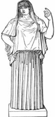
THE GIUSTINIANI HESTIA. (Rome, now in the Vatican Museum.)

Афродита — богиня любви и красоты . Она родилась от брака Зевса и богини Дионы (по другой легенде — вышла из морской пены, отсюда ее титул Анадиомена, «пенорожденная»).