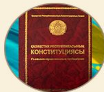
20 летие Конституции РК