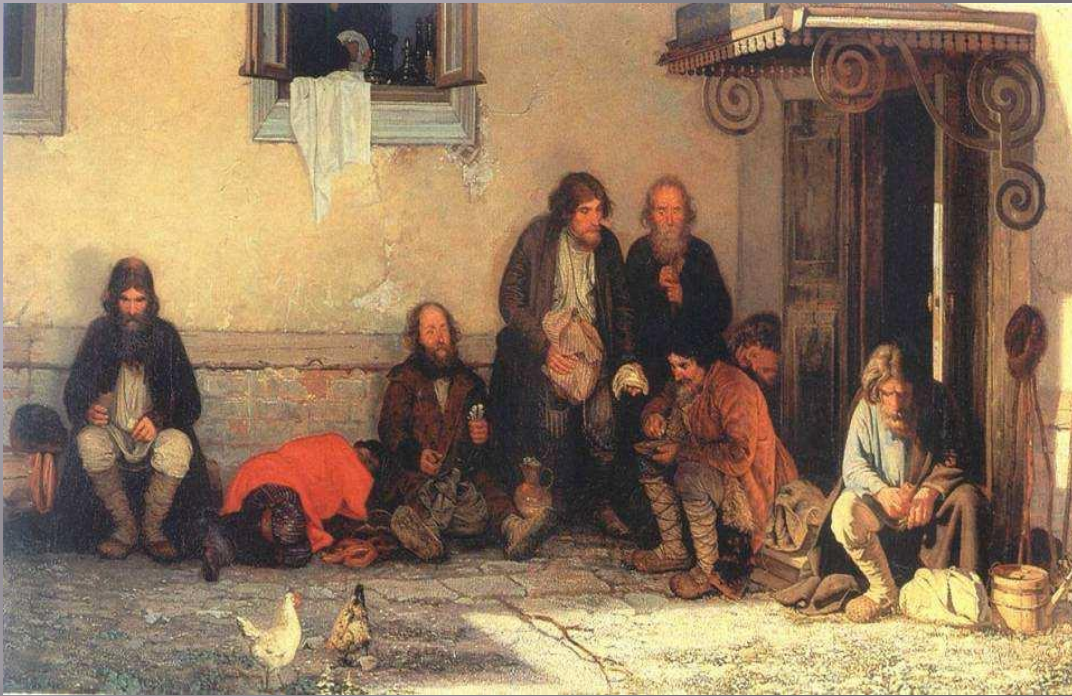
Г. Мясоедов. «Земство обедает»

Земства — выборные органы местного самоуправления (земские собрания, земские управы) в России.