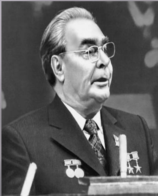
БРЕЖНЕВ ЛЕОНИД ИЛЬИЧ