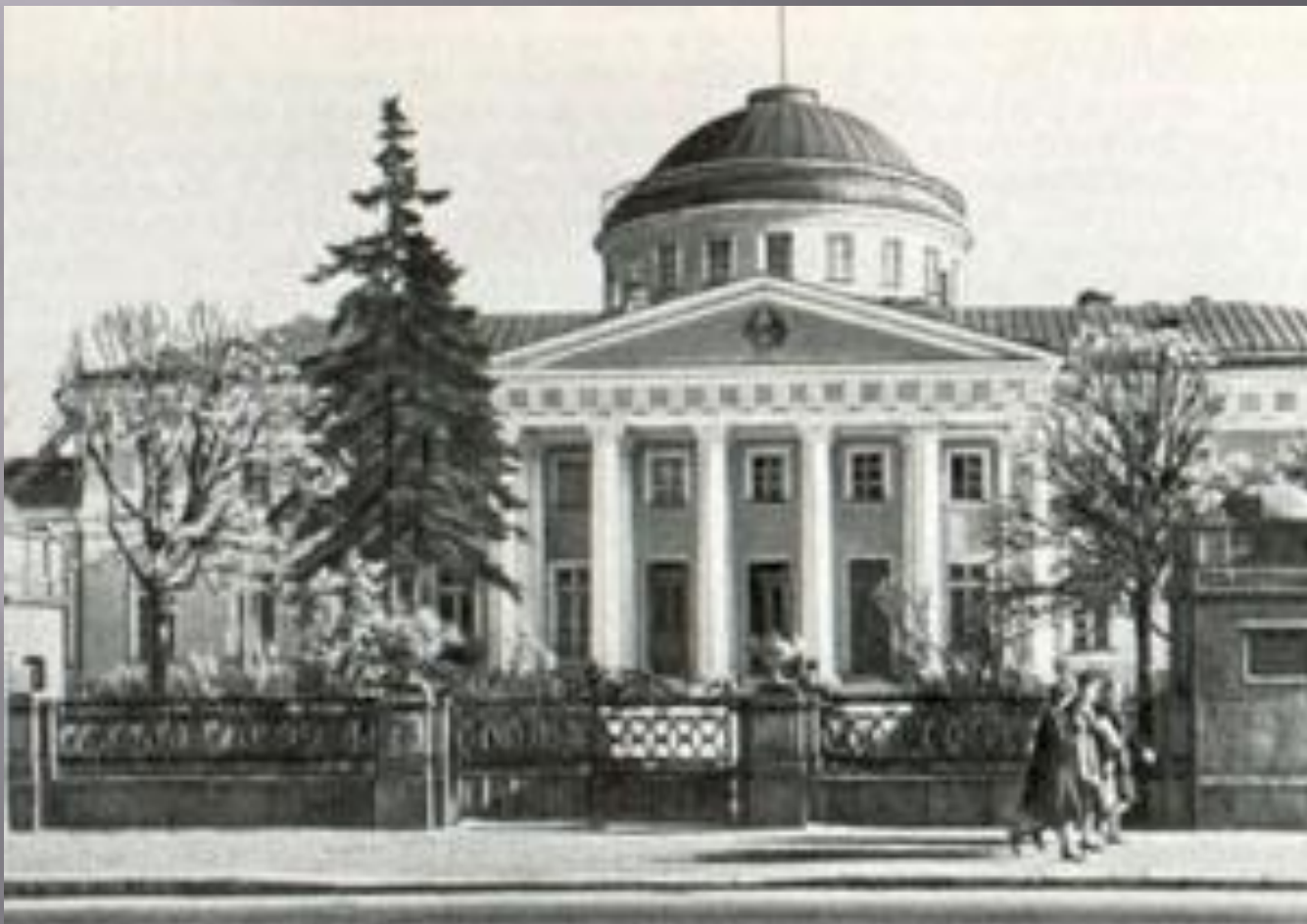
Таврический дворец. Петроград

Здесь, в Таврическом дворце Петербурга, заседали депутаты первого парламента - Государственной Думы.