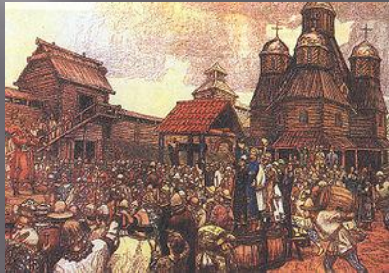
В. М. ВАСНЕЦОВ «ПСКОВСКОЕ ВЕЧЕ»