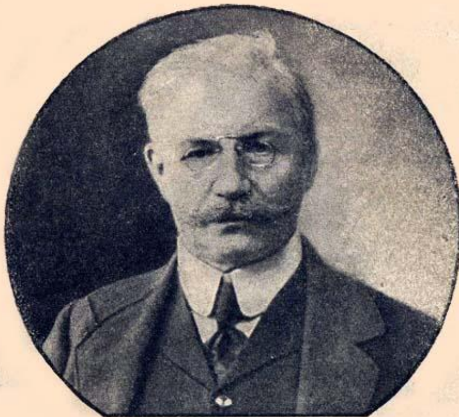
П. Н. Милюковъ, министр иностранныхъ дѣлъ (членъ Г. Думы отъ гор. Петрограда).

Павел Николаевич Милюков –лидер партии конституционных демократов. Стоял у основ российского парламентаризма.