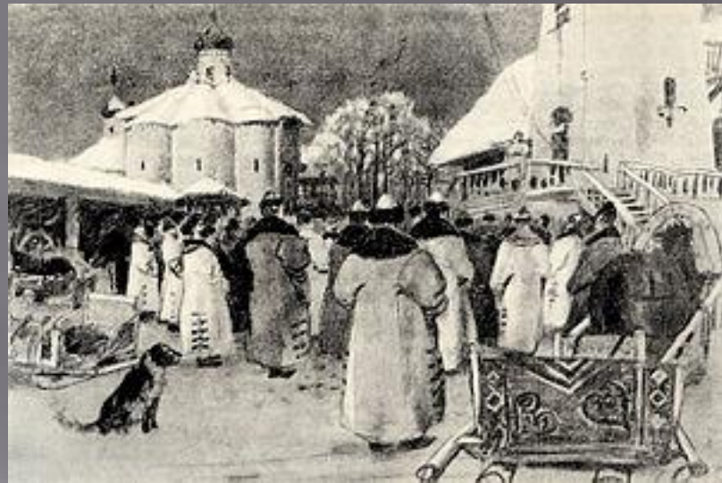
А. П. РЯБУШКИН «НОВГОРОДСКОЕ ВЕЧЕ»

Вече — народное собрание на Руси в X – начале XVI вв. — и во всех народах славянского происхождения, до образования государственной власти раннефеодального общества — для обсуждения общих дел и непосредственного решения насущных вопросов общественной, политической и культурной жизни. Одна из исторических форм прямой демократии на территории славянских государств. Участниками вече могли быть «мужи» — главы всех свободных семейств сообщества (племени, рода, поселения, княжества).