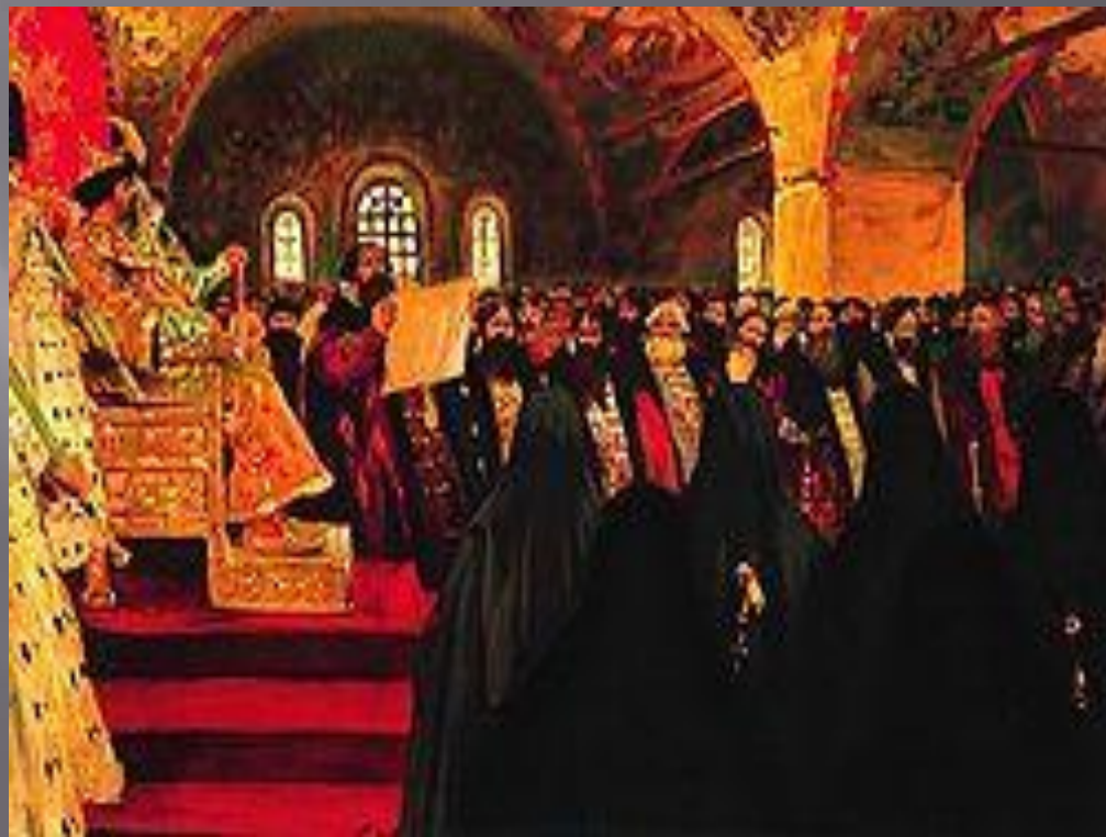
С. Иванов «Земский собор»