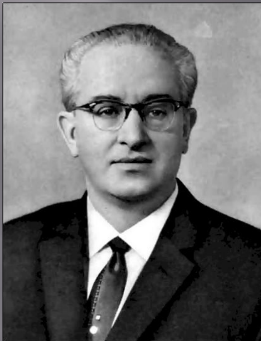
АНДРОПОВ ЮРИЙ ВЛАДИМИРОВИЧ