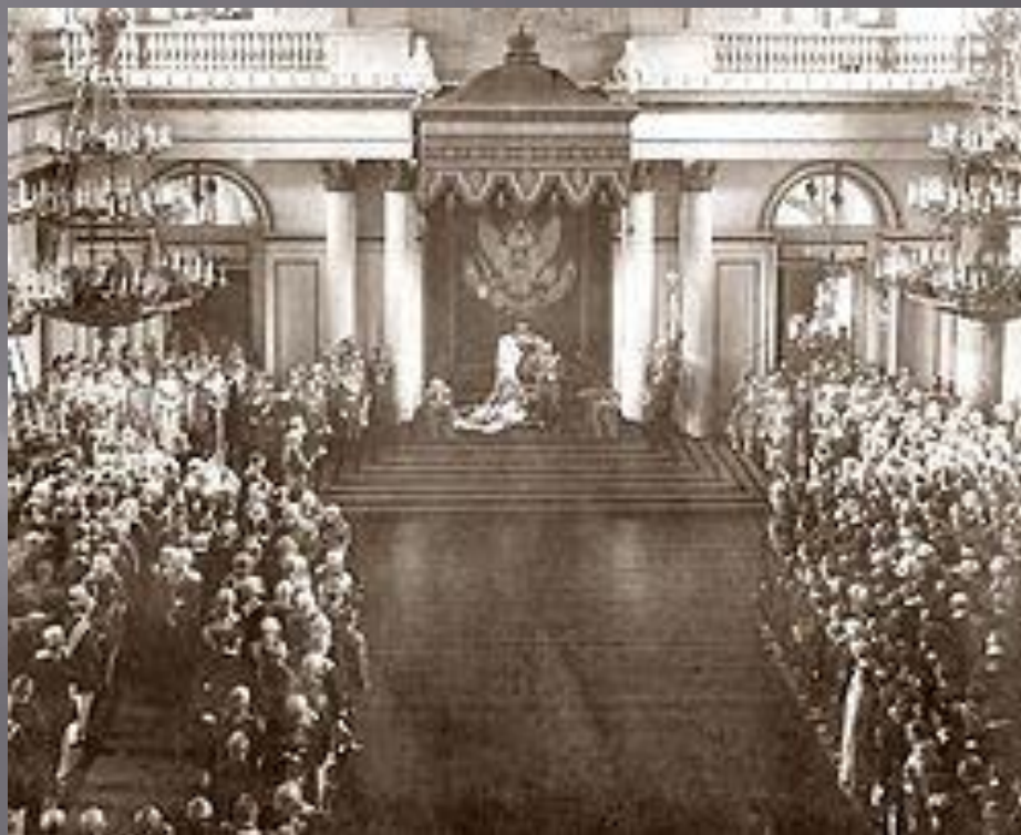
Торжественное открытие Государственной думы и Государственного совета. Зимний дворец. 27 апреля 1906.

Дума рассматривала законопроекты, которые затем обсуждались Государственном совете и утверждались императором Российской империи.